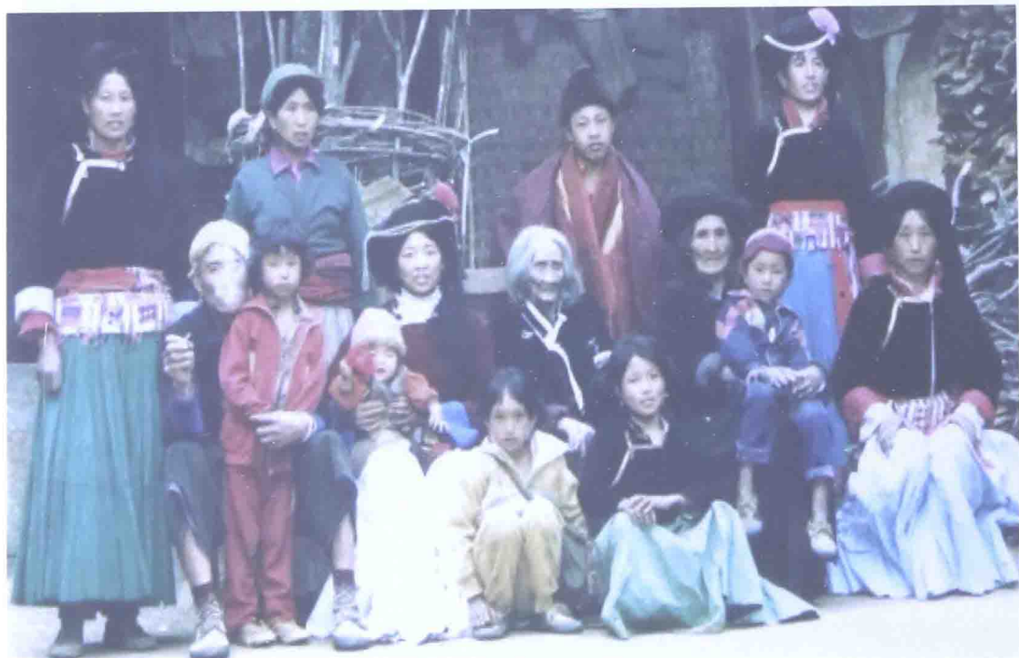
母舅家庭(四世同堂)