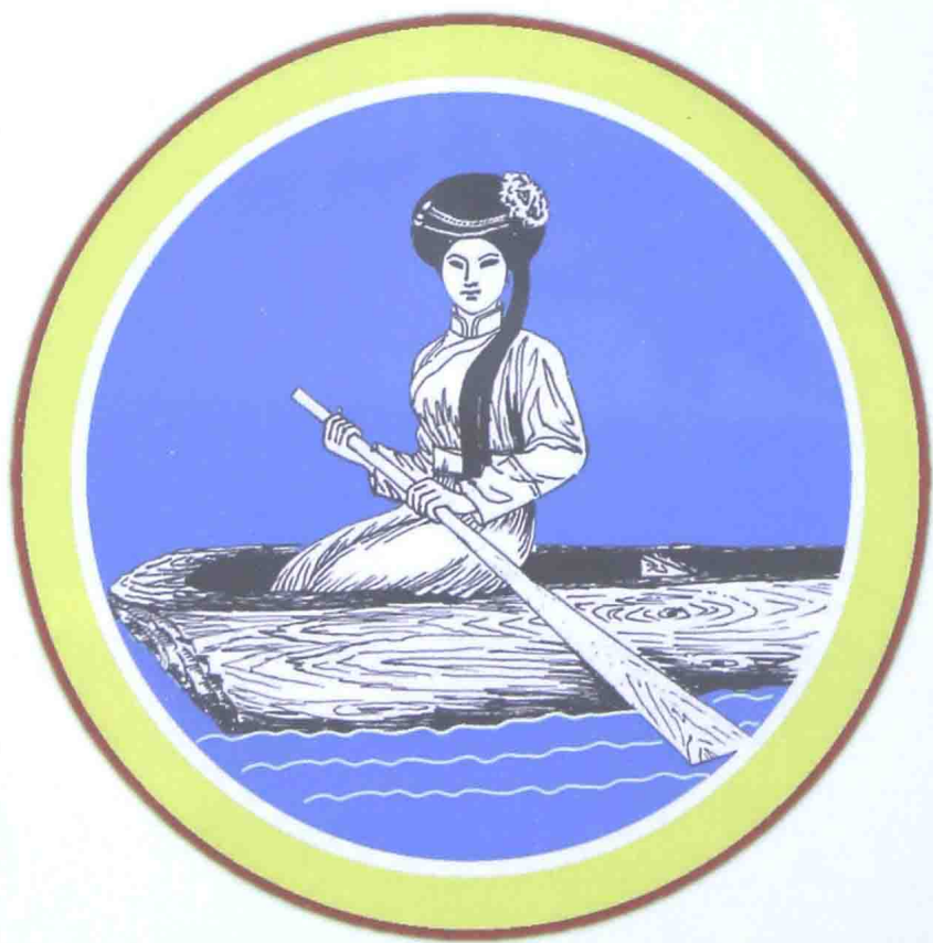
格姆女神：摩梭维纳斯