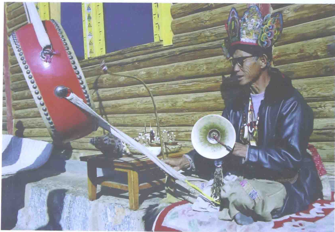
达巴：摩梭人的智者