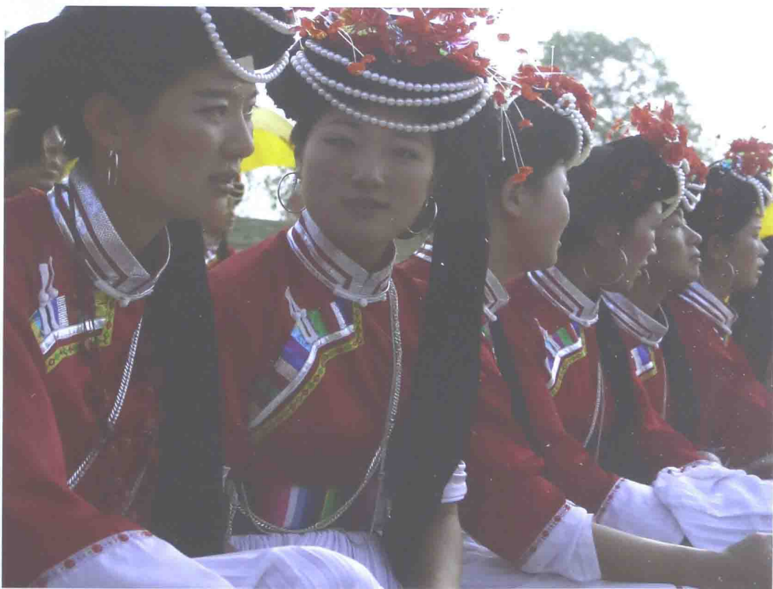
内热外冷,各有所思