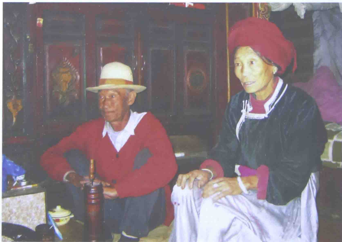
兄妹支撑的母舅家庭