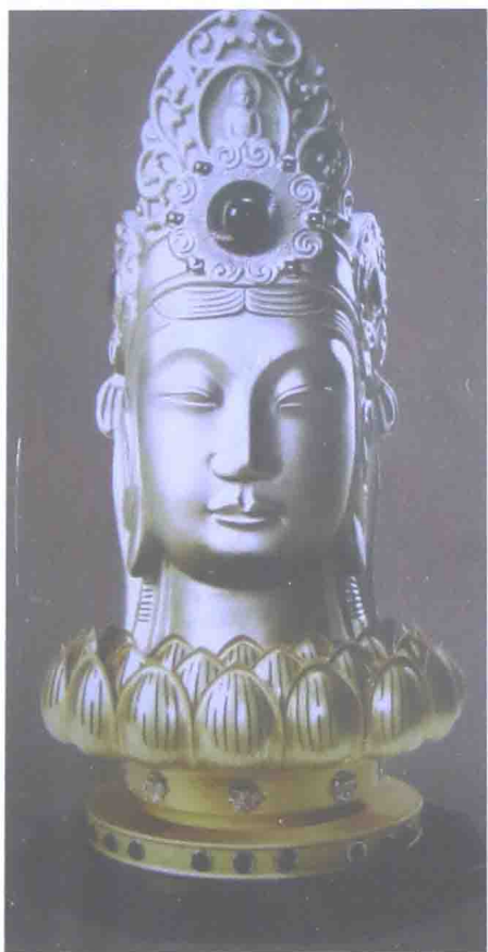
东方美神：中国维纳斯