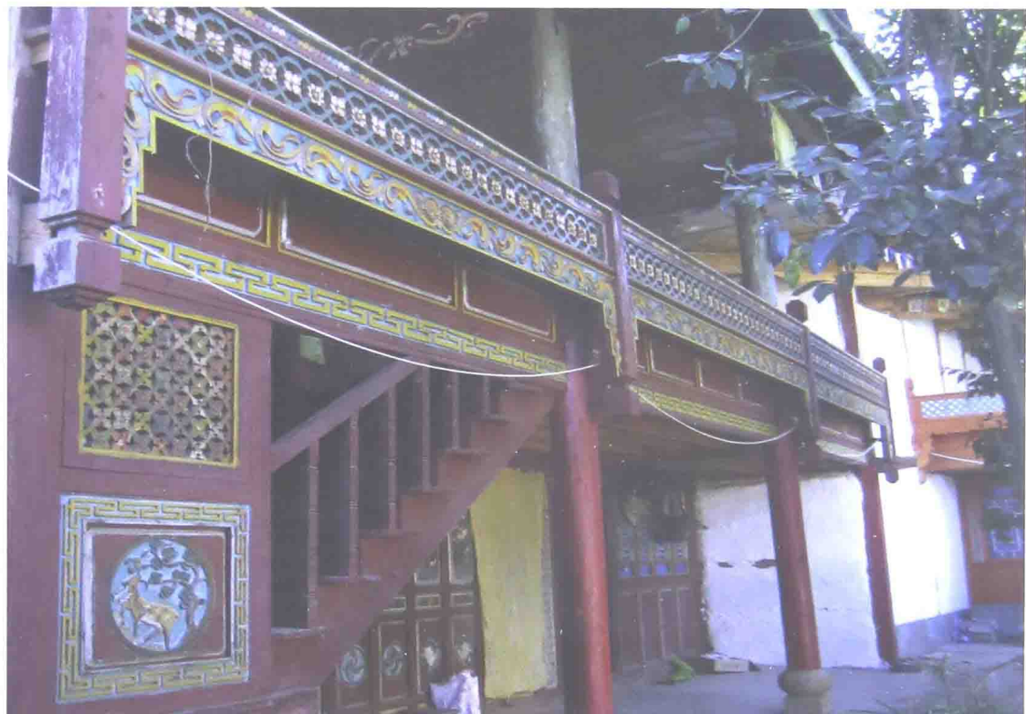
花房(正面):接待阿夏来访的闺房