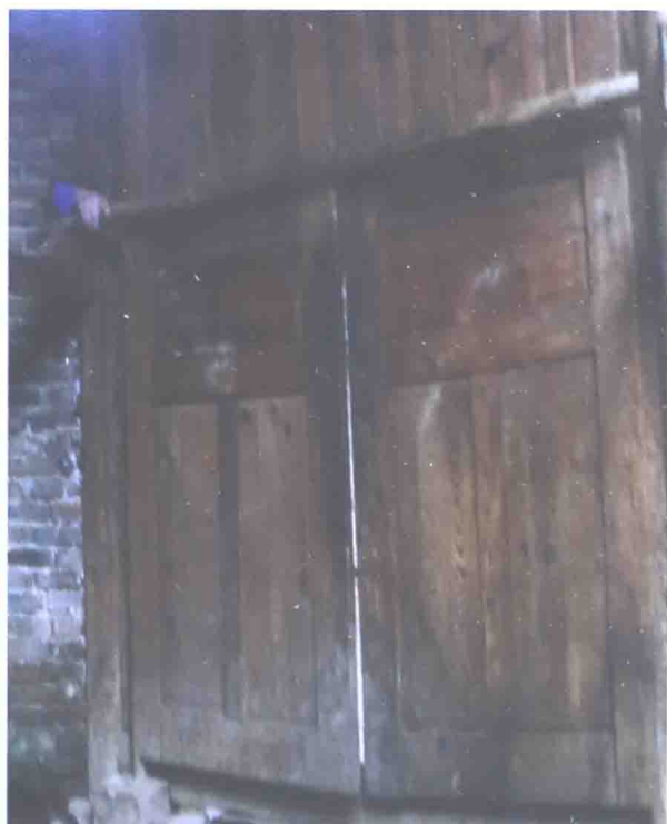
悄悄进去,防外不防内