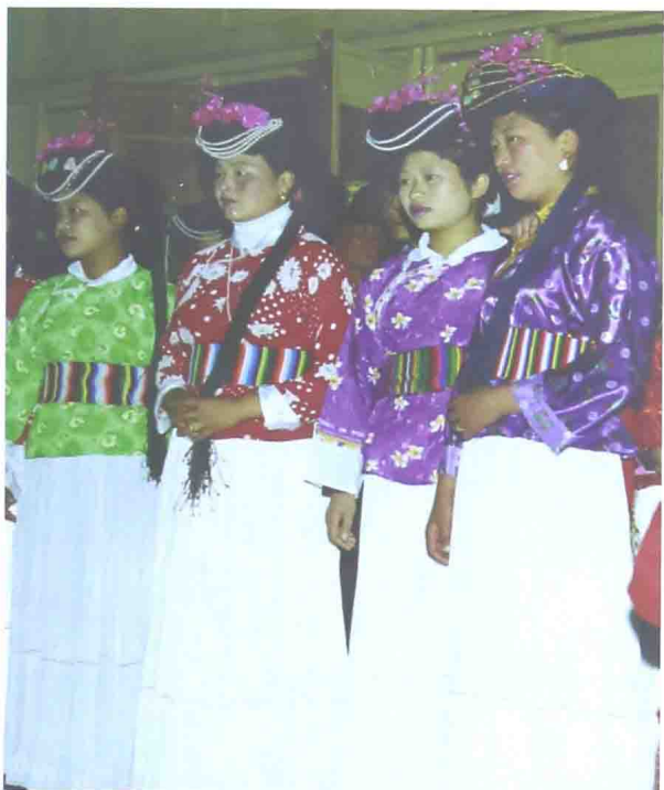
可人开朗,表里俱美