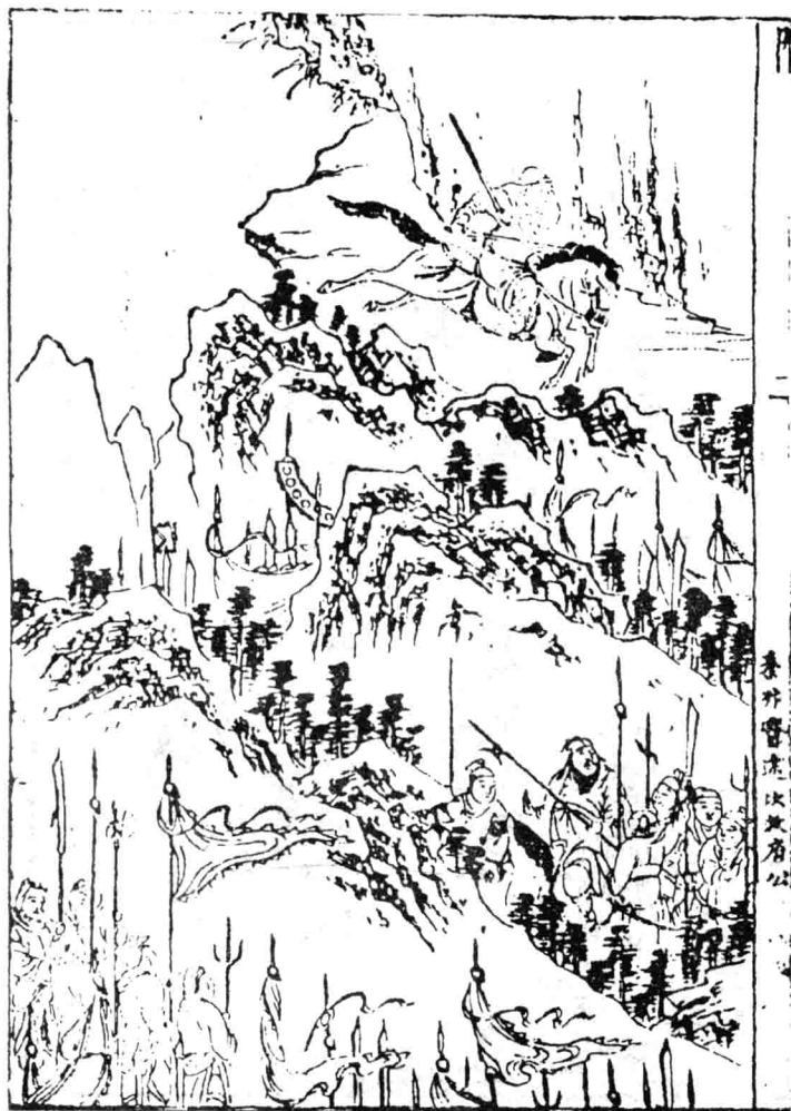
秦邦魯渡汝水府公