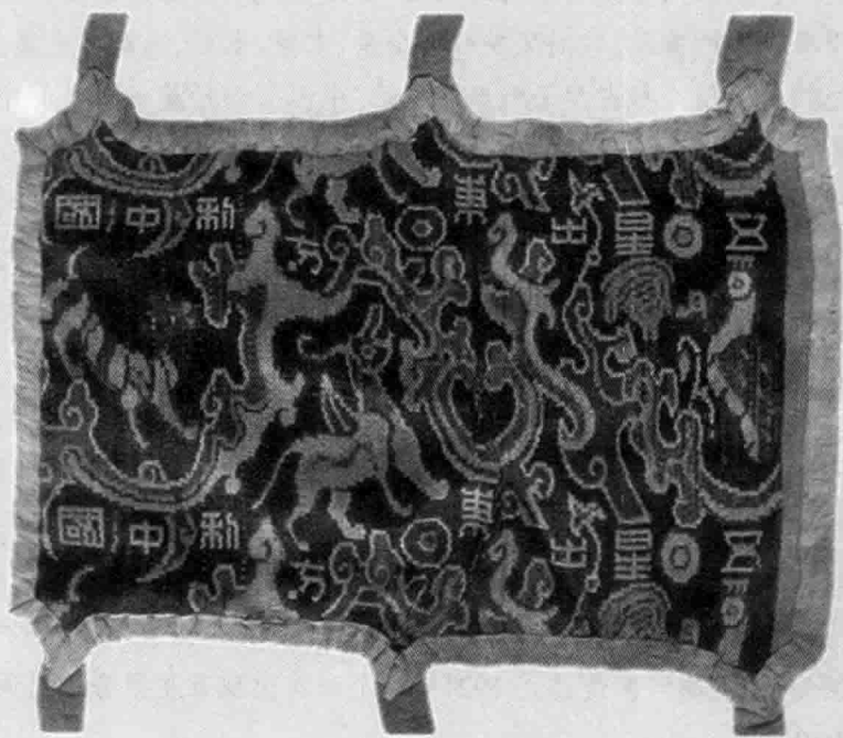
1-1 “五星出东方利中国”彩锦护膊 汉魏 纵 11.2 厘米、横 16.5 厘米 1995 年新疆民丰县尼雅遗址出土