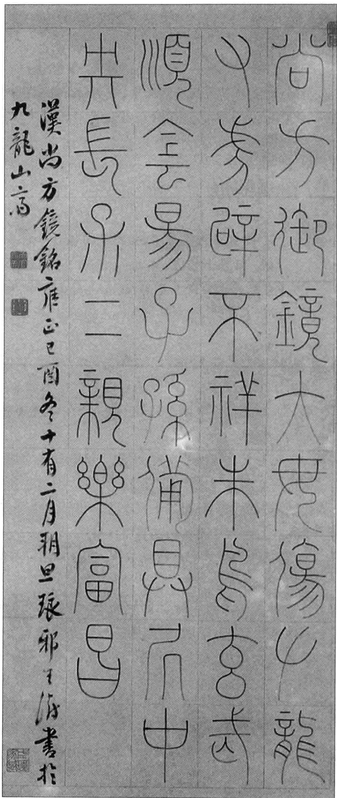
1-2b 王澍(shù)篆书汉尚方镜镜铭 清代 纵 130.6 厘米、横 59.4 厘米 上海博物馆 收存

王澍写的镜铭是：“尚方御镜大母(wú)伤，左龙右虎避不祥，朱鸟玄武顺阴阳，子孙备具居中央，长保二亲乐富昌。”