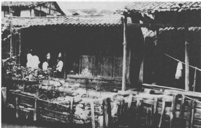
■ 20世纪50年代初拍摄的陈云故居

由于舅舅爱好文艺,因此舅舅和舅母常去听评弹,这时他们总是带陈云同去,使陈云幼小的心灵受到了真善美的教育。像包公铁面无私,武松打虎,张飞威风凛凛等,都给陈云留下了深刻的印象。从此,陈云深深地爱上了评弹这门古老的民间艺术,并将这种爱好一直保持到晚年,以至于被人们亲切地称为“评弹的老听客”。1959年,陈云饶有兴趣地回忆说,小时候我常跟娘舅去听书,当时的书场大都设在茶馆里,听书的要付3个铜板买一根竹筹,才好在场子里坐着听。书好听就天天去听,有时大人不去,就自己去了。没有那么多的钱买竹筹,只好站在书台对面墙角边上,老远地听先生说书。显而易见,这段话不仅道出了廖家的贫寒,也说明了陈云和娘舅的深厚感情。