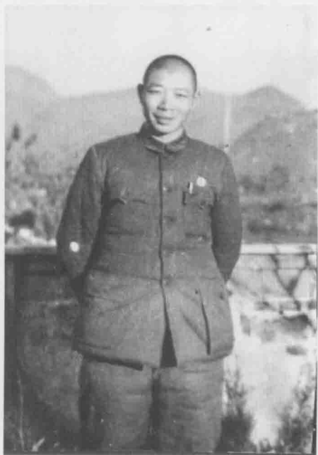
解放战争时期的爷爷