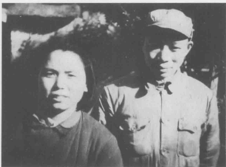
1944 年底，爷爷和奶奶在延安中央党校 2 部