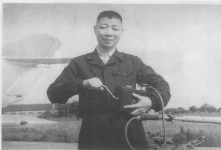
当机务兵检查飞机空速管