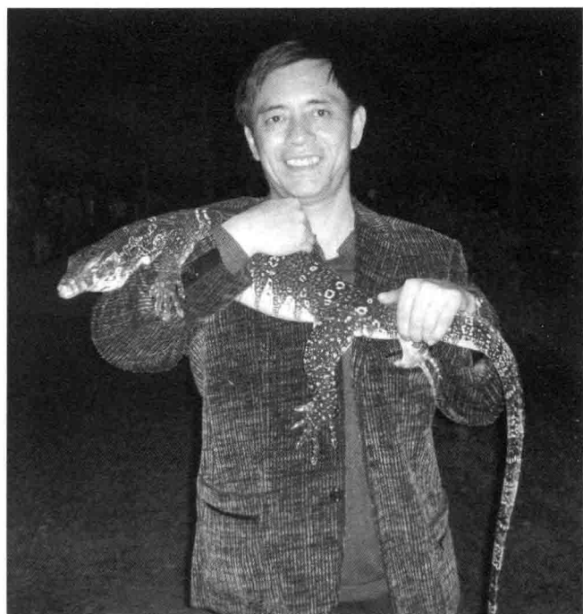
沈石溪与他笔下小朋友喜欢的“珍珠蜥蜴”