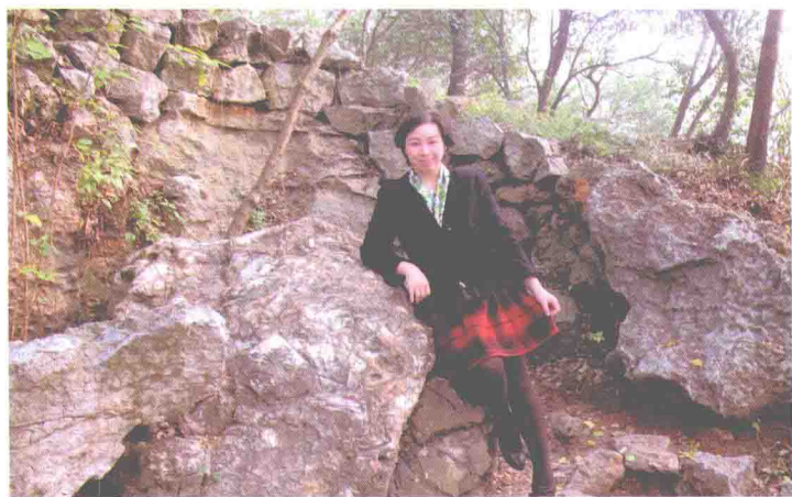
2013年11月22日 苏州三山岛留影