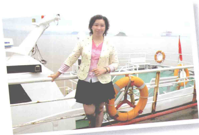
2014年5月19日 在浙江普陀六横码头海轮上