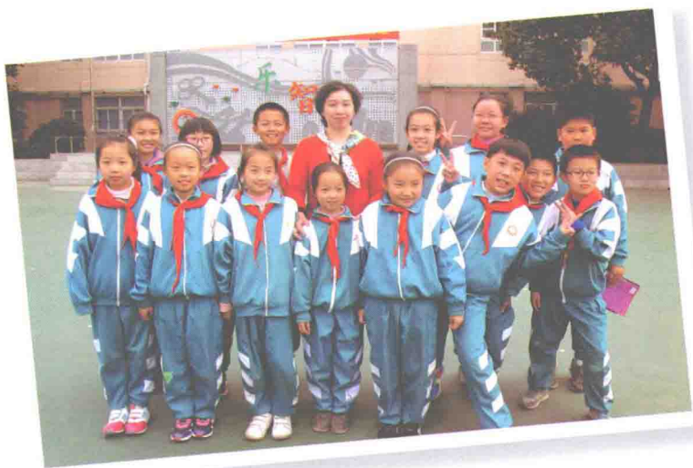
2013年11月13日 和南京梅山小学的孩子合影