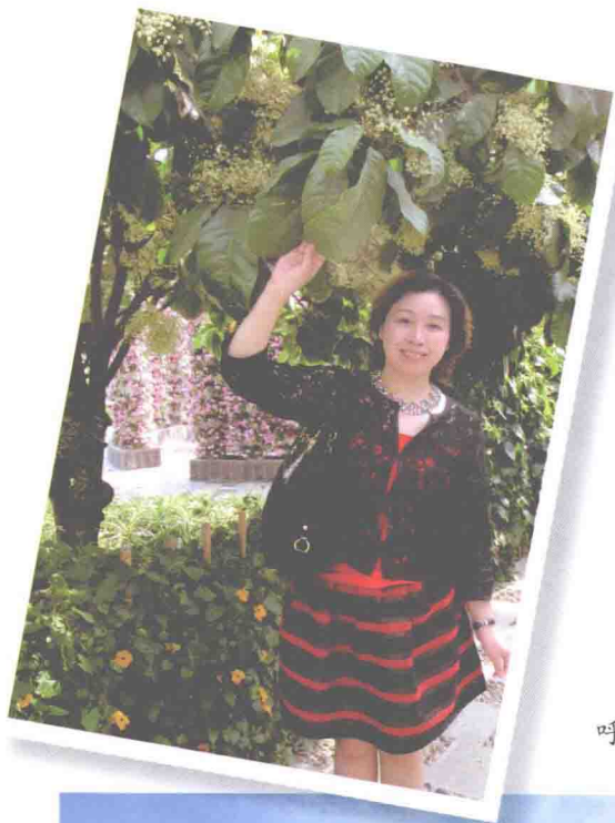
2013年5月1日 苏州太仓农业园