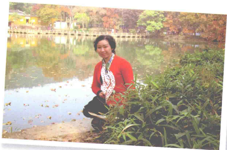
2013年11月21日 苏州天平山留影