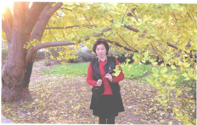
2013年12月1日 苏州西山的银杏树