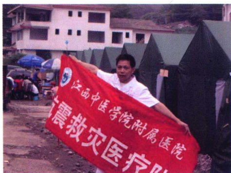
2008年四川汶川地震救灾