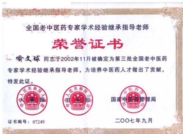
喻文球教授被评为第三批全国老中医药专家学术经验继承指导老师