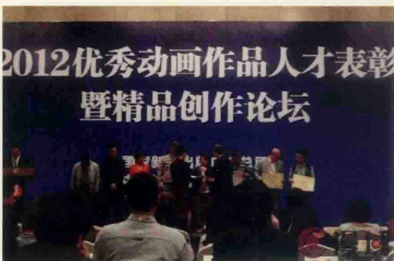
▲ 2012年度优秀动画作品人才表彰大会暨精品创作论坛现场