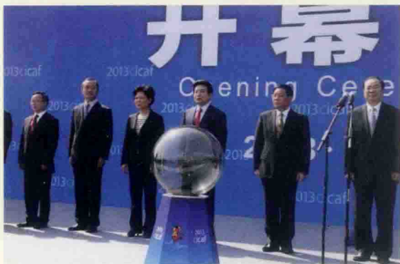
▲ 第九届中国国际动漫节开幕式现场

本届动漫节坚持“亲民、为民、惠民”的办节宗旨，将激发动漫梦想、培育创意土壤作为办节的一个重要目的，在项目设计、活动安排、服务保障等各个方面充分考虑市民参与互动的便利性，极大地调动了大众参与热情，丰富了市民群众特别是青少年的精神文化生活。