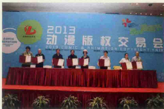
▲ 动漫版权交易会签约现场

本届中国国际漫画节的动漫版权交易会吸引了众多的海内外动漫机构及平台参与其中，有效地促进了资源互补与整合。由于动漫版权的合作和贸易是动漫产业的核心和基础，主办方可谓想企业所想，不仅搭建了版权交易平台，也为企业、风险投资机构等就项目合作运营、投融资等牵线搭桥，有效促进了行业协作与产业链的良性衔接。