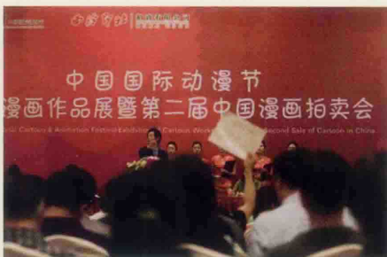
▲ 名家漫画作品展暨第三届中国漫画拍卖会现场