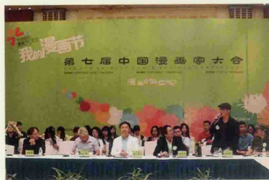
▲ 第七届中国漫画家大会活动现场

第六届中国国际漫画节于2013年9月28日至10月5日在广州中山纪念堂举行,该漫画节由国家新闻出版广电总局和广东省人民政府共同主办,广州市人民政府、广东省新闻出版局承办,广州市文化广电新闻出版局执行。中国国际漫画节作为国家“十二五”规划重点扶持的3个动漫节展之一,系目前国内规格最高、规模最大的国际性漫画产业盛会。本届漫画节包含中国动漫“金龙奖”颁奖典礼、动漫版权交易会、中国漫画家大会、中国国际漫画节展会以及“漫画节在身边”五项活动。