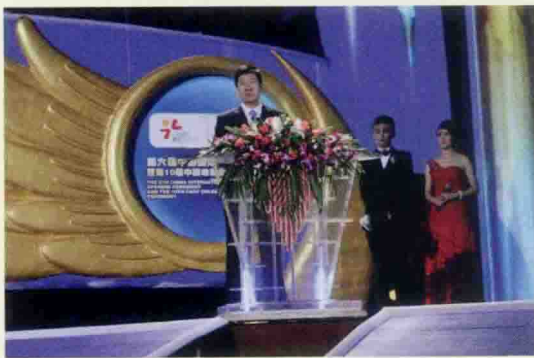
▲ 国家新闻出版广电总局副局长阎晓宏致辞