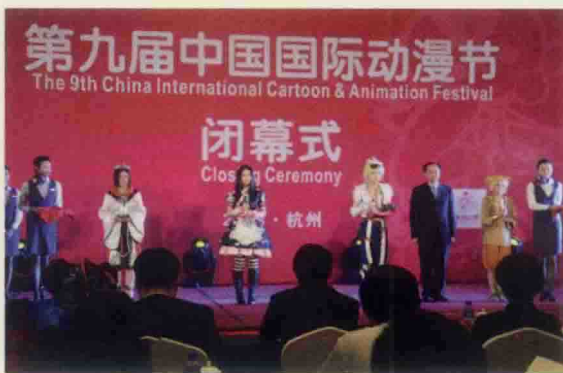
▲ 第九届中国国际动漫节闭幕式现场