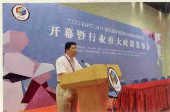
▲ 上海市委宣传部发布《2012年度上海动漫产业报告》和《2012年度上海游戏产业报告》

2013年7月11日至15日，第九届中国国际动漫游戏博览会 (CCG EXPO) 在上海世博展览馆举行。本展会由中华人民共和国文化部和上海市人民政府共同主办，上海市文化广播影视管理局、上海东方传媒集团有限公司 (SMG) 和 (上海) 国家动漫游戏产业振兴基地共同承办，迄今为止已经成功举办了8届。自2005年首届展会成功举办以来，经过8年的发展，年度性的CCG EXPO已形成了专业化、国际化、高层次、大规模的特点，并且确立了以商家对商家 (B to B) 为主、商家对终端用户 (B to C) 为辅的特色定位。