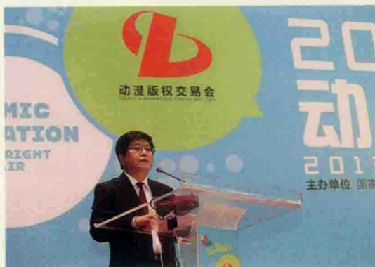
▲ 国家新闻出版广电总局版权管理司副司长汤兆志在动漫版权交易会上致辞