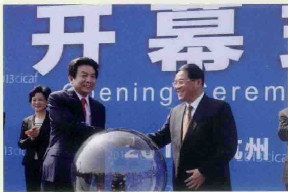
▲ 中宣部副部长、国家新闻出版广电总局局长蔡赴朝与浙江省委副书记、省长李强共同启动第九届中国国际动漫节