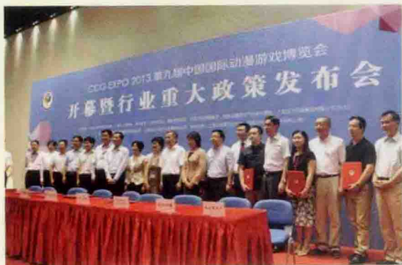
▲ 开幕式暨重大政策发布会