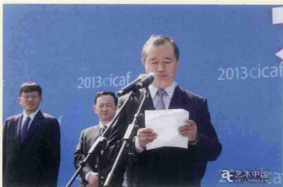
▲ 国家新闻出版广播电影电视总局副局长李伟致辞