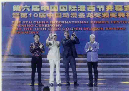
▲ “金龙奖”颁奖典礼现场