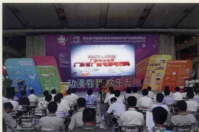
▲ 漫博会开幕式现场