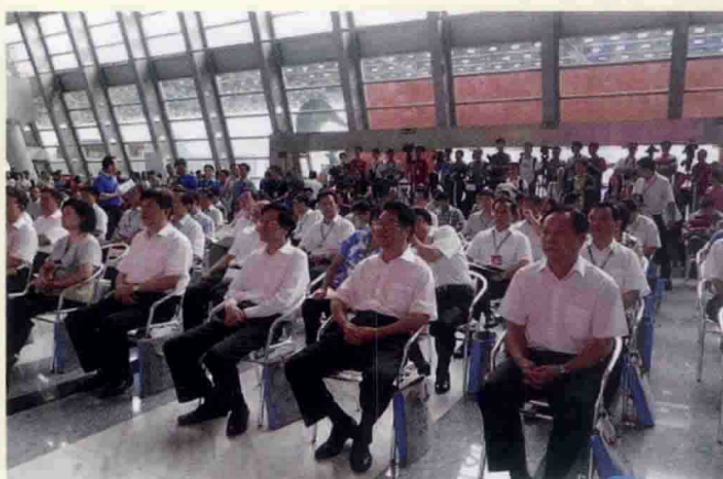
▲ 漫博会开幕式现场

2013年8月22日至26日第五届中国国际影视动漫版权保护和贸易博览会(以下简称“漫博会”)在广东省东莞市举行。本届博览会由国家新闻出版广电总局、国家版权局、广东省人民政府主办,东莞市人民政府等承办。本届漫博会设立了东莞市国际会展中心、松山湖展贸中心两大主会场以及3个分会场,其中规模最大的是东莞国际会展中心主会场,展会面积达5万平方米,设立综合展区、动漫原创展区、动漫游戏展区、动漫衍生品展区、品牌授权展区及互动体验展区等。漫博会参展企业达418家,除了中国本土企业外,还吸引了美国、英国、韩国、日本、西班牙等15个国家和地区的61家企业参展,比上届增长13%。漫博会现场共有6个项目成功签约,成交金额达33.5亿元。