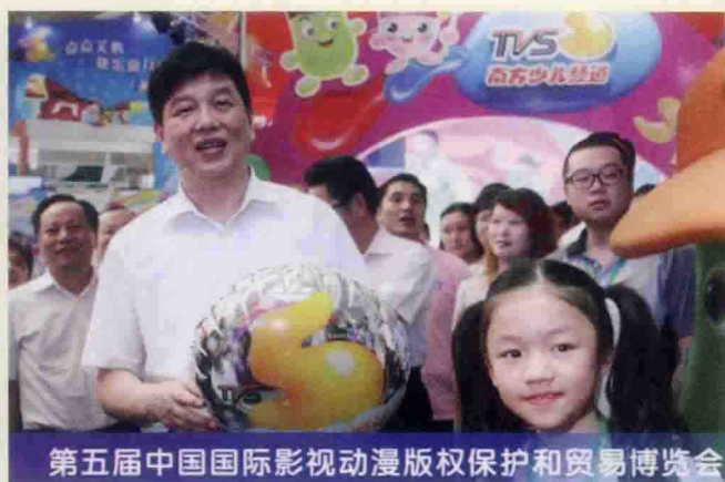
▲ 国家新闻出版广电总局副局长童刚在南方少儿频道展位现场