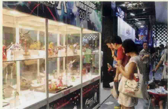
▲ 会展现场手办展览

中国动漫衍生产业高峰论坛是CCG的重要活动之一，迄今为止已举办4年，从“原创与衍生”到“动漫生活与衍生时代”，到“跨界合作，融合发展”，再到去年的“全媒体时代与大动漫发展”，在论坛的选题和与产业的及时关联方面，每年围绕中国动漫产业的发展现状和发展趋势展开。本届论坛在前4届的基础上，为提供更强大的企业支撑力、帮助企业更快地找到适合自身特点的成长方式、促进动漫产业结构调整和优化升级、帮助动漫企业成长，确定了以“产业支撑力与行业成长力”为主要议题，包含“主题演讲”和“互动论坛”两大部分。