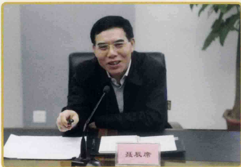
◀ 2013年10月16日，国家新闻出版广电总局党组副书记、副局长聂辰席就弘扬中国梦主题、继承优秀传统文化、办好原创节目在河南调研