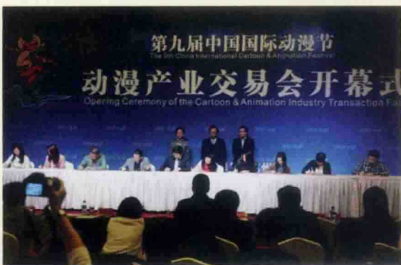
▲ 中国国际动漫节产业交易会现场