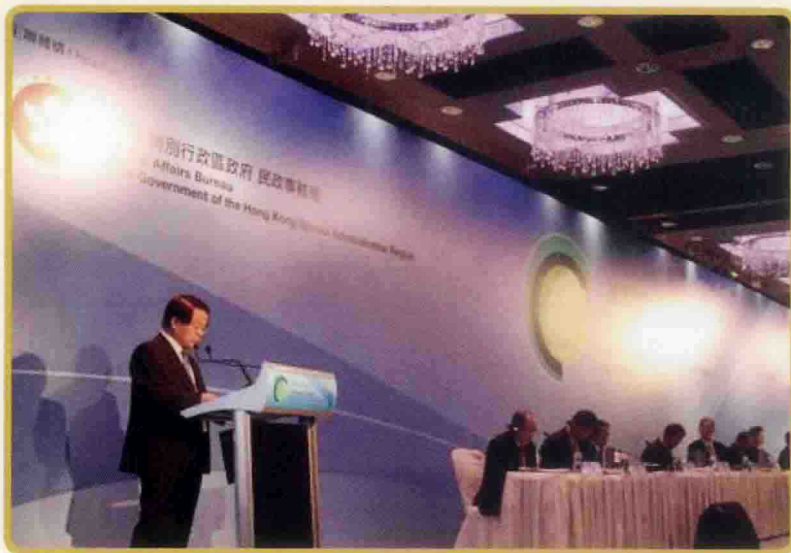
◀ 2013年11月14日，文化部部长蔡武出席2013亚洲文化合作论坛并发表演讲

2013年1月11日，国家新闻出版总署署长柳斌杰做客电视访谈节目，访谈以“文化强国 阅读为本”为主题展开，吸引了大批观众 ▶