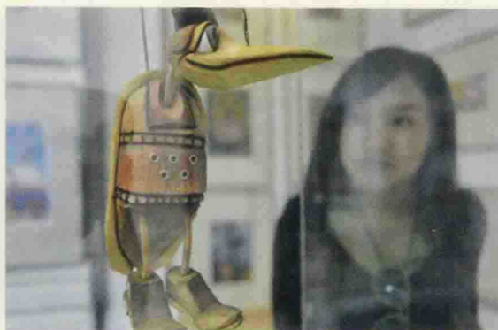
▲ 观众在中国国际动漫节上欣赏捷克动漫人偶鹤鹑