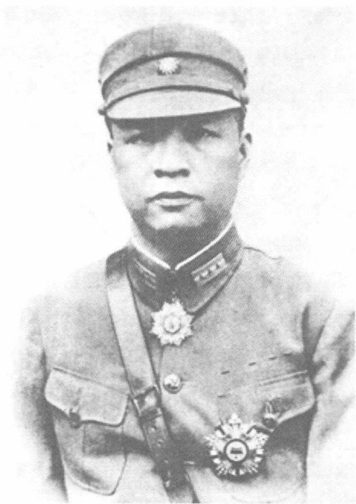
■ 余汉谋因1938年10月轻易丢失广州而饱受争议。

1936年5月，陈济棠利欲熏心，拉起“反蒋抗日”大旗，背地里却取得日本军方所谓的“谅解”，准备放手一搏挑战蒋介石的“九五至尊”。广东将领大都态度消极，但一时又无人愿意带头反对。只有余汉谋从军事角度谨慎提出：“我们没有必胜的把握，请总司令详加考虑。”陈济棠家长制作风大发，责令余即日起搬到总部后面房间好好反省。6月，陈济棠宣布成立抗日救国西南联军，李洁之、黄涛等一批广东将领秘密推举余汉谋倒陈。7月，余汉谋以接到部队屡次电请回防和准备抗日反蒋的军事行动为由，摆脱陈济棠控制，由广州回到大庾。随即飞赴南京参加国民党五届二中全会，接受第4路军总司令兼广东绥靖主任的任命，主张广东还政中央。李洁之、黄涛等人紧跟其后，纷纷通电倒陈。随着广东空军全部北上投效南京，陈济棠只好黯然下野，余汉谋成为接管广东军政大权的要员。据李洁之回忆，当日余汉谋返回大庾，手下众将请其立下决心反陈，余哭哭啼啼，犹豫不决。后来