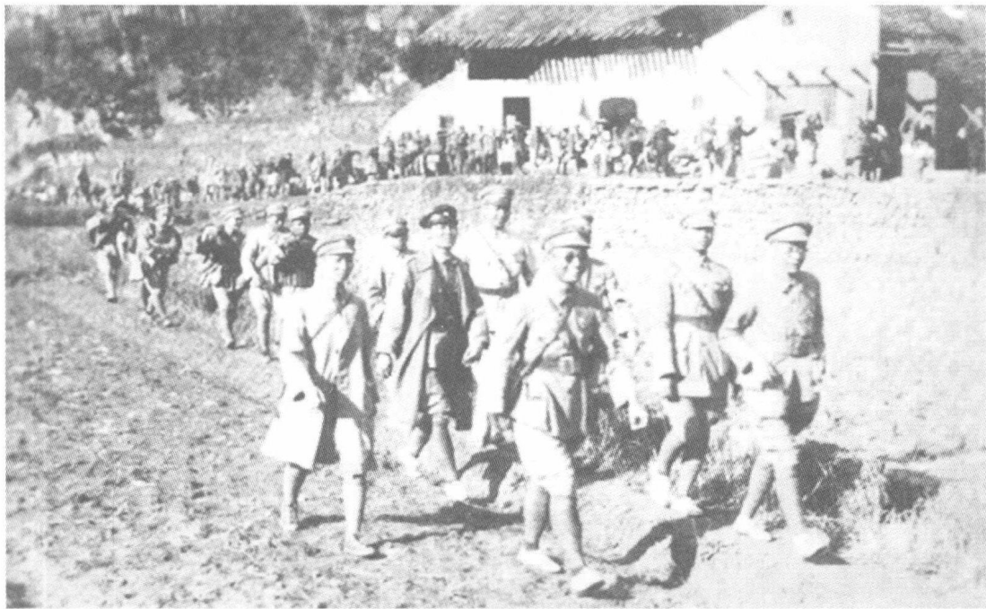
■张发奎、李汉魂、薛岳北伐合影。

张发奎犹豫不前，蒋介石约他谈了几次，最后答应调第4军时期的骨干李汉魂同去广东接替吴铁城任省主席，张始点头应允。李汉魂将军1938年率领第64军北上豫东，遭遇从鲁西渡黄河南下的日军土肥原师团，这支广东子弟兵不惧强敌，一举夺回陇海路重要据点罗王寨，有力掩护了第五战区部分主力从徐州西撤。随后又参加保卫大武