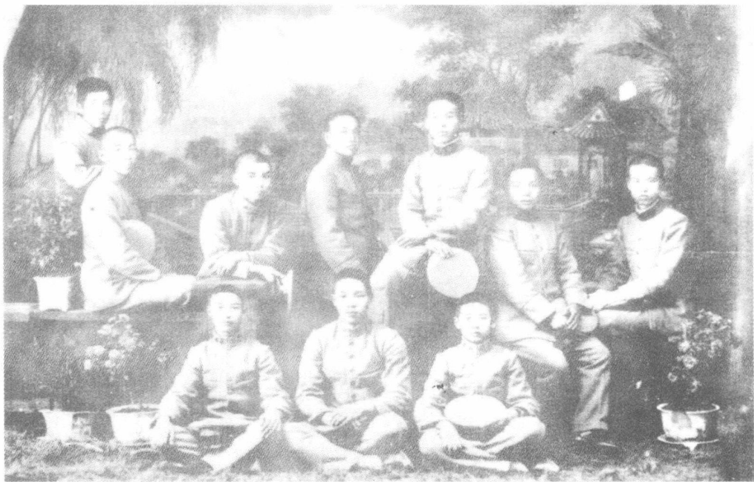
■ 就读于黄埔陆军小学张发奎（前排右一）与部分同学合影。

1926年7月，广州国民政府兴师北伐，张发奎率领第12师进军湖南，连克醴陵、浏阳、长沙、平江等地。8月下旬，第4军向北挺进，吴佩孚集结重兵扼守汀泗桥，第12师配合左翼友军发起猛烈攻势。张发奎亲率第35团和以共产党员为主的叶挺独立团展开正面攻击，黄琪翔第36团乘夜渡江迂回敌后，一举占领汀泗桥。第4军随即又再克贺胜桥，会同第7军等合围武昌，终于在10月10日破城而入，取得了一场北伐战争中具有决定意义的胜利。10月末，张发奎挥师援赣，奋战德安马回岭，重创孙传芳五省联军谢鸿勋部，不久又随左路军克复九江、南昌等地。蒋介石电嘉张发奎：“此次兄千里增援，不辞辛劳，殊胜爱慕！有将如兄，革命无虞不成矣。”11月下旬，第4军班师武