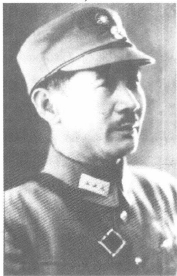
■1939年10月张发奎升任第四战区司令长官。