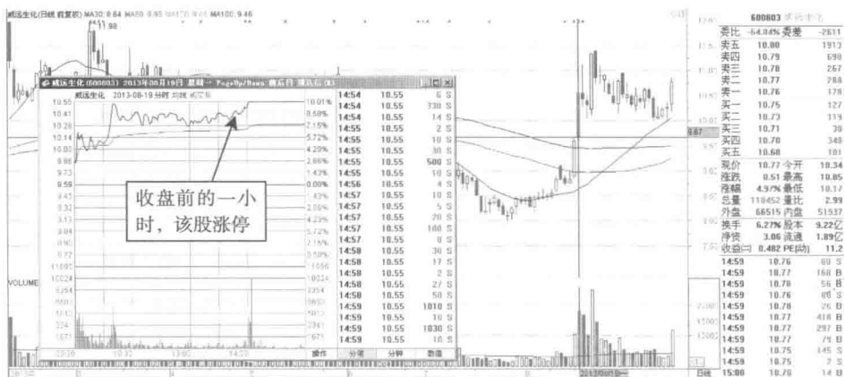
图 1-3 威远生化强势放量尾盘涨停

如图 1-3 所示，威远生化（000803）的分时图中显示，盘中该股强势放量上涨的过程中，终于在下午盘 14:03 那一刻涨停，收盘价格为 10.55 元。2013 年 8 月 19 日的涨停板，已经是前一个交易日大涨 8.61 后再次冲高。主力短线做多意图非常明显，该股放量上行的走势经历时间非常短。价格超涨的时候，买涨可获得不错回报。