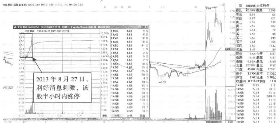
图 1-4 大江股份政策利好推动大江股份涨停

图 1-4 为大江股份（600695）2013 年 8 月 27 日涨停走势图。当天该股开盘上涨，并且在不足半小时的时间里进入涨停板价格。当日该股开盘价格为 4.22 元，下跌 0.94%，短短半小时进入 4.69 元的涨停价格，创一年多以来新高。从总体涨幅看，8 月 26 日、27 日及 28 日期间，其累计涨幅达 28%。