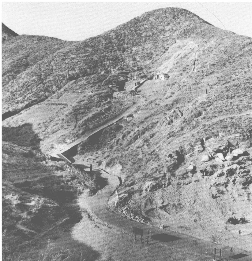
大同煤峪口南沟万人坑所在的山坡