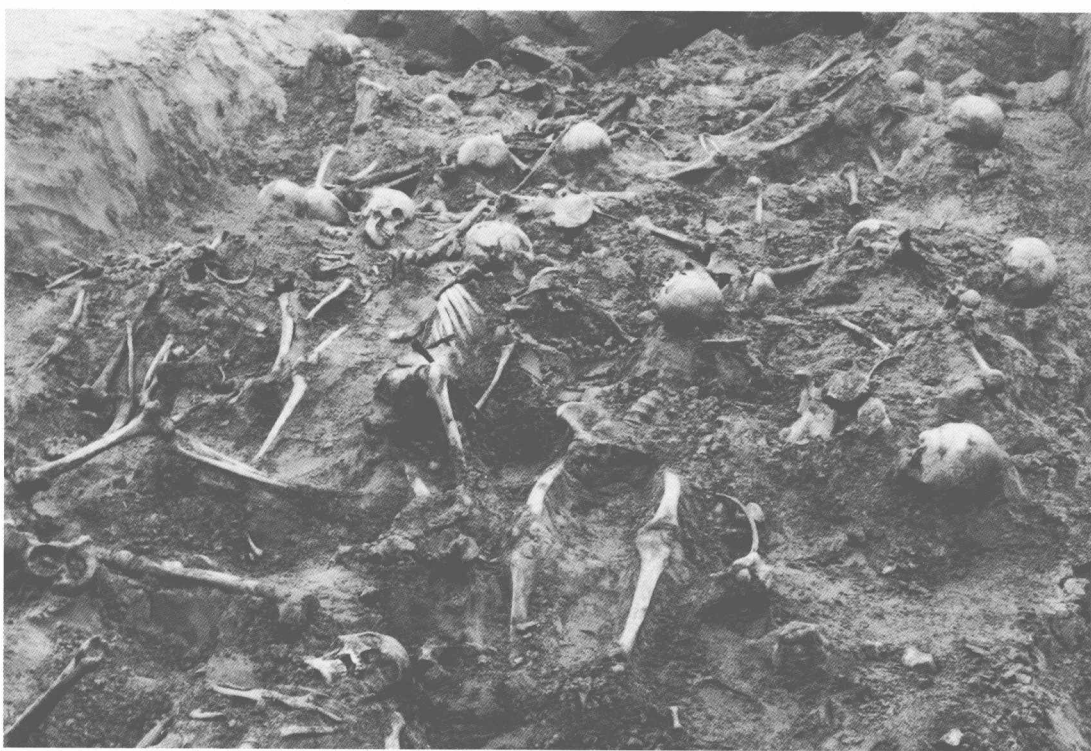
山西大同忻州矿杨树湾万人坑内层层叠叠的矿工尸骨