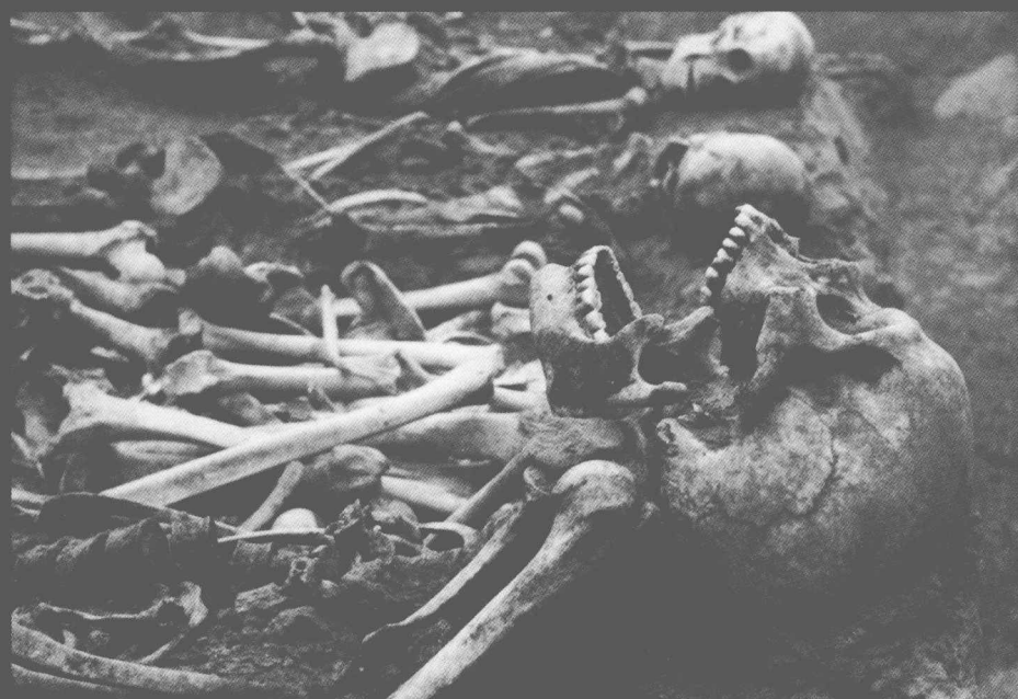
山西大同忻州杨树湾万人坑的“排埋坑”