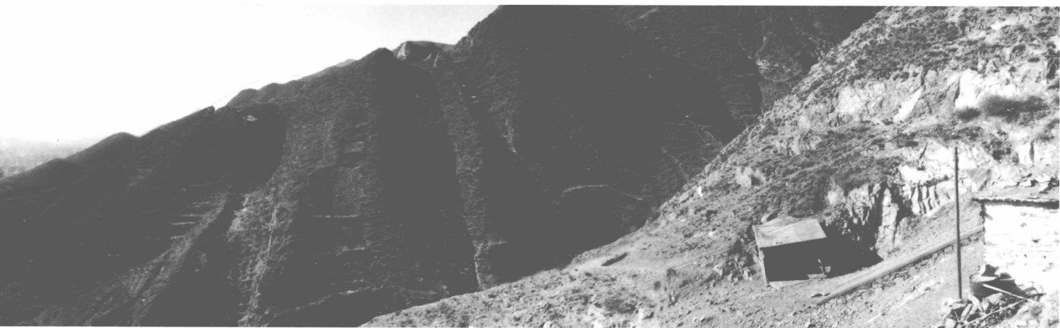
山西大同煤峪口南沟万人坑（干尸山洞所在）的全景（由西向东拍摄）

很久以前，当地就有万人坑，还有一批“干死人”的传说，因洞口早年封闭，一直没有下落，无法证实。