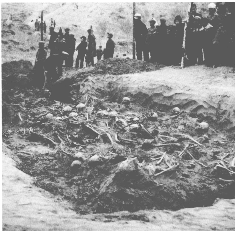
1967年5月4日，中国科学院考古所、大同煤矿工作队试掘了杨树湾山谷平地当年叫做“死人沟”的万人坑。任选一地，在20×20米的探方中，即发现横七竖八抛进之矿工尸体有数百人之多，深度不到1米，最稠密处尸体叠压有五六层，此为大同最大的一处露天万人坑。据说1938—1945年，这六七年间，这里为日本侵略者残酷虐死的中国矿工达三万人左右，野狗成群，大雨后人头如浮瓜，山野腥臭，路人断绝。

日本鬼子把抓来的中国青壮年的血汗榨取净尽，也只是几个月时间，然后千百条生命就抛进了万人坑。接着又运进一批新骗来、抓来的，变本加厉地压榨。为了出煤，人死得更快更多！仅杨树湾一地，1939—1944年前后，万人坑就吞没了三万