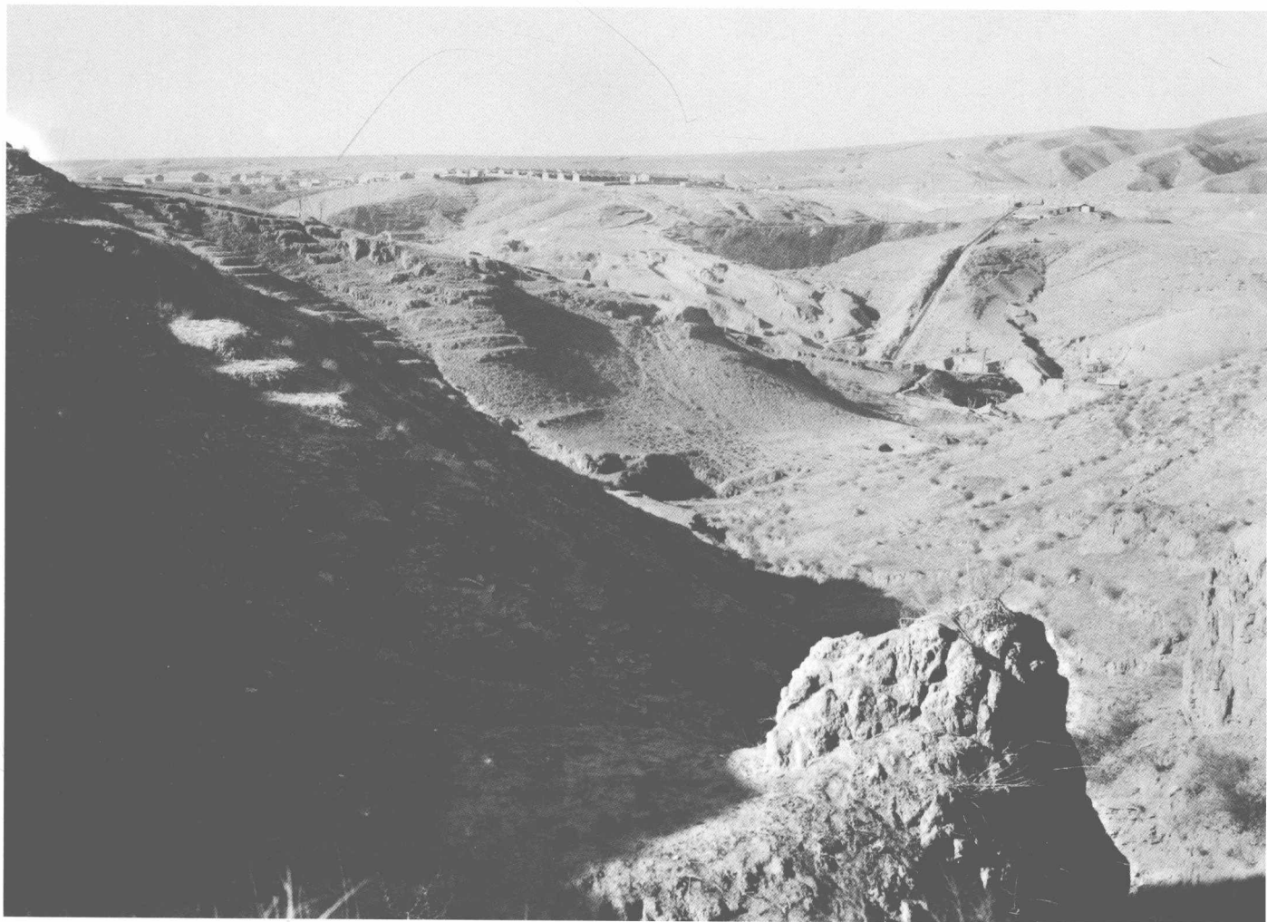
忻州矿杨树湾“烧人场”

跑。矿工晚上同住一所大房子、两铺大炕，臭虫咬人了不得。一天十四五个小时的活儿，排队下井、上井，都有矿警押着，四周都是铁丝网、岗楼，还有狼狗，南山还有大探照灯转着照，工人往哪里跑？发现了就开枪。要是抓回来，夏天常常将逃工全身涂上柏油（沥青），吊起来活活晒死；冬天就浇冷水冻死。日本人的残暴施威，无非为了阻吓矿工的反抗和逃跑。矿工的生活完全失去了做人的资格，沦为皮鞭下的奴隶，与德寇的集中营一模一样。日本的政策是“以人换煤”，在其占领的城市、乡村，利用汉奸走狗诱骗（招募），甚至围堵拦截强抓青壮年为“劳工”，以加紧掠夺中国的矿产、煤炭资源。就我童年（1938—1943）在济南读书时所见，整火车皮、整列车地向东北运送劳工。