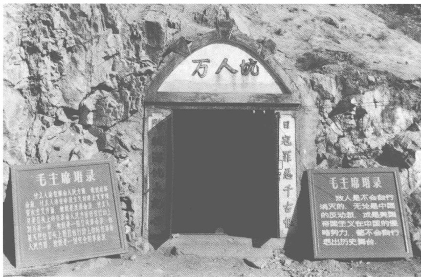
经过修葺后万人坑A洞的入口（1966年12月前）

里死人骨架还堆积如山，试掘证实了日本侵略战争所造成的巨大的万人坑的暴行！听过了老矿工们的故事，也了解了万人坑的一些情况和背景，我们考虑工作的重点，首要的是发掘、清理、保护一矿区内的两个山洞中的矿工干尸。