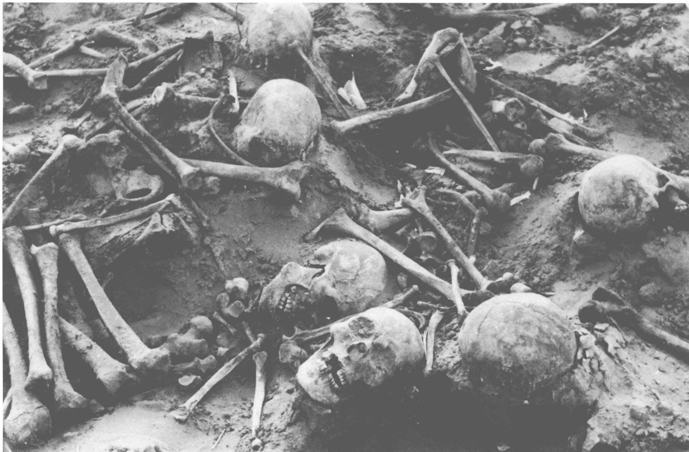
山西大同忻州矿杨树湾万人坑内层层叠叠的矿工尸骨