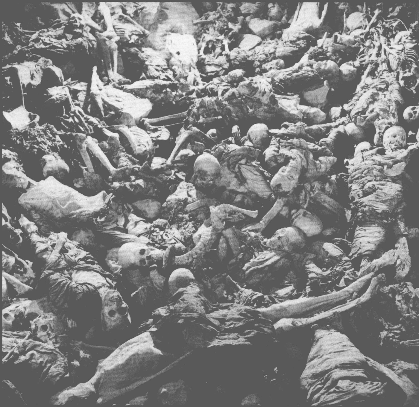
万人坑A洞内尸骨累累，其惨状令人恻栗