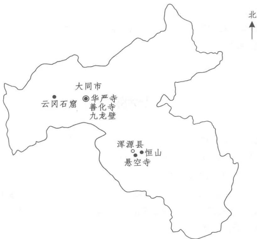
大同市主要景点分布示意图