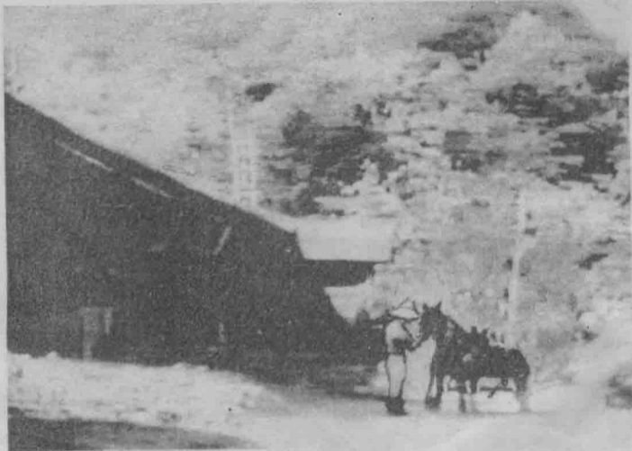
1 农民时田老人，正在整理马车，他要去拉稻草，贮藏起来以备过冬。