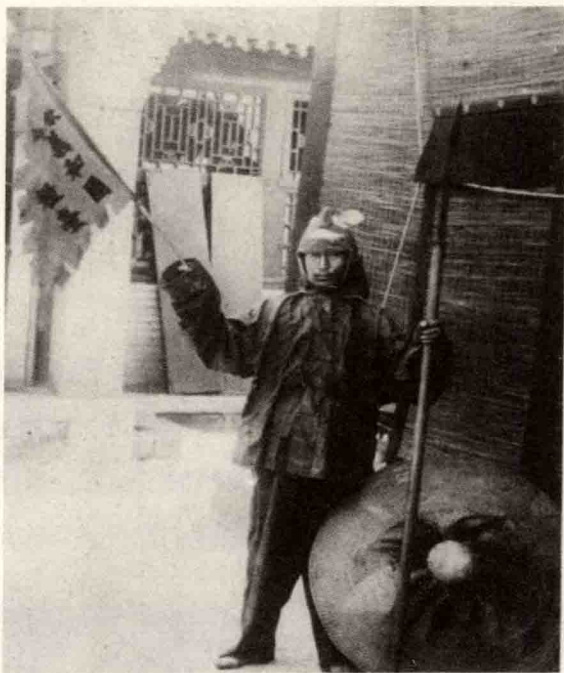
一个义和团拳民，他手中的旗子上写着“钦命义和团粮台”

1900的3月份，义和团运动如雨后春笋般活跃起来，他们在山东和吉林两地抗杀洋人的消息震惊了全世界。其实，义和团这一名字本身起得很失败，因为按照中文的字面意思，“义和团”这三个字对应英语的翻译是“和谐的拳社”，又或者是山东省的“大刀会”，这些名字在那个相对守旧的社会里还是有点新意的。义和团最初只是一支革命团体，当时中国存在着许多支这样的革命团体，但清政府绝对不允许这样的革命力量存在。