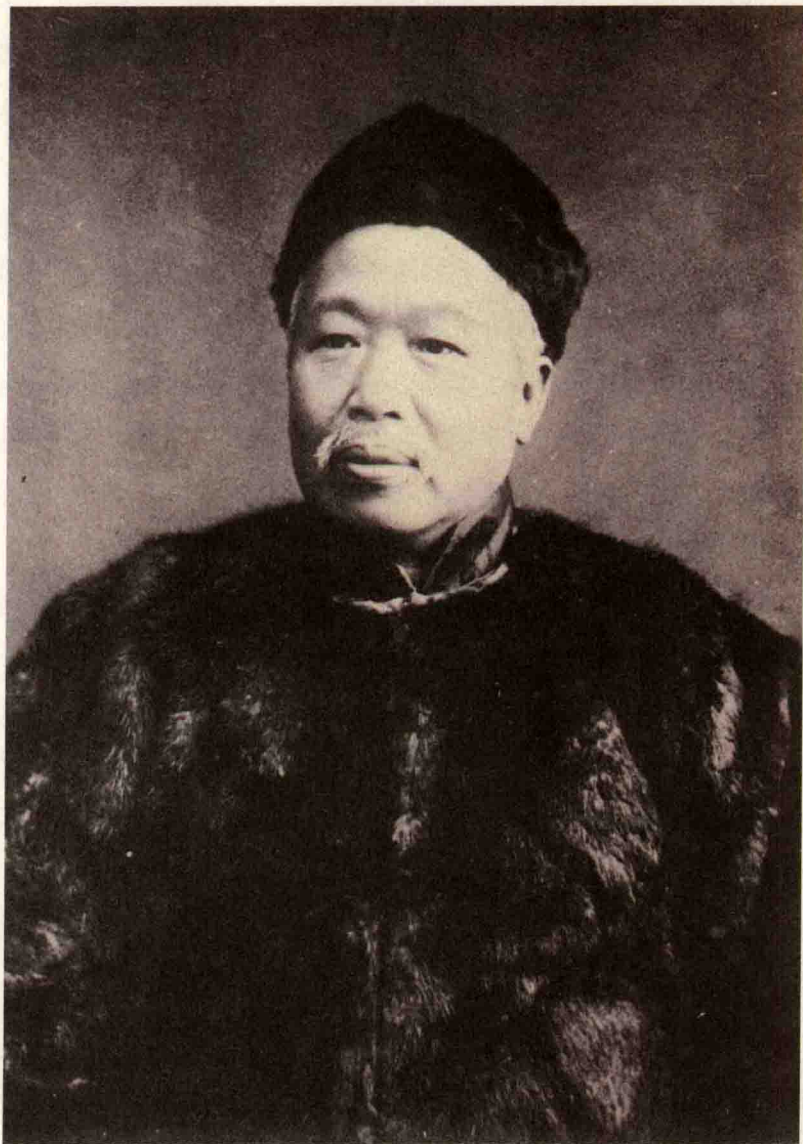
戊戌变法的领袖、影响中国近代史走向的重要人物——康有为