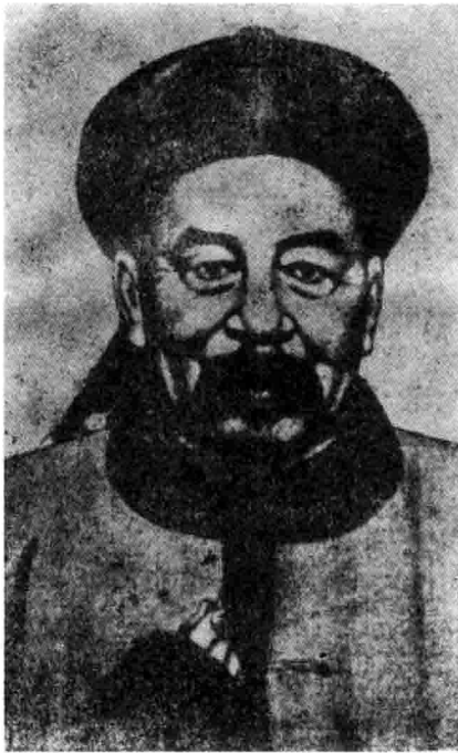
近代中国西北地区开拓者之一、 洋务运动重要人物左宗棠