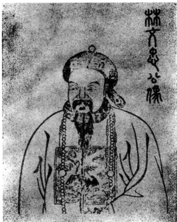
林则徐——近代中国第一个开眼看世界的人