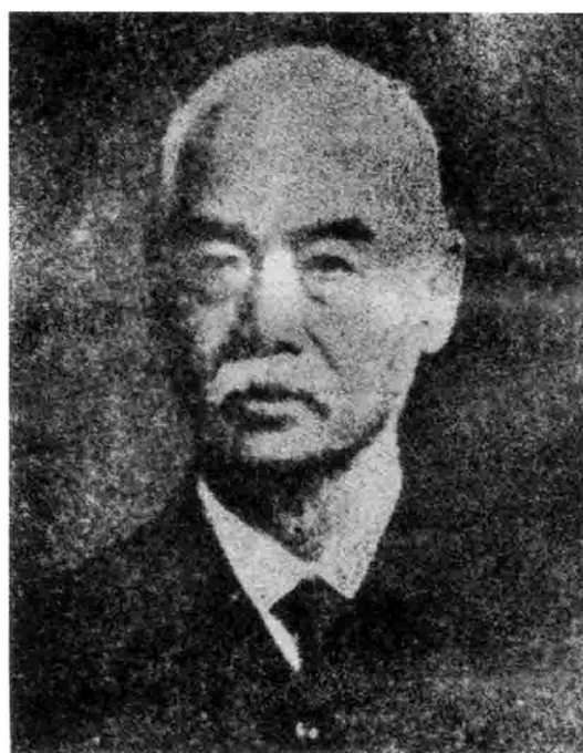
中国最早留美学生之一改良主义者容闳