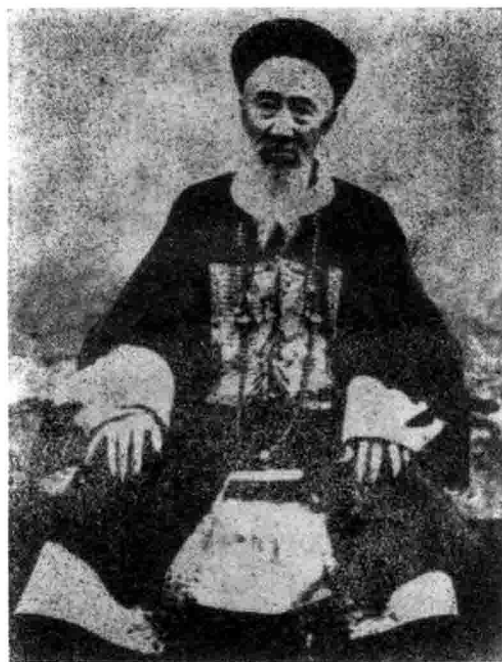
“中学为体、西学为用”论的倡导者、 洋务运动重要人物张之洞