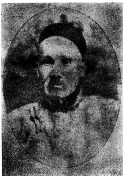
近代“商战”论的倡导者和实践家郑观应