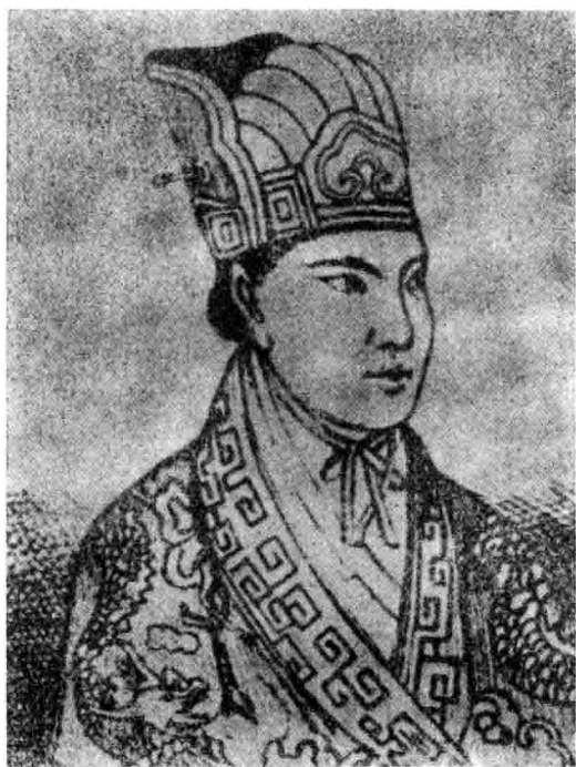
太平天国革命领袖洪秀全