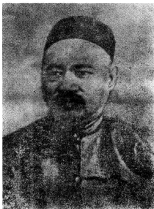
近代早期改良主义者薛福成