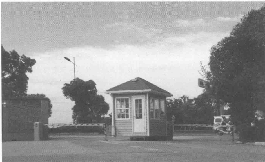
简朴的样板社区大门

在中国，逢年过节便是送礼收礼的高峰期。新春佳节，朋友之间的相互走访本来无可厚非，但总有一些人利用这样的机会请客送礼、打点关系，希望在与别人的竞争中走捷径、占先机。这种靠拉拢关系自己走捷径的做法，事实上破坏了社会的公平正义和社会管理的规范性。一旦制度被破坏，损害的不仅仅是个人的利益，而是社会的公平性和社会管理的严肃性，当然，最终走捷径者也会成为其他走捷径者的受害者。德胜管理体系的创始人聂圣哲先生，对中国传统文化有着透彻的理解，同时又有西方企业管理的经验，经过长期的研究和思考，他终于探索出一条中西合璧的管理路子，其中有一条就是：不走捷径。