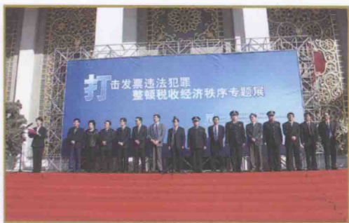
北京市国家税务局举办“打击发票违法犯罪,整顿税收经济秩序专题展”

门协调,提高稽查案件的结案率。三是加强案头分析,加大人工选案力度,提高稽查选案的准确率,探讨计算机选案的可行性,为稽查组收奠定良好的基础。四是针对性地开展日常稽查、专项稽查和专案稽查,加大税务稽查查处力度,严厉打击涉税违法行为。五是规范税收执法行为,提高案件查办质量。六是强化税务稽查案例分析和应用工作。稽查组收工作在狠抓专项检查工作的同时,以企业自查为切入点,将自查辅导与稽查检查相结合,取得了良好效果。截止2009年10月中旬,全市稽查组织收入60.5亿元,