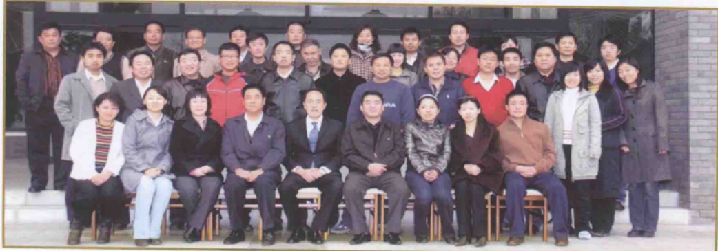
第一稽查局深入开展学习实践科学发展观活动