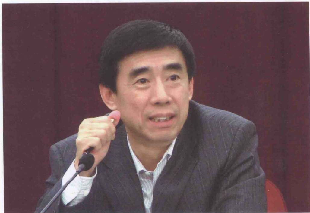
国家税务总局稽查局马毅民局长在部署工作。