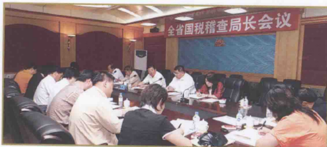
全省国税稽查局长会议会场