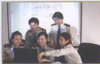
● 青年电子查账小组