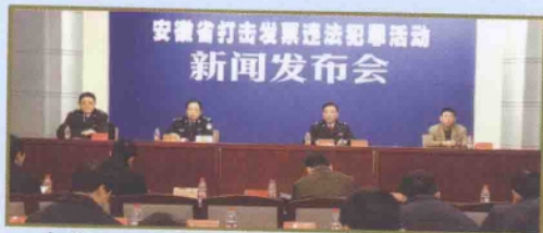
安徽国税稽查局召开打击发票犯罪新闻发布会

一是不断加大税收大要案查处力度。各地在稽查工作中,始终把查处大要案放在突出地位,在人力、物力、财力上保证办案需要。合肥市、巢湖市税警联合行动,查办了合肥瑞丰影视器材有限责任