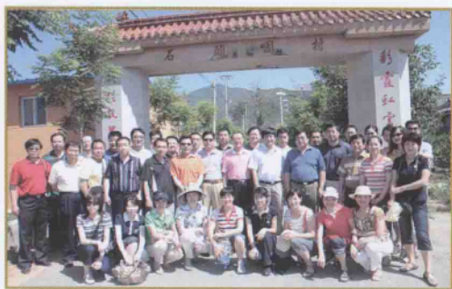
北京市国家税务局稽查局全体党员干部在党日活动中共合影留念