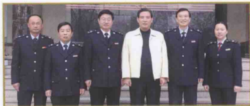
精诚团结、锐意进取的领导班子

内练素质，外树形象，不断夯实税务稽查队伍建设基础。 在稽查队伍建设中，对内，注重加强稽查队伍政治素养的锤炼、业务技能的培训和廉政意识的培养，为各项工作卓有成效地开展打下了坚实基础。对外，大力推行文明执法，寓服务于执法全