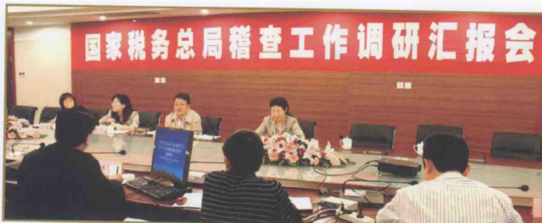
刘建国副局长赴安徽调研、指导工作

2008年,安徽省各级国税稽查部门围绕“巩固基础、规范管理、不断创新、促进落实”的工作目标,转变思想观念,突出工作重点,强化系统管理,搞好协调配合,进一步推动了安徽国税稽查事业科学发展。全年共检查纳税人4395户,查补税收收入7.8亿元。查补税收收入比2007年增长35.7%,各项指标均达到总局规定要求。