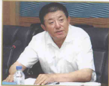
省局党组书记、局长孙云志在全省国税稽查局长会议上讲话

吉林省国家税务局稽查局在总局稽查局和省局党组的正确领导下,创新理念、求真务实、加强税警联合办案,创造性地开展税务稽查工作,为营造公平有序的纳税环境和建立良好的税收秩序做出了积极贡献。他们在“一级稽查”体制下,全面实施“重点稽查”,强化稽查选案准确率,加大稽查业务培训力度,提高查账技能,实施解剖性检查和查前辅导,集中优势稽查力量开展检查,重点突破案中案,加强稽查工作目标管理考核,取得了很好效果。2008年,全省各级国税稽查部门共检查纳税人4131户,有问题3706户,选案准确率89.64%;查补税款、