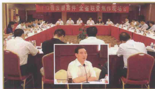
河南“1·12”假发票案全省联查会议

过程中。2008年在对某中央级企业进行检查中，检查人员文明执法、悉心辅导的工作作风受到企业赞誉。总局对此指出河南国税检查人员在对企业检查中展示了河南国税系统的精神风貌，值得称赞，为对中央级企业进行税务检查提供了宝贵经验。