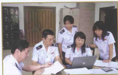
稽查干部查阅案卷

天津市地方税务局第二稽查局以开展税收专项检查和区域税收专项整治工作为主要手段,以查处重大涉税违法案件为工作重点,不断整顿和规范税收经济秩序。几年来,按照总局和市局的工作部署,先后重点开展了对房地产、建筑安装、交通运输、