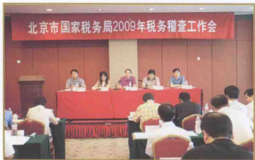
北京市国家税务局召开2009年税务稽查工作会

高素质和专业化的稽查队伍是提高稽查案件查办质量的根本,为此,北京国税稽查局高度注重稽查人员培训,2009年结合全国税务系统稽查人员业务考试组织专门培训,切实提高了我市稽查人员考试通过率。今后,我局将继续实施“精兵稽查”战略,不断加大学习教育和培训投入力度,使北京国税的稽查干部队伍逐渐成长为一支公开执法、规范操作、令行禁止、严守秘密、业务精湛,能打硬仗的专业化队伍。