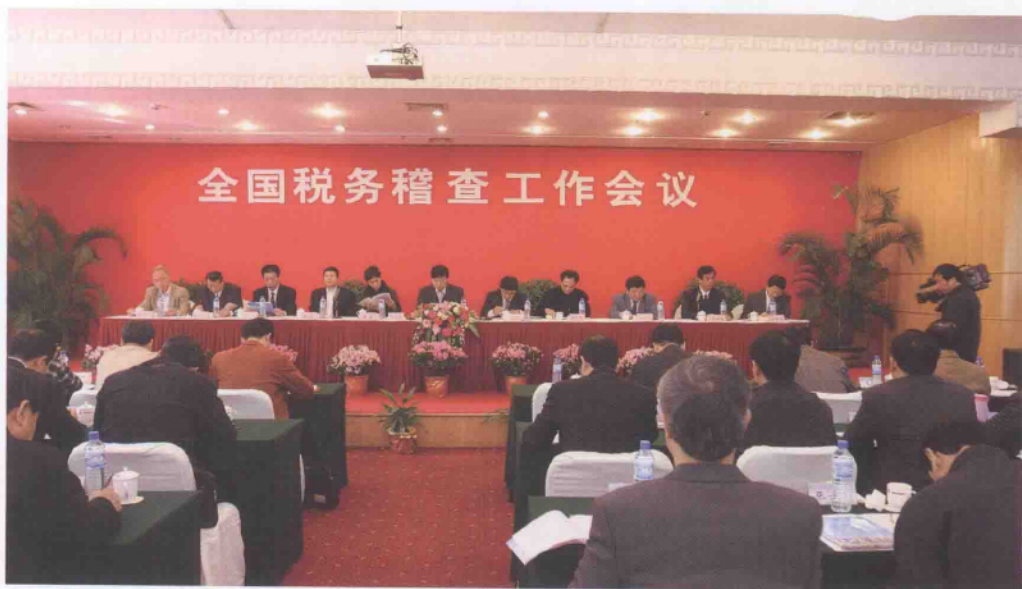
全国税务稽查工作会议会场。

2008年1月22日至23日，全国税务稽查工作会议在福建省厦门市召开。国家税务总局党组成员、副局长解学智在会上作了题为《发挥税务稽查职能作用 推进我国税收事业又好又快发展》的报告。报告总结了2007年全国税务稽查工作，分析了现阶段税务稽查工作形势，部署了2008年税务稽查工作主要任务。