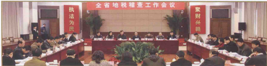
召开全省地税稽查会议

提升效能，创建最优发展环境。 按照省委、省政府关于开展机关效能年活动的部署和要求，实行阳光稽查，规范税收执法行为，提高工作效率。深化服务内容，实行查前告知、查中上门走访送政策、查后跟踪反馈提建议。开门纳谏，虚心听取纳税人的意见和建议，进一步加强与纳税人的沟通联系，营造良好发展环境。