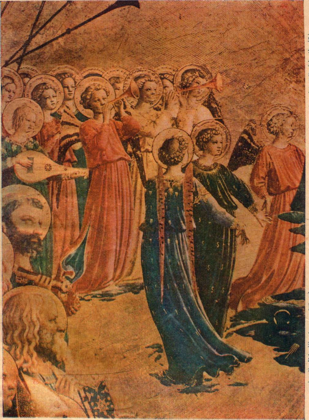
By Fra Angelico (1387-1455)