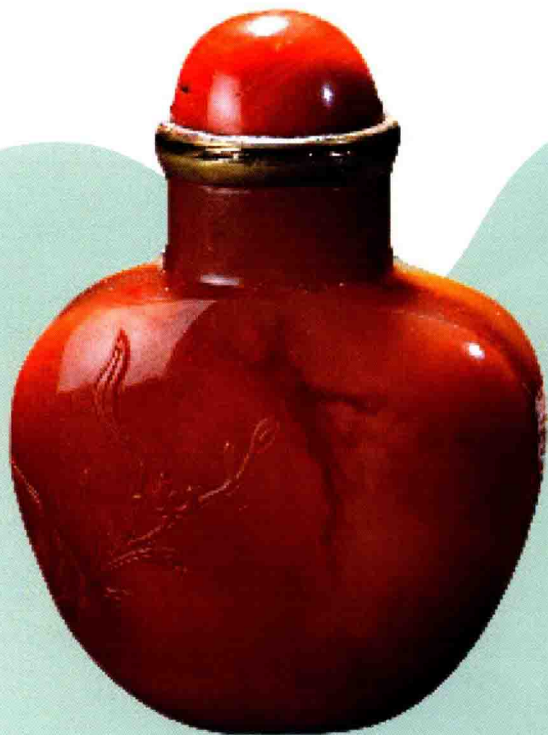
南红玛瑙雕玉兰花鼻烟壶

另外，对于女性，长期佩戴玛瑙可以使心情开朗、皮肤润滑，还能让嘴唇变得更加红润，眼珠明亮有神。