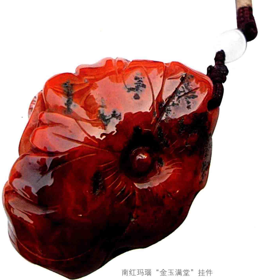
南红玛瑙“金玉满堂”挂件

(3) 黑玛瑙可使人客观超然，远小人近贵人，不至于在复杂的环境中迷失方向。增加人的自信心，避免恐惧不安，可防止咒语、巫术等负面能量侵犯。可消除浊气、霉气、病气，带给人健康。黄金或者白金镶黑玛瑙饰品，粗犷中体味细腻，品位中展现个性，纯正的白金材质同黑玛瑙的颜色对比，将贵金属的质感表露无遗，全力引发有关珠宝的魅力狂想。黑玛瑙象征坚毅，传说运用黑玛瑙的能量，可消除气场上的杂质，继而有效启发其自身的魅力，佩戴黑玛瑙的人未必拥有过人的智慧与美貌，未必拥有天然的好人缘与亲和力，但其性格中与生俱来的“棱角”却是一种足以致命的诱惑。黑色具有庄重、高贵、经典、稳定、时尚、魅力、神秘特质，代表的是含蓄、内敛与低调的品性。黑色也是一种强烈的声音，凝聚着强大的力量，让任何人都无法抗拒。黑玛瑙具有强大的投射能量，其黑色的作用除了可以吸附负能量外，也可因为其光滑的界面而将负能量反射回去。