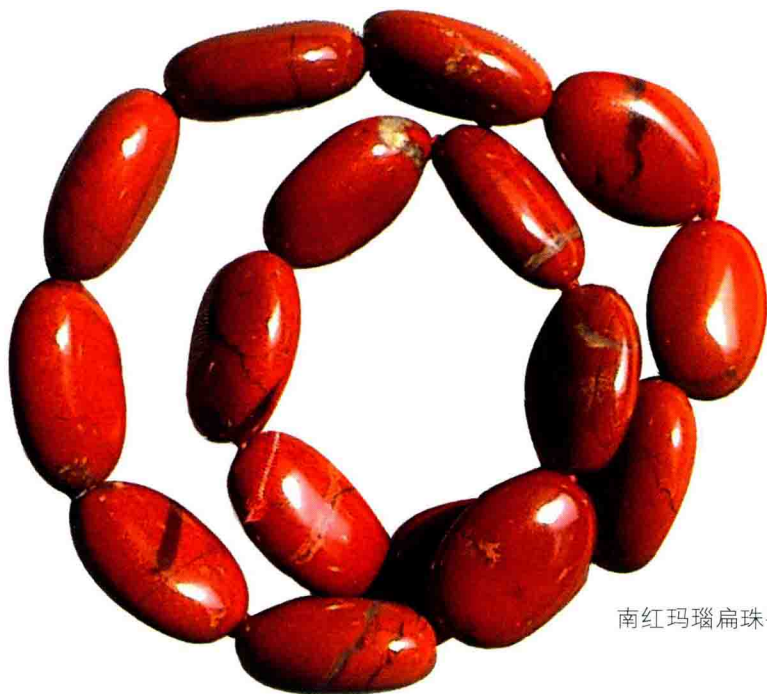
南红玛瑙扁珠手串

(3) 玛瑙可以为一些水晶饰品消磁，如戒指、耳环、手链、坠子等，但请用纸或布包住，以免被刮伤。