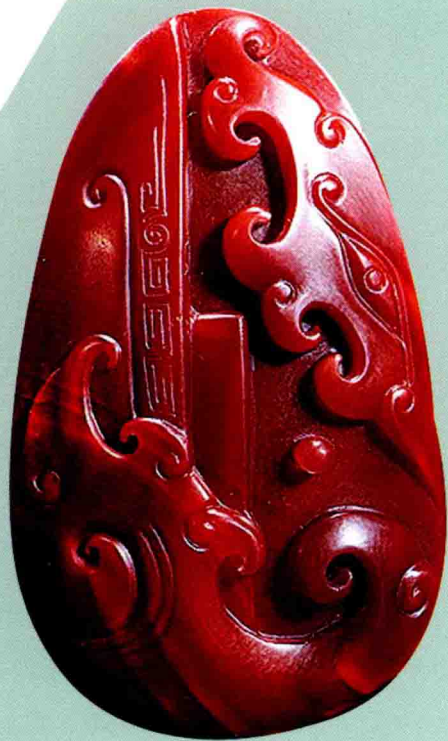
南红玛瑙仿古虎纹吊坠

(2) 红玛瑙可以消除精神紧张及压力，维持身体及心灵和谐，同时可以激发勇气、使人果敢、增强信心，适合体弱多病或刚痊愈的人佩戴。