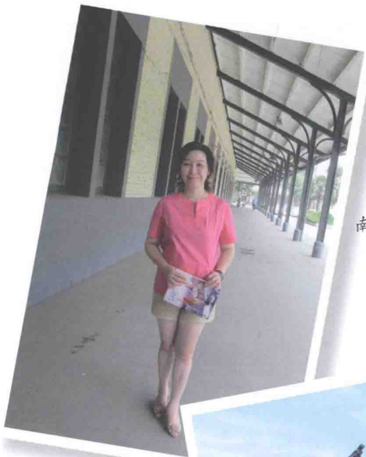
2013年6月20日 南京浦口老火车站