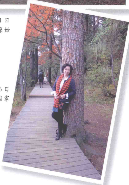
2013年10月15日 香格里拉普达措国家 公园