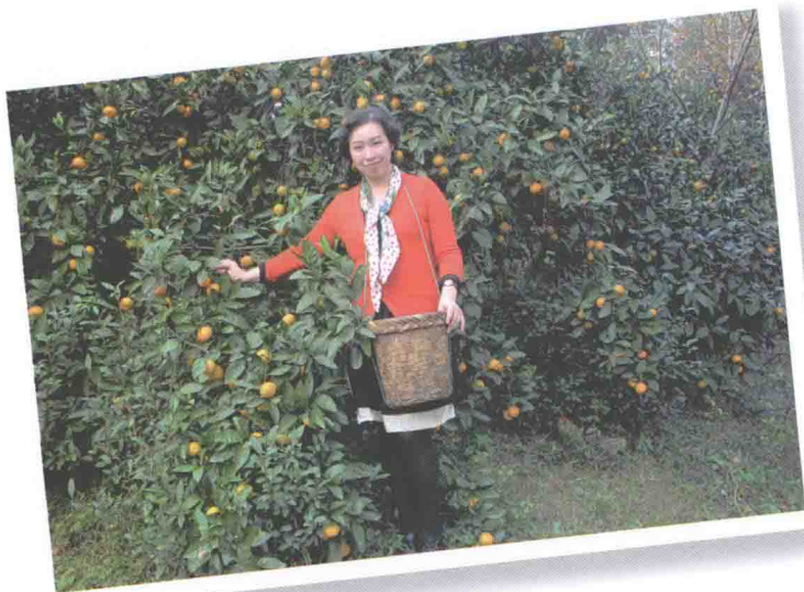
2013年11月21日 苏州西山采橘子