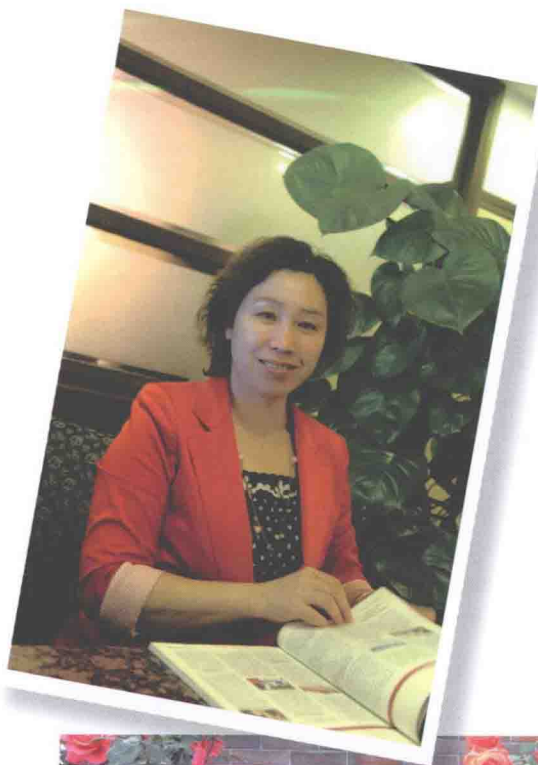
2013年4月3日 《现代苏州》杂志采访， 摄于苏州的咖啡馆