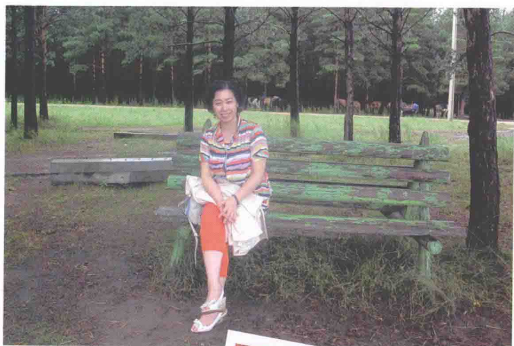
2013年8月11日 红花尔基樟子松原始 森林