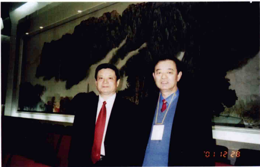
2001年12月28日与第二届国医大师王琦教授合影于人民大会堂 “康莱特杯”中医学术著作颁奖大会