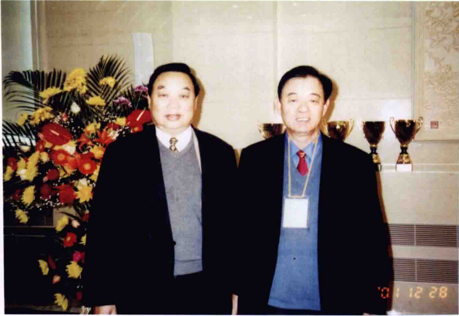
2001年12月28日与首届国医大师张学文教授合影于人民大会堂 “康莱特杯”中医学术著作颁奖大会