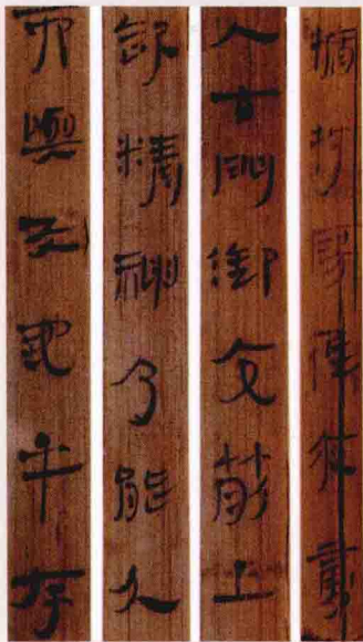
湖南长沙马王堆汉墓出土的竹简

1971—1972年，在湖南江陵拍马山第19号战国墓出土了3件竹制品，其中有一件是古代的盛酒器竹卮。竹卮的器下雕有三只兽蹄足，造型奇诡精美。