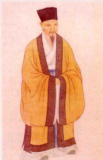
苏轼像（清·叶衍兰绘）。在以苏轼为代表的中国传统文人身上，非常鲜明地呈现了爱竹、咏竹的士大夫情怀。

关于竹雕的起源，金西厓先生（1890—1979）在《刻竹小言》一书中的论述可谓简明扼要、一语中的：“竹之始用，远在上古。操作之具，起居之器，争战之备，每取给于竹。六书盛行，削竹为简册，文字乃书于竹。礼记玉藻，士大夫饰竹以为笏，是用竹于典仪，且