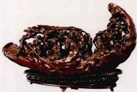
竹根雕八仙过海图

自北宋起，中国文人画的崛起，“岁寒三友”“四君子”的风靡，竹子已经成为君子风范的象征，因此，爱竹、种竹、画竹之风盛行。此后又逐渐出现了文人刻竹的时