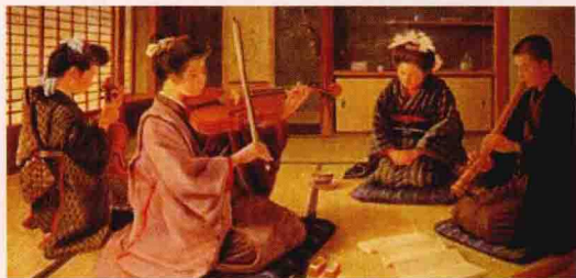
小提琴与尺八合奏的场景

20世纪70年代，湖北江陵拍马山19号战国墓出土的一件“三兽足竹卮”，是我国迄今发现的最早的竹刻品实物。长沙马王堆1号墓出土的雕龙纹髹彩漆竹勺，则是一件精美的汉代竹雕。这件竹雕，兼备浮雕、透雕两种技法。《长沙马王堆一号汉墓·上集》对此描述甚详：“……竹胎。斗以竹节为底，成筒形，柄为长竹条制成，接榫处用竹钉与筒相连接。……柄的花纹分三段。近斗一段为条形透雕，上为浮雕编辫纹，髹红漆。中部的一段为条形透雕，上有浮雕编辫纹三个。柄端一段为红漆地，上面浮雕龙纹，龙身绘黑漆，鳞爪描红，作奔腾状。”向来为人所称道的日本正仓院中藏有一件唐代的“人物花鸟纹尺八”，器表留青筠作阳文，雕有仕女、树木、花卉、鸟蝶等纹饰，纯为唐风，古色斑斓。以上三器，皆可作为中华竹刻源远流长的证明。