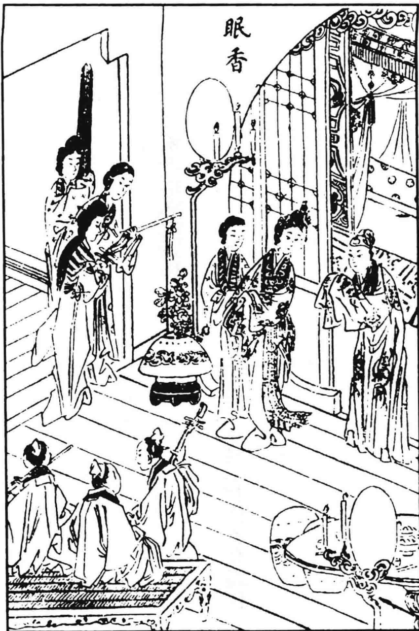
眠香（据清刻本《桃花扇》）