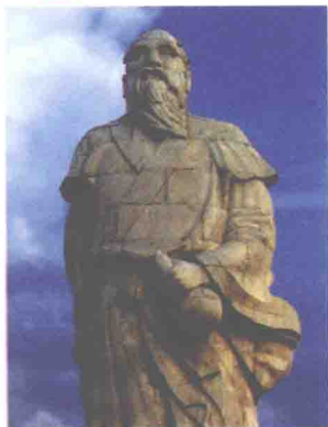
四川省彭州市彭祖塑像

彭祖, 也称钱铿、钱铿、彭铿。是上古帝王颛顼的四世孙, 父亲是吴回的长子陆终, 母亲是鬼方首领之妹女媧, 因擅长烹饪野鸡汤, 受帝尧的赏识, 后受封于大彭, 是彭姓的祖先。相传他靠自己的养生之道, 活了880岁, 这是以当时66天为一年纪年的方法所指的年纪, 按现在365天作为一年纪, 实际寿命为130岁。