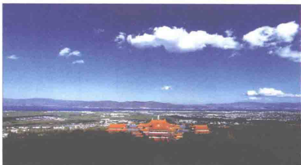
云南省大理白族自治州

云南省大理白族自治州，东邻楚雄州，南靠思茅、临沧地区，西与保山地区、怒江州相连，北接丽江地区。自治州首府驻大理市下关，距昆明市338公里。自治州国土总面积29459平方公里。大理地区是云南最早的文化发祥地之一，据考古发掘，新石器时代遗址广泛分布在以洱海为中心的高原湖泊群周围。