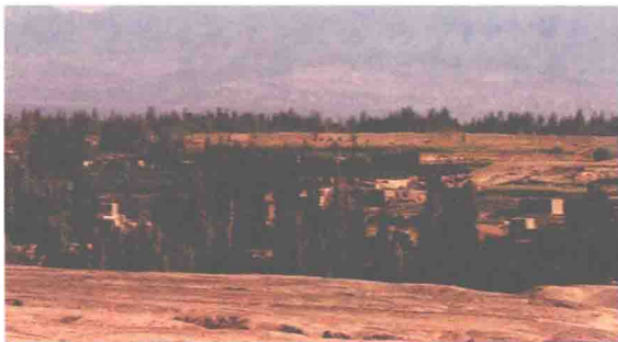
新疆维吾尔自治区吐鲁番

平均海拔73米的新疆吐鲁番，被称为中国第一洼地。这片被天山戈壁和大漠环抱的绿洲，有着丰富的光热条件和独特的气候，是著名的瓜果之乡。