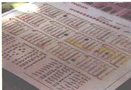
2012年公历农历伊斯兰教历对照表

伊斯兰教历为太阴历，每年比公历约少10日21时1分，积2.7回归年约少一个月，积32.6回归年相差一年，就是说，当公历32年时，伊斯兰教历已满32年。因此，伊斯兰教历各月在每年所处的季节并不是固定的，大约每经过32年6月就循环一个周期。这正是穆斯林的斋月、开斋节、古尔邦节等有时在冬季，有时在秋季，有时在夏季，有时在春季的原因。它的计算方法是：一年12个月，奇数月份为30天，偶数月份为29天；平年354天，闰年355天，不置闰月；每30年为一周期。由于太阴年比太阳年少11天，故公历每32年在伊斯兰教历应有33年。