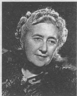
阿加莎·克里斯蒂 Agatha Christie (1890—1976)