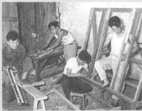
1958年，排字车间工人利用业余时间修理字架。