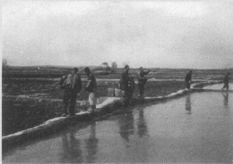
下放六合县竹镇乡白羊社干部在田间撒种。1958年4月18日摄于白羊社。 常海当时配诗曰：“江南无限好，水田陌连阡。今日撒一把，秋天收三石。”