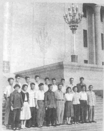
1960年6月，在北京召开的全国教育和文化、卫生、体育、新闻方面社会主义建设先进单位和先进工作者代表大会上。