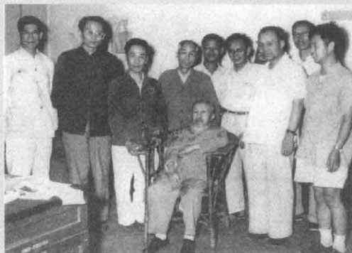
1962年6月4日，中国民主同盟主席沈钧儒（前排坐者）与光明日报社工作人员合影。后排左起：高天、王声严、陈此生、宋凉赞、谢公望、穆欣、孙捷、刘嘉启。