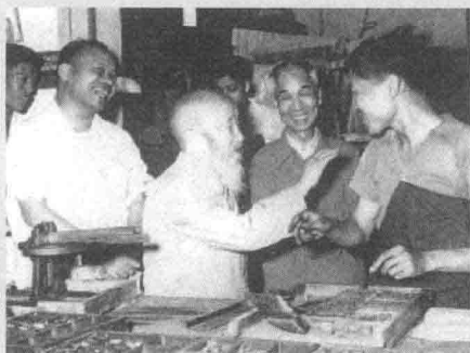
1962年6月4日，沈钧儒、陈此生参观光明日报社印刷厂排字车间，与职工亲切交谈。