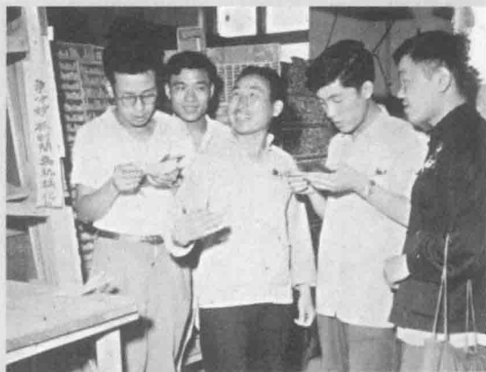
1960年6月13日，河北农民诗人来光明日报社排字车间参观，背后是扇型字架。