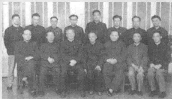
1964年，《光明日报》学术副刊《文化遗产》复刊，社领导与该刊社外编委合影。