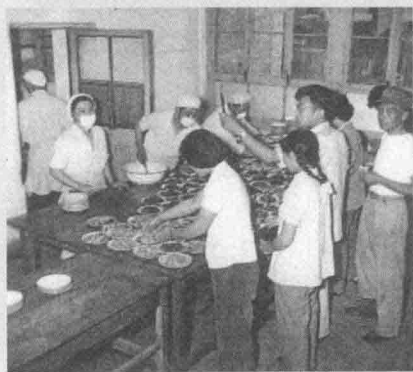
报社食堂 摄于1958年