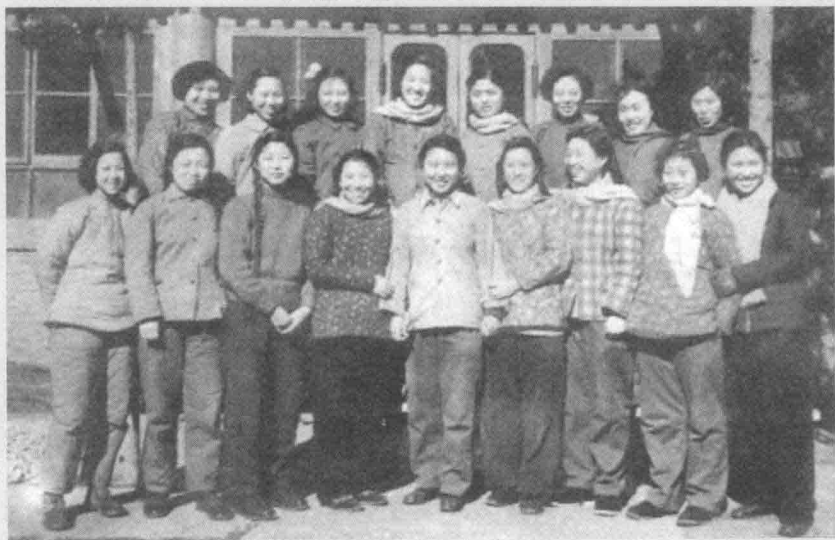
光明日报社印刷厂女工合影，摄于1960年。