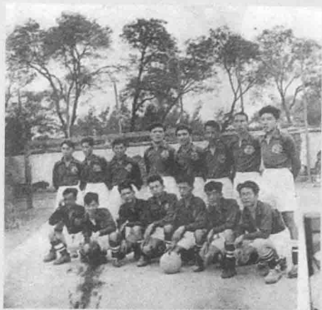
光明日报社足球队全体队员合影 摄于1956年8月27日