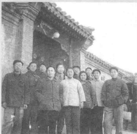
1958年11月，光明日报社第一批下放江苏省六合县干部返社时，部分下放干部在石驸马大街90号（报社旧址）大门前合影。