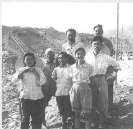
1958年，光明日报社职工在十三陵水库工地上。