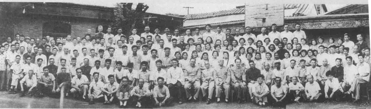
1959年6月16日，光明日报社创刊10周年，社领导与报社职工合影。