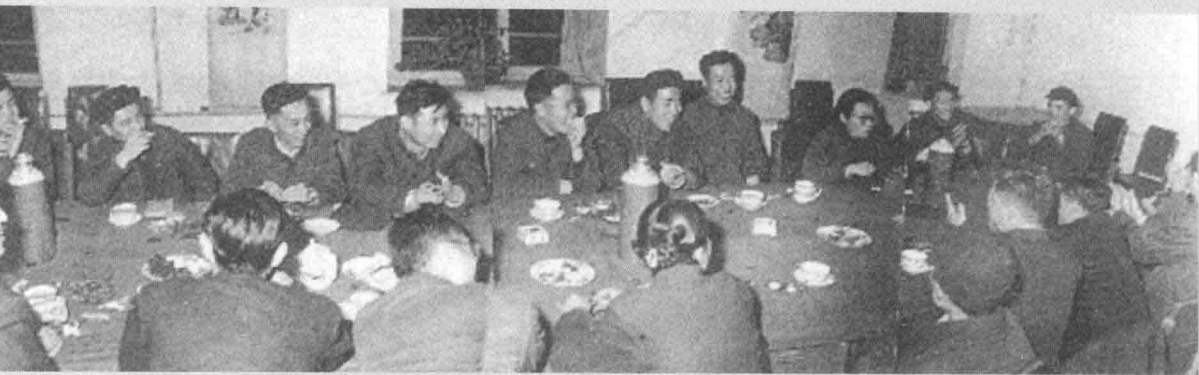
光明日报社于1962年2月开始组织驻省记者分批回社短期学习。这是通采部欢迎首批学习的记者。