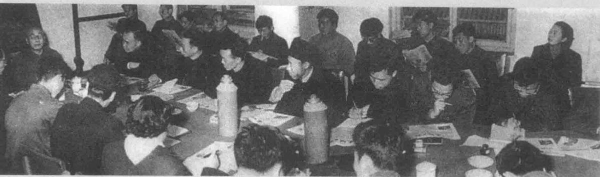
叶圣陶给光明日报社编采人员讲新闻与写作。