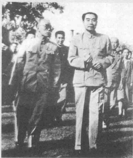
杨明轩（左）和周恩来在一起