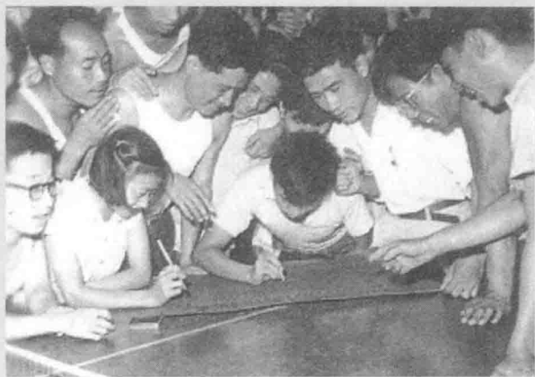
20世纪60年代，光明日报社职工踊跃报名参军。