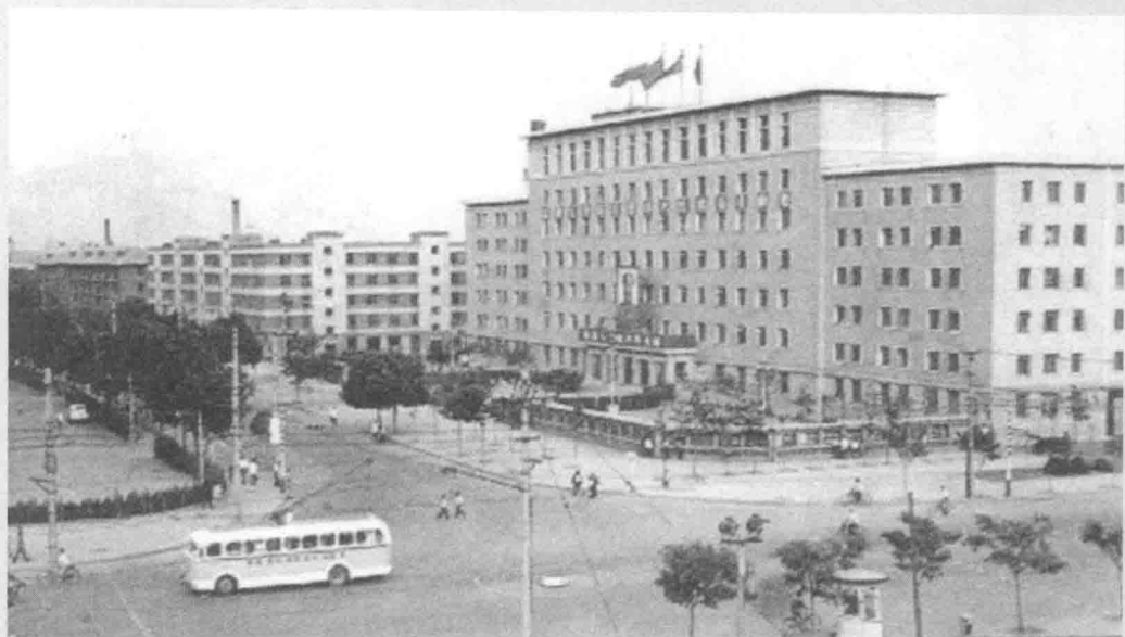
20世纪60年代光明日报社大楼外景