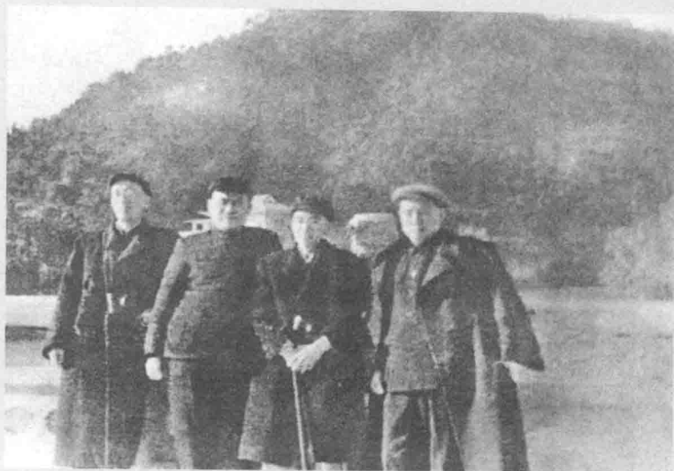
作者与常为《光明日报》撰稿的学术界人士在广州从化。右起：范长江、梁思成、穆欣、黄洛峰。