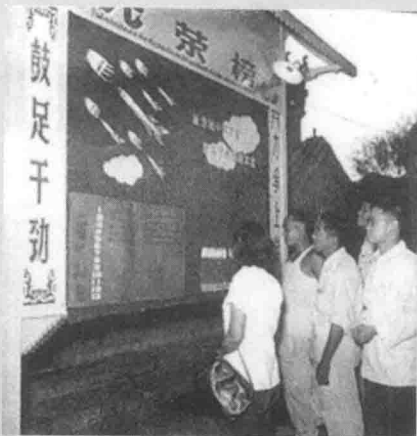
报社宣传栏 摄于1958年