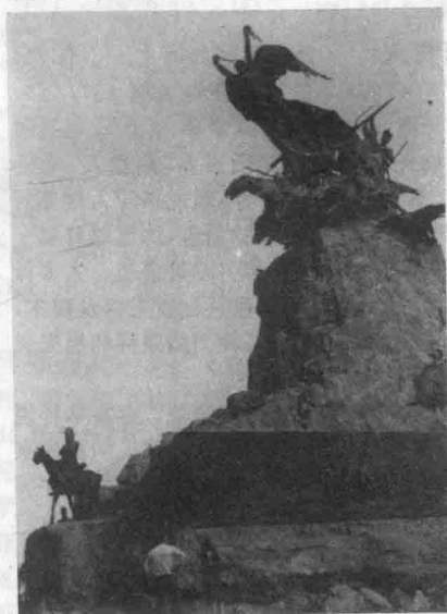
阿根廷安第斯山军纪念碑

阿根廷人 南美阿根廷居民的总称。主要由印第安人、西班牙人、意大利人长期结合而成。共2843万人(1982)。城市人口约占80%,五分之三以上的人口集中在东部潘帕斯地区。使用西班牙语。多信天主教。宪法规定正、副总统必须是天主教徒;同时保障信仰其他宗教的自由。约有5%的居民信犹太教。西部盛行摩门教。巴塔哥尼亚地区有些人信萨满教。印第安人保留着传统的原始宗教。