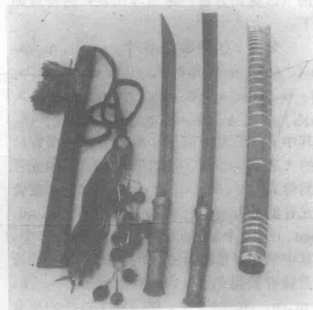
历史悠久的阿昌刀

中华人民共和国成立后的变化 中华人民共和国成立后,1952年梁河村成立民族民主联合政府;户腊撒成立了相当于区级的阿昌族自治区;潞西县高埂田、梁河县丙界和关璋成立了3个阿昌族自治乡。通过和平协商民主改革,废除了领主、地主一切特权剥削。土地改革的胜利,使阿昌族人民彻底摆脱了封建枷锁,从而推动生产的发展。在阿昌族地区地方工业逐步发展起来。如梁河县开办了铁工、农具、榨油、肥皂、松香、染布等小型工厂;户腊撒地区也建立了铁工厂。人民政府还帮助建立了卫生防疫站,培养了阿昌族的医生和保健人员,消灭了建国前猖獗的鼠疫和天花。文化教育事业也有了相应的发展,阿昌族有了受过高等教育的教师,学龄儿童都有了上学的机会。粉碎“四人帮”后,特别是中国共产党十一届三中全会以后,农业和手工业有了新的发展,如梁河地区培育出了优