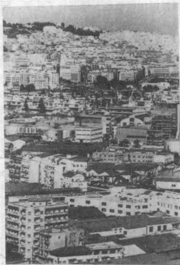
阿尔及尔港口景色

地。阿尔及利亚人为争取民族独立，一个多世纪以来，先后爆发了50多次武装起义，于1962年获得独立。