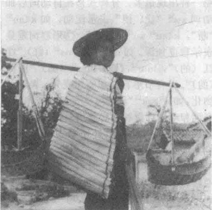
身披蓑扇的阿昌族妇女

阿昌族 中国的少数民族。史籍中称“峨昌”、“莪昌”、“俄昌”等。因居住地区不同,又有不同的自称和他称,如“勐撒掸”、“衬撒”、“汉撒”等。主要分布在云南省德宏傣族景颇族自治州的陇川、梁河等县,此外,也有少数分布在盈江、潞西、瑞丽及保山地区的龙陵和腾冲两县。人口为27708人(1990)。使用阿昌语,属汉藏语系藏缅语族缅语支,分为梁河、陇川、潞西3个方言。无文字,习用汉文和傣文。历史上与景颇、汉、傣、白等族关系密切。