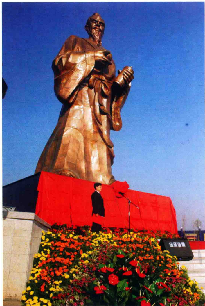
●中国花炮始祖李昉铜像

悠悠岁月，漫漫长河，这一流传千年的民族传统产业是怎样从无到有，从原始到现代，又是怎样发展壮大的呢？