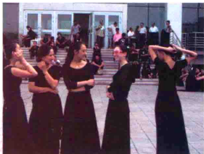
图58 文艺演出前美丽的维吾尔族少女们