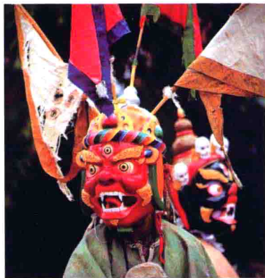
图27 青藏高原神奇怪诞的藏戏装饰