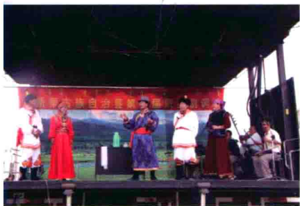
图42 简易舞台上的辽宁阜新蒙古剧表演