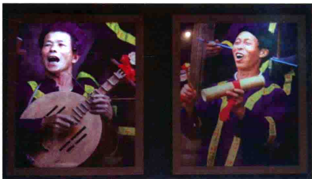
图37 贵州侗族弹奏月琴击竹歌唱