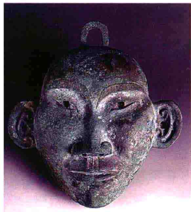
图1 陕西城固出土的史前铜面具