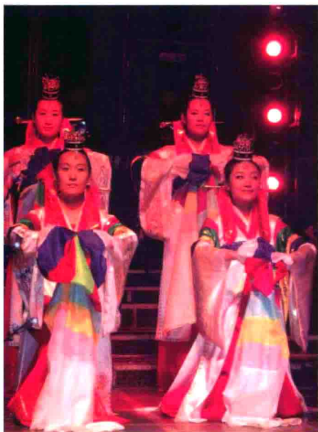
图40 吉林延边歌舞团表演朝鲜族唱剧