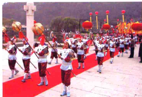
图28 陕西黄帝陵乐舞祭祀仪式