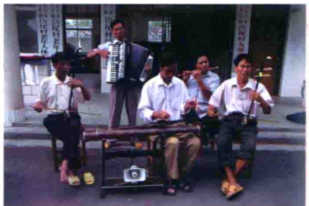
图59 广西防城京族三岛的民间乐队