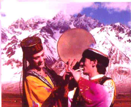
图45 新疆塔吉克族的手鼓鹰笛舞