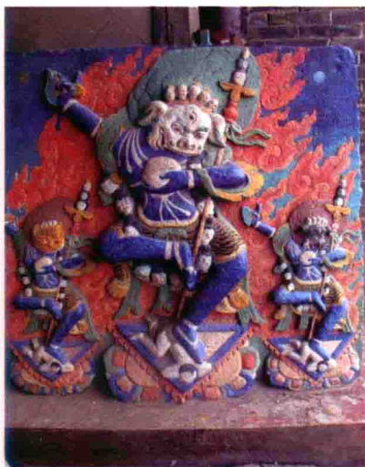
图23 东北佛庙金刚乐舞浮雕