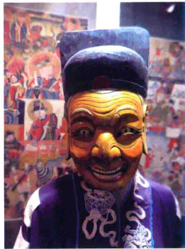
图29 贵州遵义笑容可掬的佬族傩面