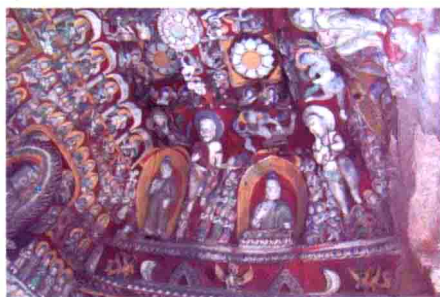
图24 山西云冈石窟古代乐舞彩绘