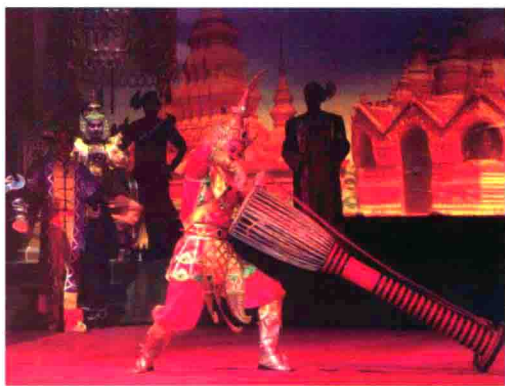
图56 典雅华丽的云南德宏州傣剧团神话剧演出