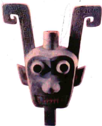
图3 江西出土的史前人头形神器