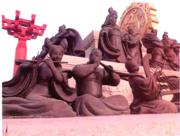
图20 气势雄伟的大唐盛世乐舞阵容