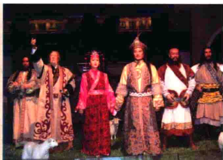
图52 王昭君和亲匈奴