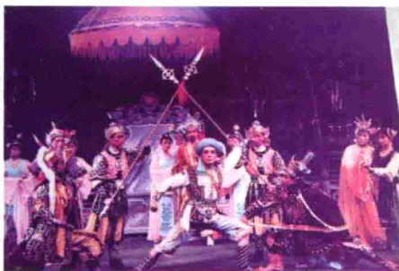
图51 气势恢宏的云南少数民族历史剧