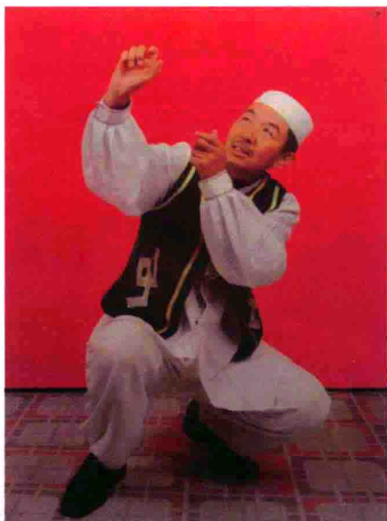
图38 宁夏回族古朴民间歌舞娱乐