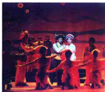
图57 云南大理白剧团塑造的白洁夫人形象