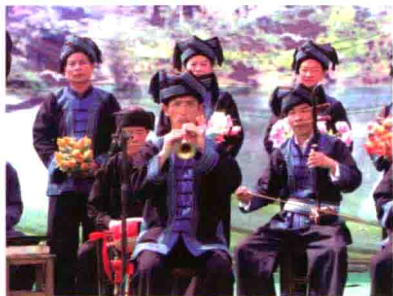
图41 广西南部山区热烈的壮族吹打乐