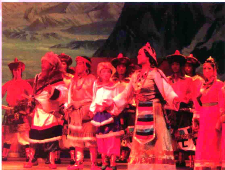
图55 青海黄南民族歌舞剧团演出的藏剧