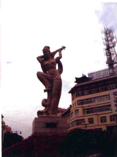
图25 婀娜多姿的敦煌反弹琵琶塑像