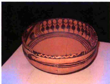
图2 青海同德出土的史前舞蹈陶盆