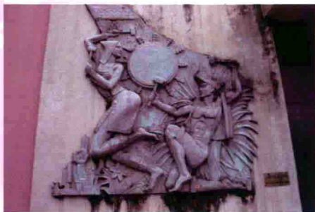
图35 云南哈尼族民间乐舞浮雕