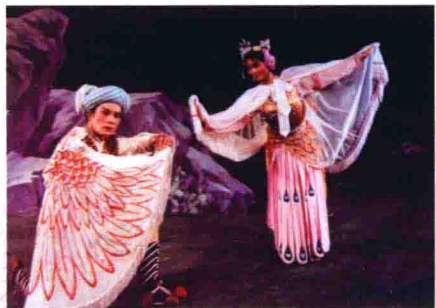
图48 生死相依的民族悲情剧