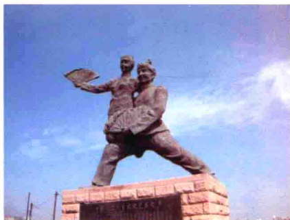
图31 包头内蒙古二人台优美造型