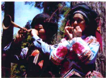
图47 南方少数民族的古老祭祀