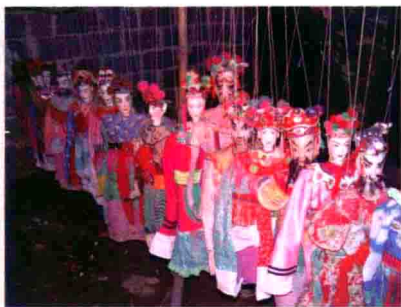
图21 广西靖边壮族民间木偶戏俑