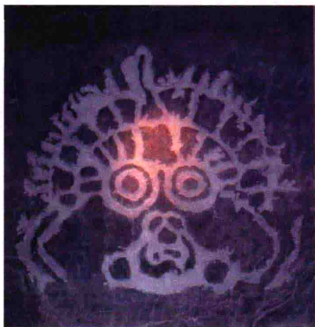
图4 宁夏贺兰山的远古人面岩画