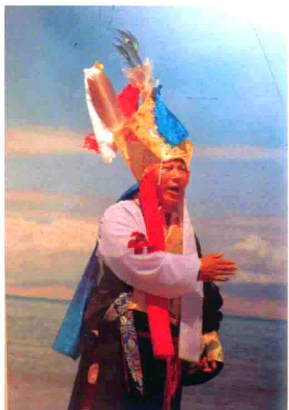
图39 青藏高原上的格萨尔歌手