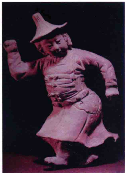
图17 粗犷的金人乐舞石雕