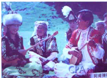
图43 新疆哈萨克族的阿肯弹唱会