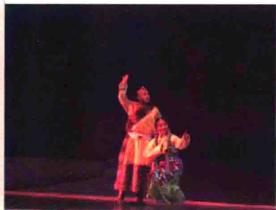
图50 广东汉剧团演出的藏戏