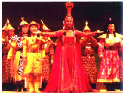
图49 内蒙包头市晋剧团演出蒙族历史剧