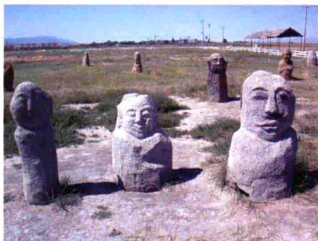
图5 古拙的新疆天山草原石人