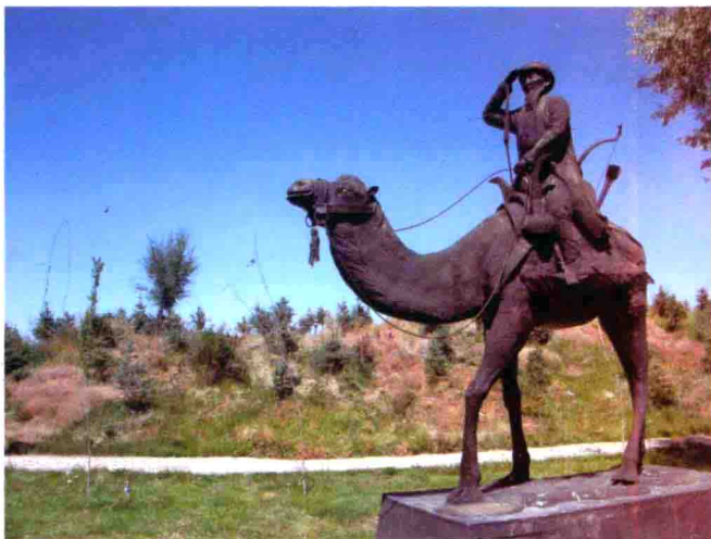
图32 新疆巴里坤哈萨克牧民雕塑