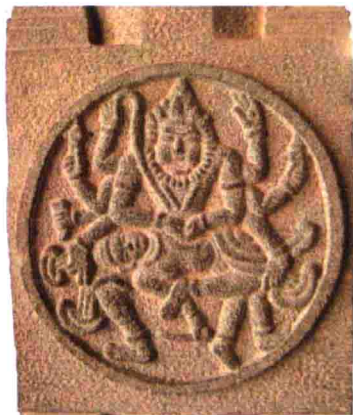
图7 福建泉州寺院的天竺舞神石雕