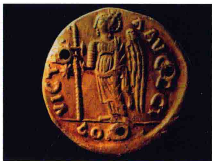
图12 宁夏固原出土的拜占庭金币