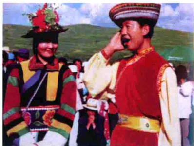
图36 青海湖畔土族青年对花儿