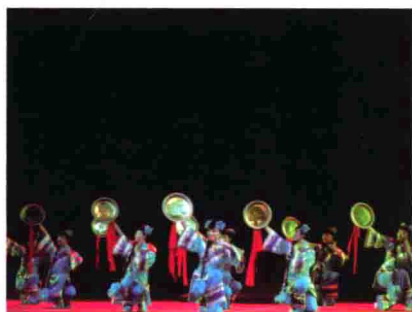
图53 吉林扶余民族剧院演出的新城满戏