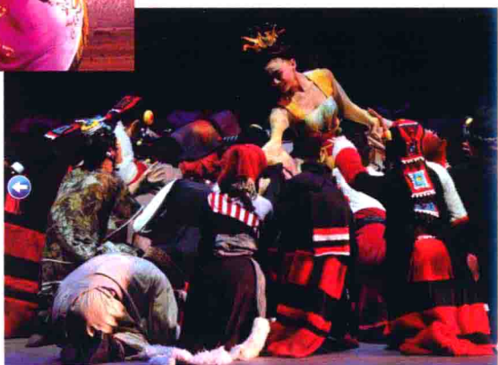
图46 文成公主远嫁吐蕃歌舞剧