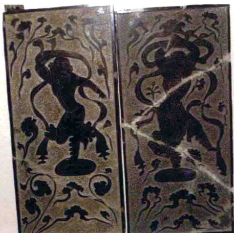
图9 宁夏固原出土的胡旋舞石刻