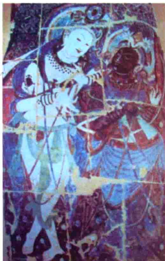
图22 新疆克孜尔石窟双人乐舞图