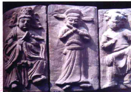
图18 中原出土的宋代杂剧石雕