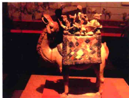
图16 雍容华贵的胡人乐舞唐三彩