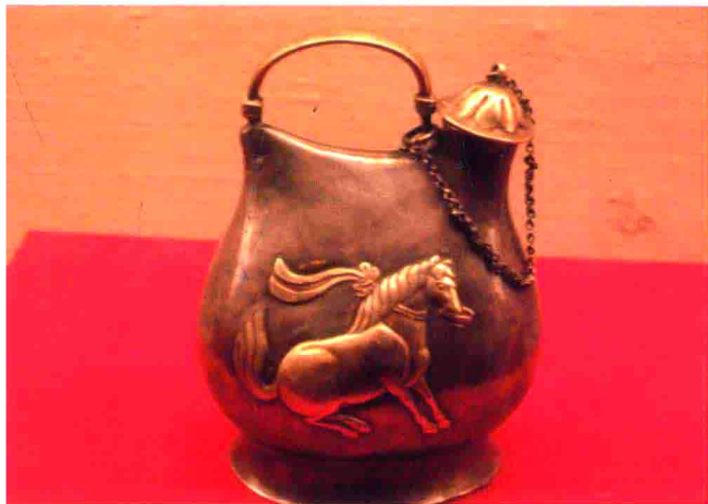
图13 陕西西安出土的唐代马舞金壶