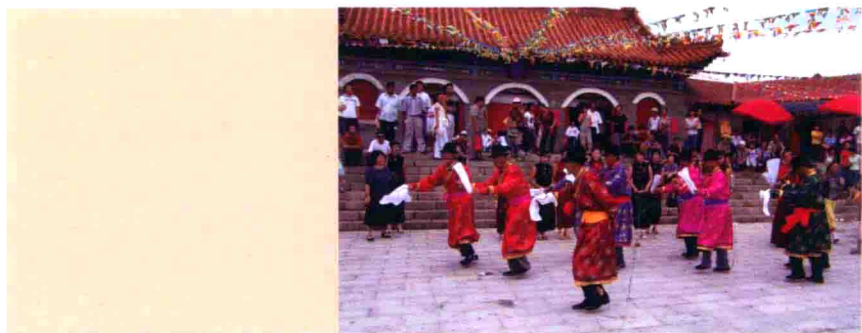
图8 辽宁阜新佛庙前表演的蒙古族歌舞