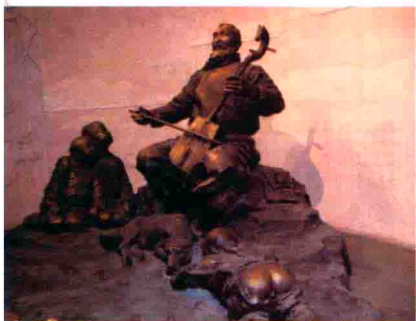
图30 蒙古草原悠扬的马头琴声