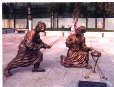
图19 大雁塔景区的古代戏弄铜雕