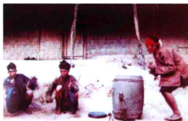
图34 海南岛黎族民间鼓乐表演