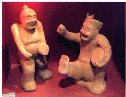
图11 成都郫县出土的汉代说唱俑