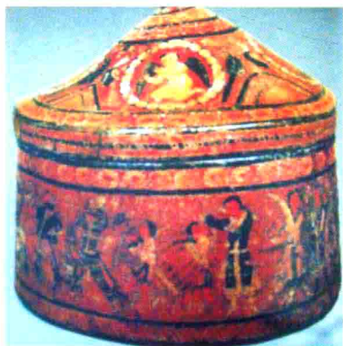
图14 新疆库车出土的西域佛戏舍利盒