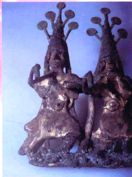
图15 云南出土的古代羽人铜饰