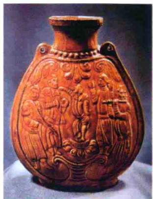
图10 河南安阳出土的胡舞陶瓶