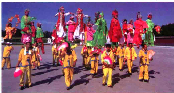
图44 胡汉风格交融的北方民间抬阁表演