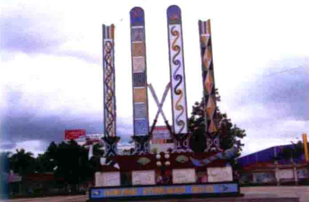
图33 云南景颇族乐舞戏广场