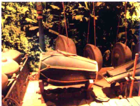
图26 南方少数民族民间打击乐器