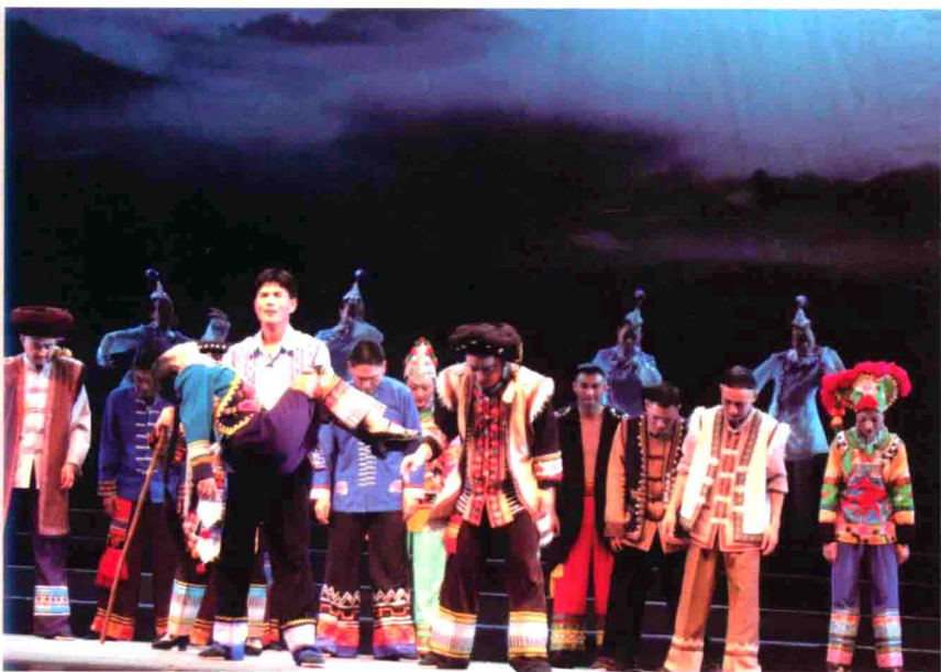
图54 云南楚雄歌舞团演出的彝剧