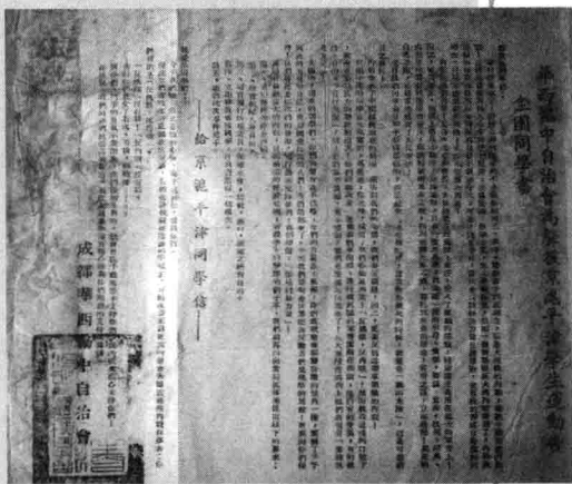
1947年5月24日，华西协中自治会发表的《为声援京沪平津学生运动告全国同学书》。