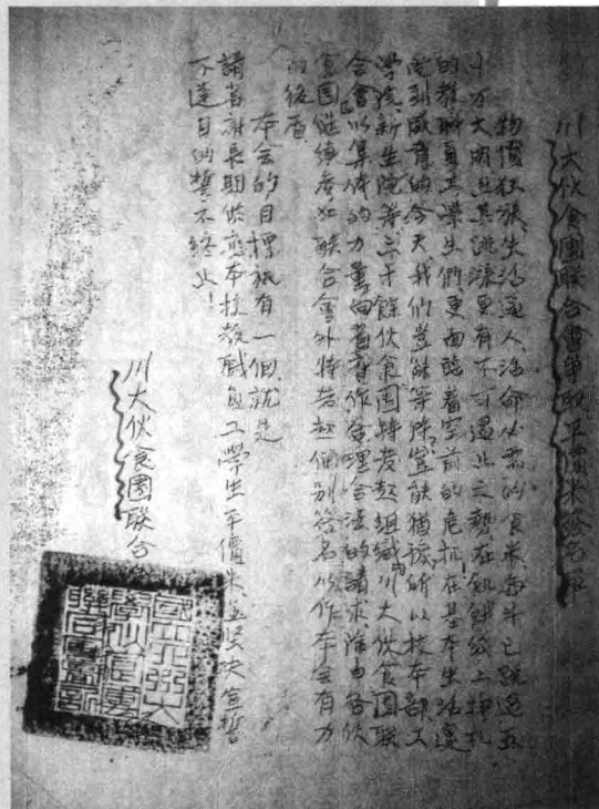
1948年“四九”学生运动中的“川大伙食团联合会”争取平价米签名单。