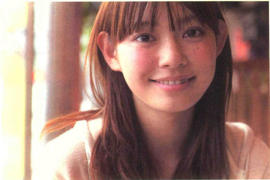
女孩表情柔和、沉稳， 拍摄时将白平衡设定为“阴 天”模式，为画面增加了暖 色氛围。