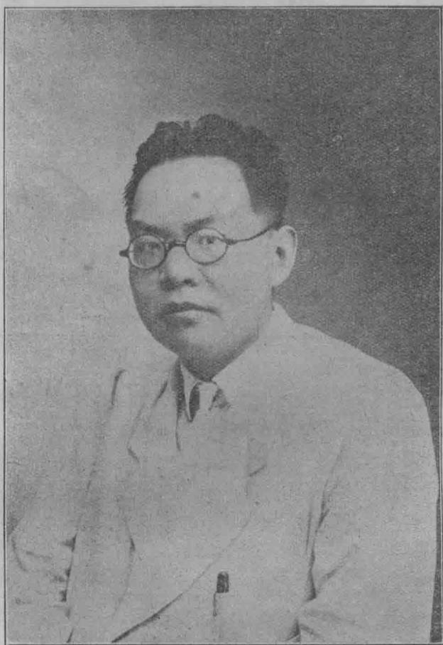
象 造 近 最 者 著