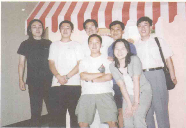
在新东方时的合影

老师之一，都是俞敏洪老师亲自面试和培训。俞敏洪老师在我眼里就是神，聚合了众多优秀的老师，帮助一代又一代人完成出国的梦想。从那时候开始，我也埋下了一个心愿，我希望成为像俞敏洪老师一样的人。当年1999年，我进入新东方的时候，我可以拍着胸脯说，每一个老师都是老俞亲自选拔的，个个是精品，大家也都互相欣赏。那个时候，北京的房子三四千元一平方米，我们的工资是每小时500元外加提成。我记得一个暑假班下来，我赚了十几万，从来没有见过这么多钱，我都不敢相信这是真的。很多老师那个时候每年赚几十万人民币。我们见到有些领导用麻袋分钱，作为分红，这些都是真的。老俞当年就好比梁山好汉里的宋江，让我们大碗喝酒、大块吃肉。一直到今天，我对新东方都充满感激之情。我在新东方第一次坐飞机，是因为支援当时刚刚开办的上海和广州新东方。后来，老俞带我们去海南旅游，让我们开拓视野。下面这张是2001年的照片，左手边第二个人是我，最左边是原副总裁沙云龙，中间是俞敏洪老师，最右边是原副总裁陈向东。