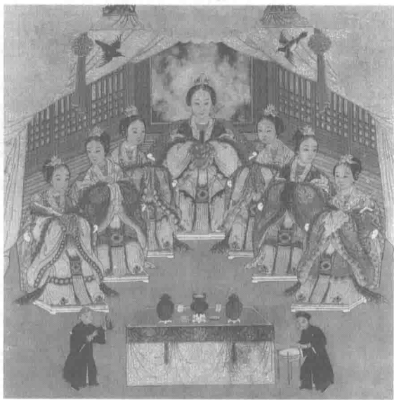
满洲创始女神佛库伦像

村。他小时候没有上过学，少年时就开始在家里劳动。努尔哈赤10岁丧母，继母对他刻薄寡恩，家里并不和睦。努尔哈赤19岁就分家单过。父亲塔克世听了继母挑唆，给他的产业极少，不够维持生活。努尔哈赤常到山里挖人参、捡松子、拾蘑菇、采木耳，然后将这些东西运到抚顺马市（集市）去卖，赚点钱贴补家庭