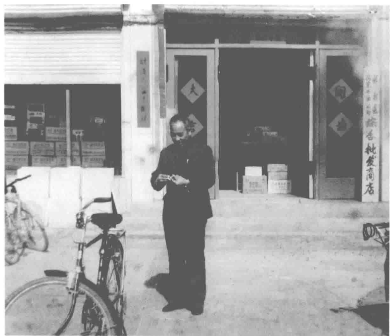
1980年村里成立第一个综合批发商店为村民提供了方便和服务