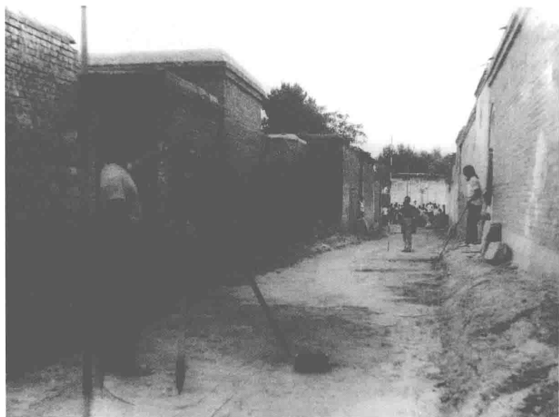
1979年第一期南小郭村街道整修