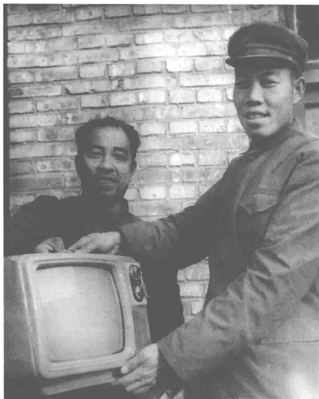
1981年村民领到奖励的电视机