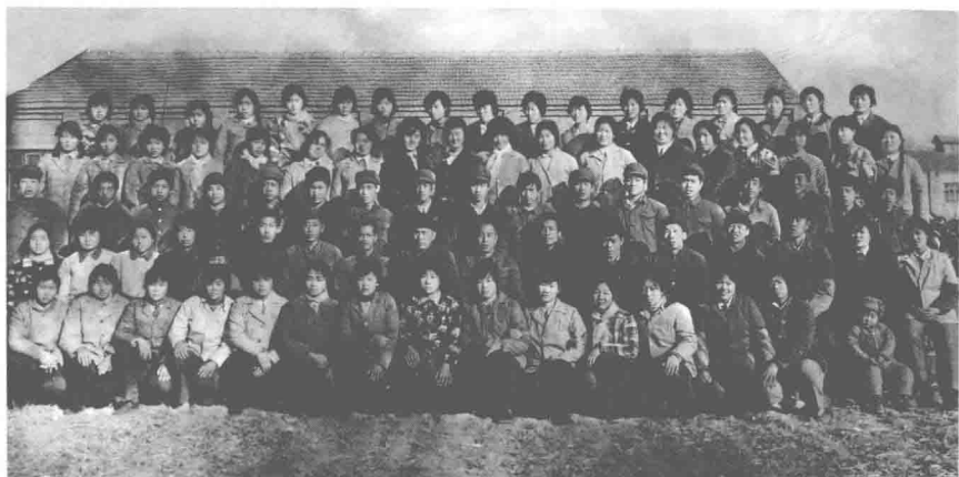
1985年2月3日邢台县第一期陶瓷培训班结业合影