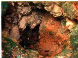
(图 1-1-1) 高岭古矿洞