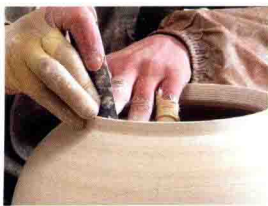
(图 1-2-1) C 修坯

天然蕴藏，昌江的“水陆通衢”等交通条件都使得景德镇彩绘制瓷业历经元、明、清的发展与繁荣成为必然。如今，景德镇高岭土资源已经枯竭，昌江的“水陆通衢”也不复存在，而景德镇的陶瓷彩绘艺术依然为世人瞩目，拥有众多艺术表现形式和风格特点的新彩彩绘，注定拥有极具潜力的发展趋势。