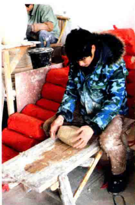
(图 1-2-1) A 揉泥