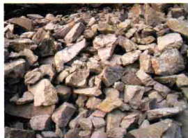
(图 1-1-2) 高岭土