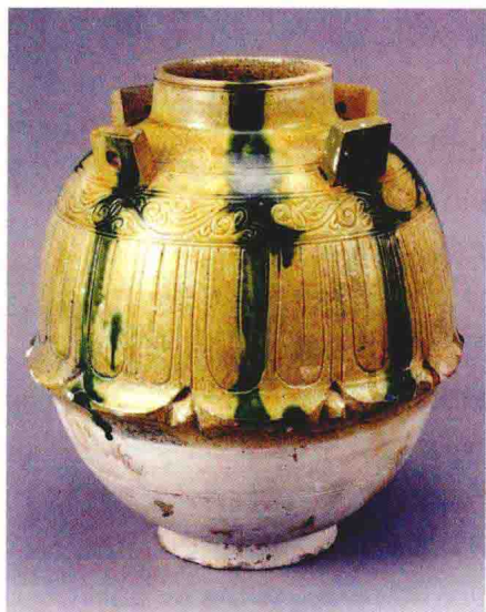
图1-2 北齐范粹墓出土绿彩四系罐

进入三国两晋南北朝之后，瓷器手工业在南方进入快速发展阶段，进而影响了北方地区的瓷业生产；渐次形成各具区域特色的两大体系，南北工艺技术彼此交流、相互竞争，为隋唐五代瓷业生产的繁荣局面打下了坚实基础。（图1-2、1-3）