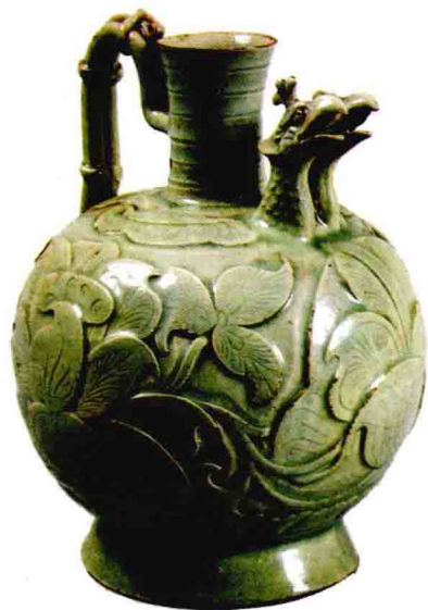
图1-7 纽约大都会博物馆藏宋代耀州窑水注

心的薄胎精细白瓷器，以磁州窑为代表的白化妆瓷，（图1-6）以耀州窑为代表的刻、印花青瓷器，（图1-7）以汝窑为代表的天青釉瓷器等；南方地区则有以越窑、龙泉窑为中心的青瓷生产传统，以景德镇为代表的青白瓷传统，以及以建窑、吉州窑为代表的结晶釉黑瓷生产传统等。