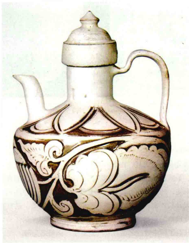
图1-6 东京国立博物馆藏宋代磁州窑水注

各地异彩纷呈的窑业面貌，推进了制瓷技术的不断创新，形成了风格各异的瓷器手工业传统和生产中心，如北方地区以定窑为中