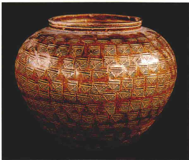
图1-1 浙江省博物馆藏东汉褐釉印纹瓷罐

可以说，东汉晚期出现的成熟瓷器在工艺、质量和应用广度上都较原始瓷器有了长足进步和提高；但毕竟处于初创阶段，一定程度上还存留“原始性”的痕迹，工艺技术与产品风貌上尚未真正形成独立体系。（图1-1）