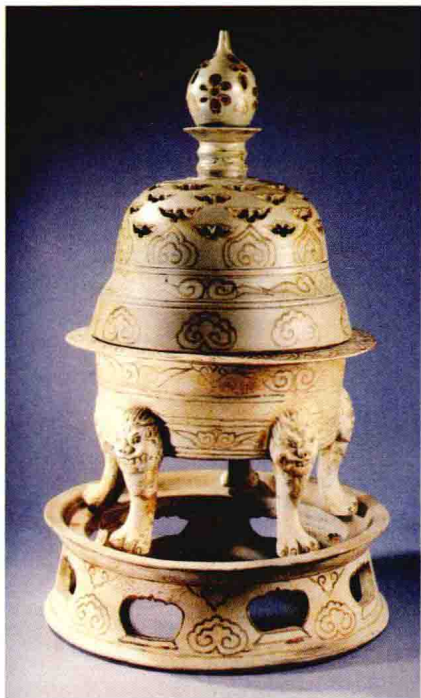
图1-4 浙江临安水邱氏墓出土晚唐越窑香炉