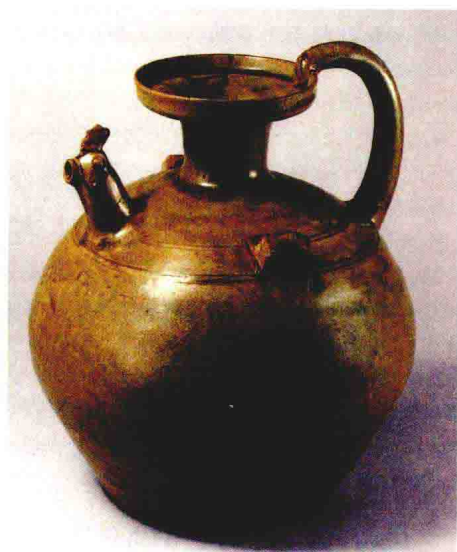
图1-3 南京出土东晋青瓷鸡首壶

这一阶段南方地区已开始普遍生产成熟的青釉和黑釉瓷器，并在浙江、湖南、江西和福建等地初步形成了一些制瓷中心和产品体系。生产地域不断扩大，瓷器品类日益增加，器物造型更为丰富，成功烧制出以鸡首壶为代表、兼具实用性与观赏性的新产品。装饰