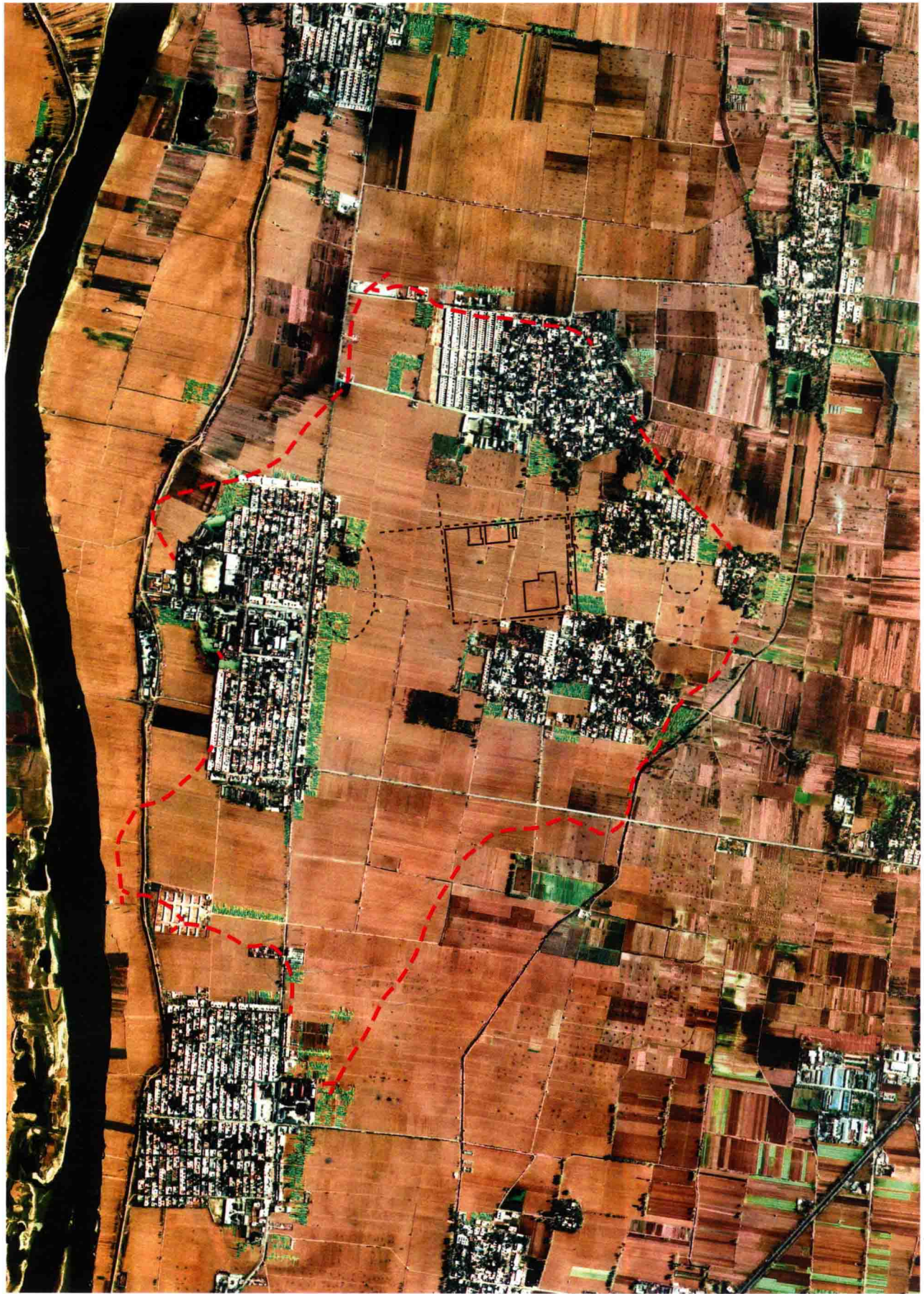
彩版二 二里头遗址卫星影像