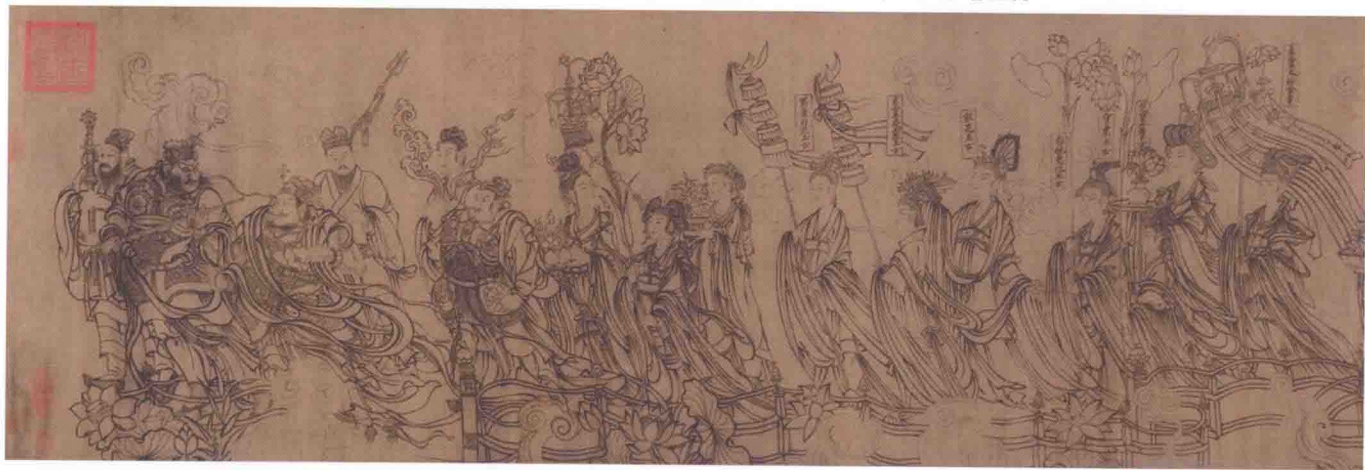
《朝元仙仗图》宋·武宗元