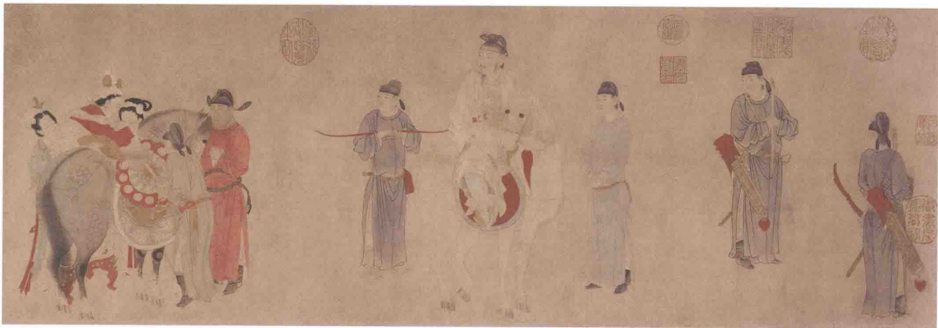
《贵妃上马图》（局部）元·钱选

人物画发展到元代，就没有山水画和花鸟画那样兴盛。人物画虽不是元代绘画的主流，但在潜流之中也有一定的发展，并且在某些方面也有独到的特色。一些人物画的优秀传统被一些画家所继承并发扬光大。