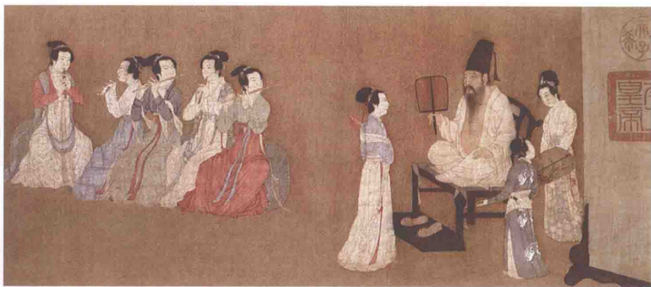
《韩熙载夜宴图》（局部）五代·顾闳中

宋代时期绘画有了长足的发展，也组织了创作活动。肖像画的突出成就表现为宫廷写真高手和民间写真画师的活跃，人物故事画和风俗画的发展则达到了相当的高度。代表人物——梁楷，其减笔人物画更是在发展写意人物画的技巧方面做出了卓越的贡献。风俗画的发展则是在宋代城市经济的