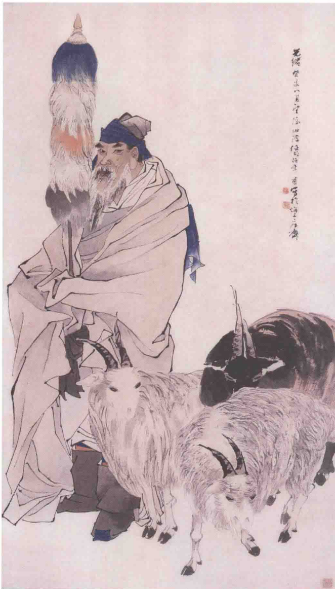
《苏武牧羊图》（局部）清·任伯年

初学写意人物画时，可先从着色的兼工带写开始练习，然后再逐步放开用笔，进入意笔着色。其中着色方法也是可以从淡彩开始，然后循序渐进到重彩的刻画。