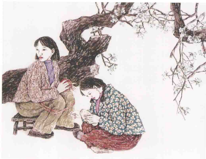
《吉祥秦地系列》(局部) 秋霖

现代写意人物画注重画面的色彩调子，如西方绘画，特别是水彩、水粉画的用色方法，现代工艺美术的色调表现，都是影响中国写意人物画的调合色使用的重要因素。但中国写意人物画调合色研究的重点应放在固有色的变化上，对光源色的研究与利用不能作为重点。调合色应在表现丰富多彩的固有色的变化上多下工夫，从色块的并置效果中求得大统一、小对比、丰富而协调的效果。