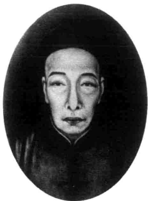
鲁迅的父亲周凤仪（1861—1896）， 字伯宜