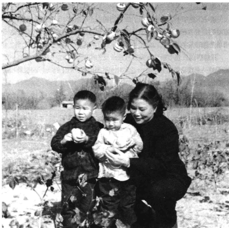
50年代北京香山，奶奶与我和哥哥援朝