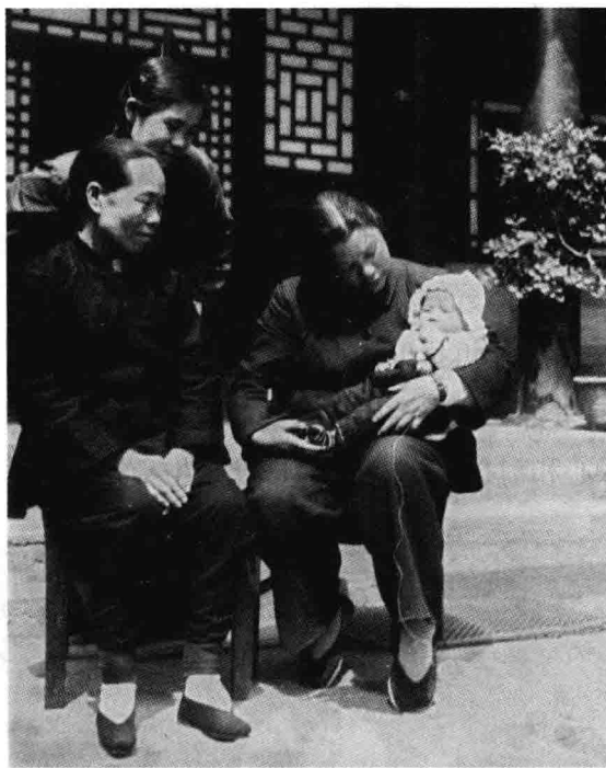
20世纪50年代北京中南海，姥姥、奶奶、母亲和我

刚进中南海时，我家住在含合堂，后来搬到永福堂，这两处都是四合院式的平房。因为房子不多，我就和奶奶睡在一起。后来我们又搬进了中南海的西楼大院，我和哥哥也有了自己的房间，但一到节假日，奶奶还是让我和她一起睡。有一次，我把奶奶的床给尿湿了，奶奶非但不气不恼，还笑着对大家说：“瞧瞧，小龙王发怒了，又发大水了！”