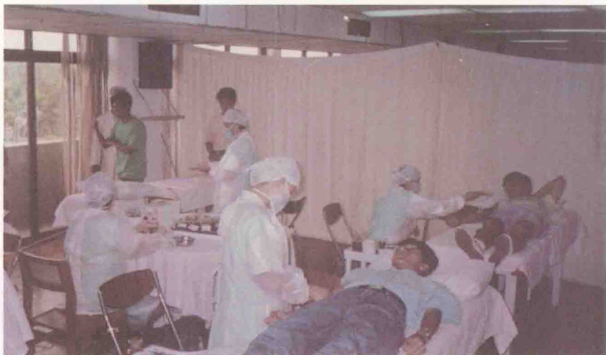
1994年，深圳大学学生集体献血。