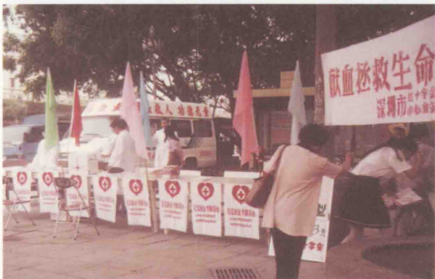
1995年，深圳第一辆捐血车上街。