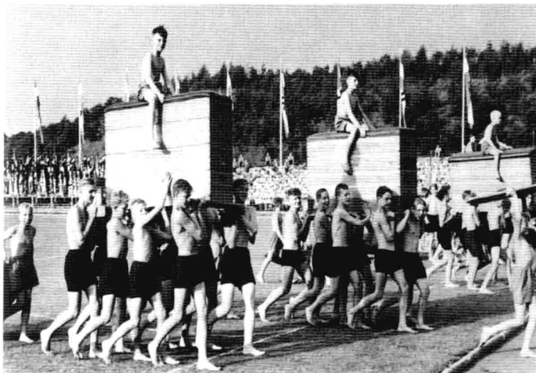
德國「少年衝鋒隊」，「希特勒青年團」的兒童組織。「希特勒青年團」經常組織各式各樣的體育競技，來提升青少年們的體能以及技能。