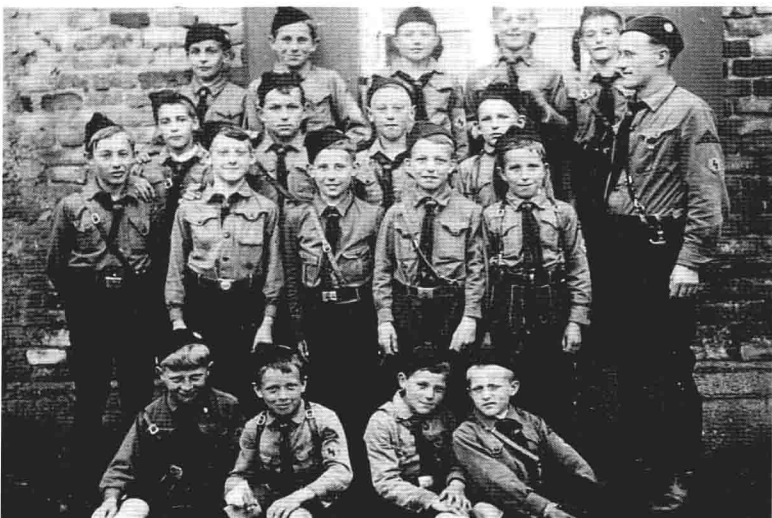
1934年。黨衛隊攝影師包爾（Friedrich Bauer）與「希特勒青年團」的少年合影。從少年們臉上的笑容，深深感覺到他們對能穿上這身制服的驕傲。