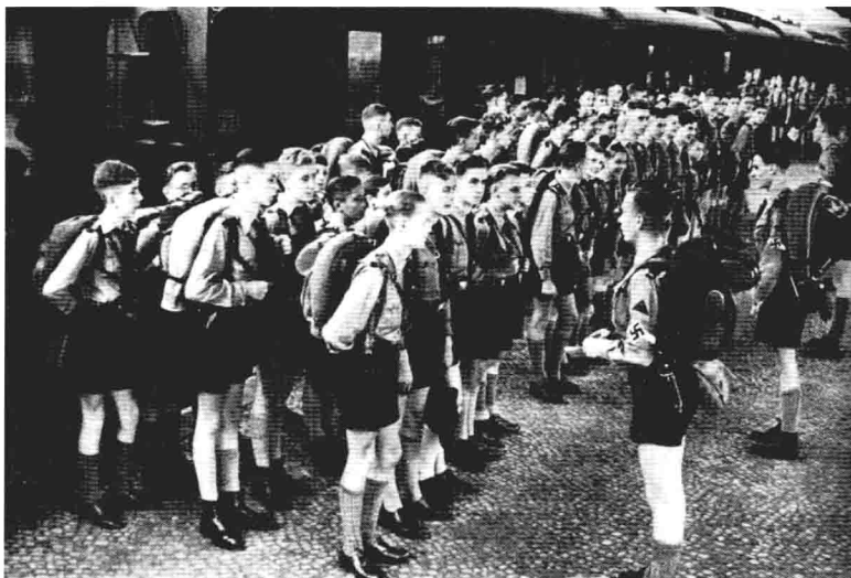
1939年，正在整隊準備上車的「希特勒青年團」團員，他們將乘火車前往布蘭登堡幫助收割。整個二戰期間，由於德國國內勞動力缺乏，「希特勒青年團」在這方面扮演了重要的角色。