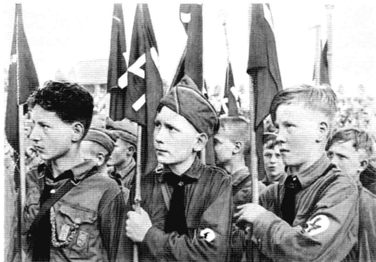
「希特勒青年團」的小旗手們手執紅底白色閃電標誌的旗幟，專心聆聽會場中的演說神情。