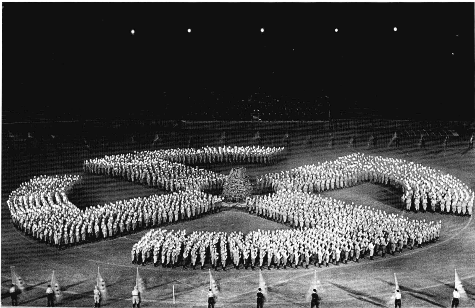
1933年8月27日紐倫堡。「希特勒青年團」團員在聚會中排列組成國徽標誌，位於正中的營火將燃燒成為大會的高潮。