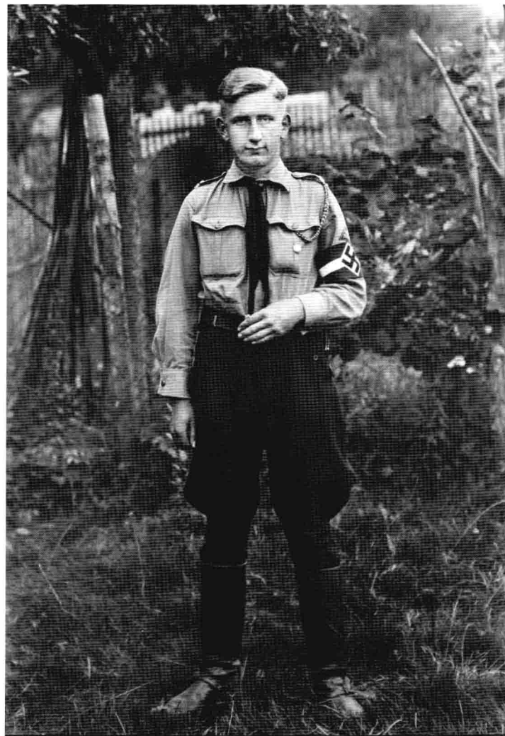
「希特勒青年團」資深團員的制服。褐色襯衫、黑褲、黑領帶與長靴。其髮型為耳上剪齊，這是當時德國最流行的少年髮型，其後也被「希特勒青年團師」所沿用。