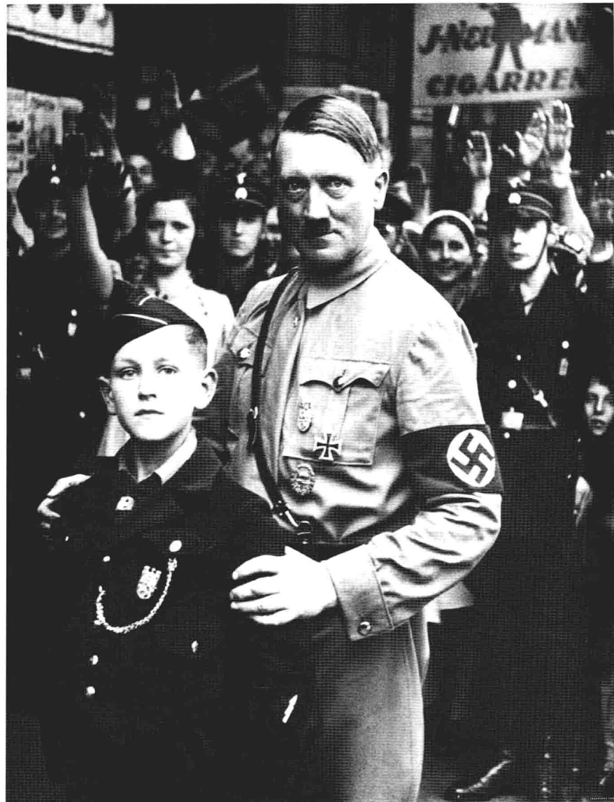
希特勒與「少年衝鋒隊」的小隊員合影。在當時的德國，這是何等讓孩子與家長感到無上光榮的大事！