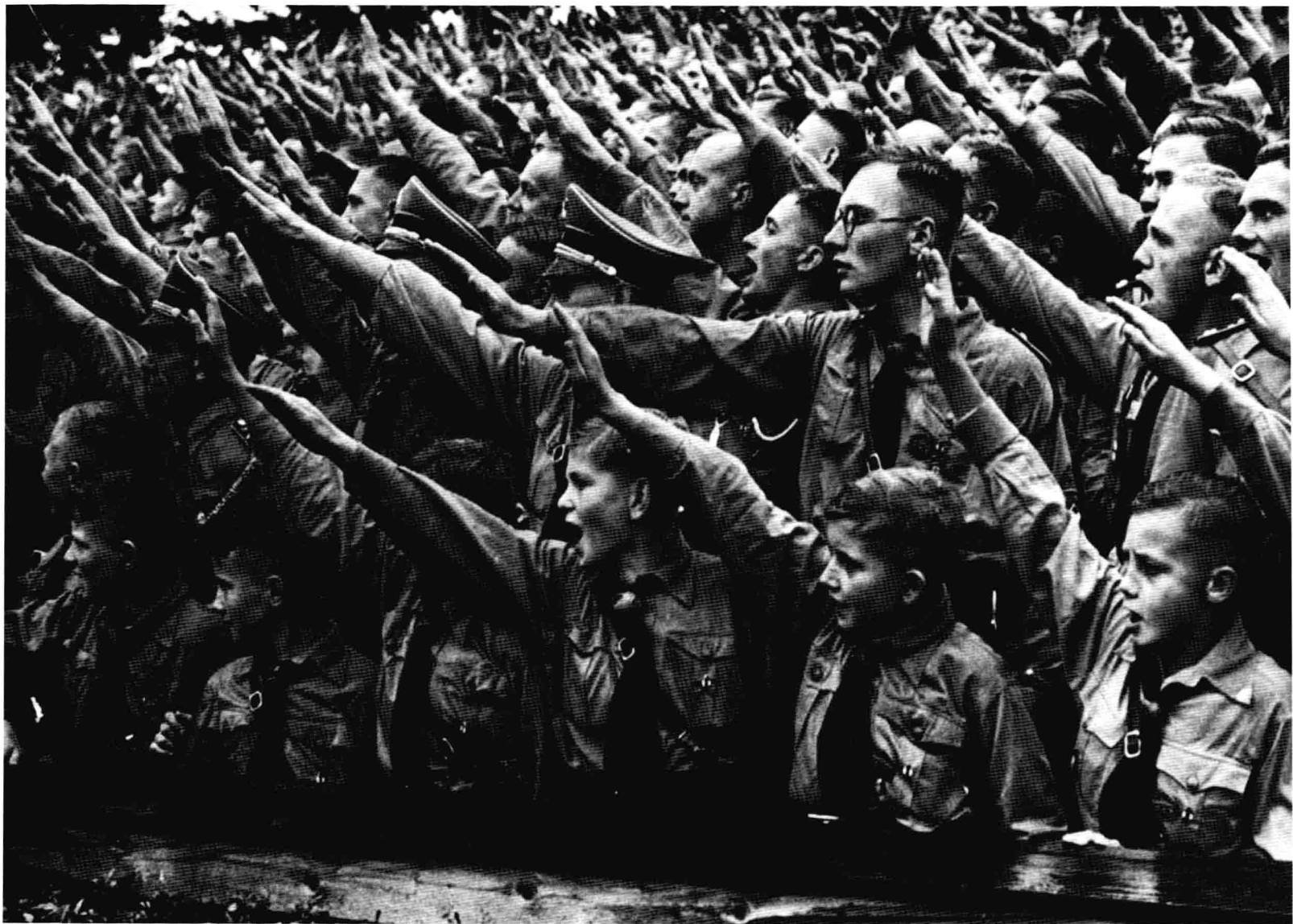
在會場中行禮歡迎元首進場中的「希特勒青年團」團員。