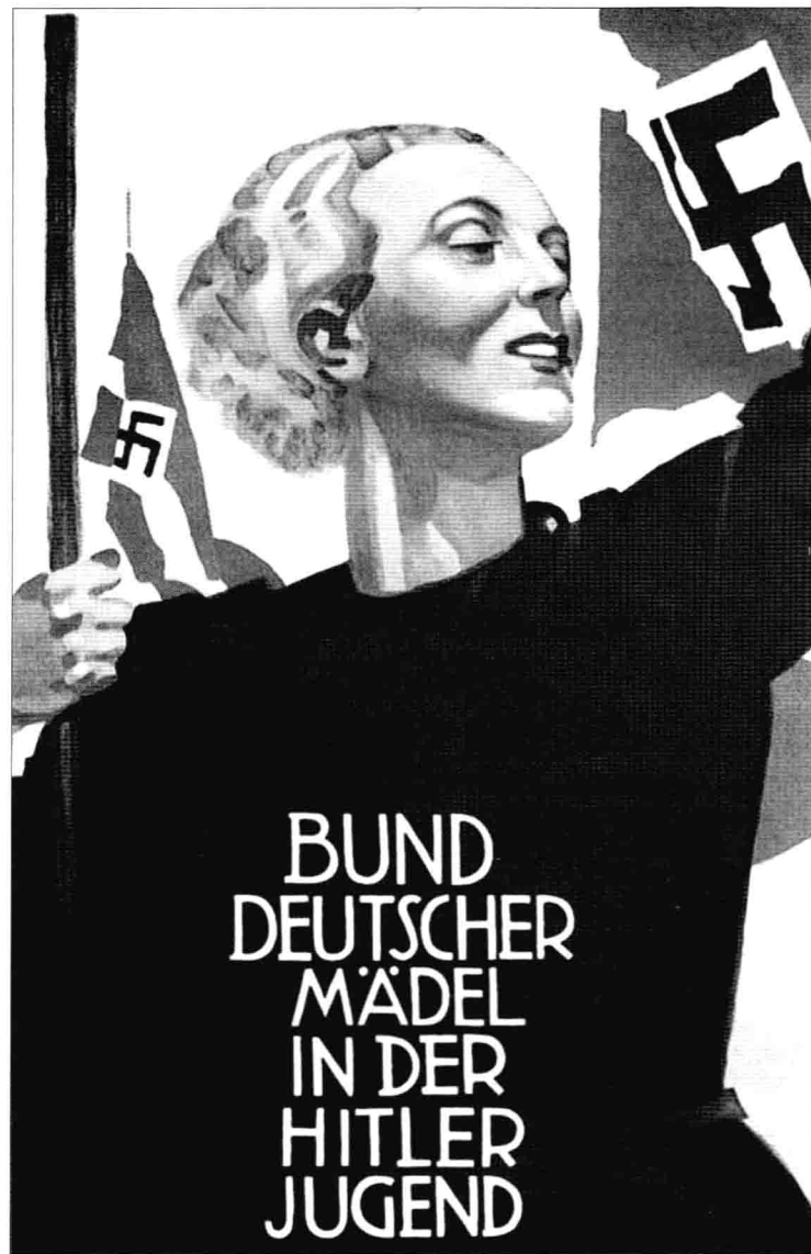
「德意志少女聯盟」招募海報。