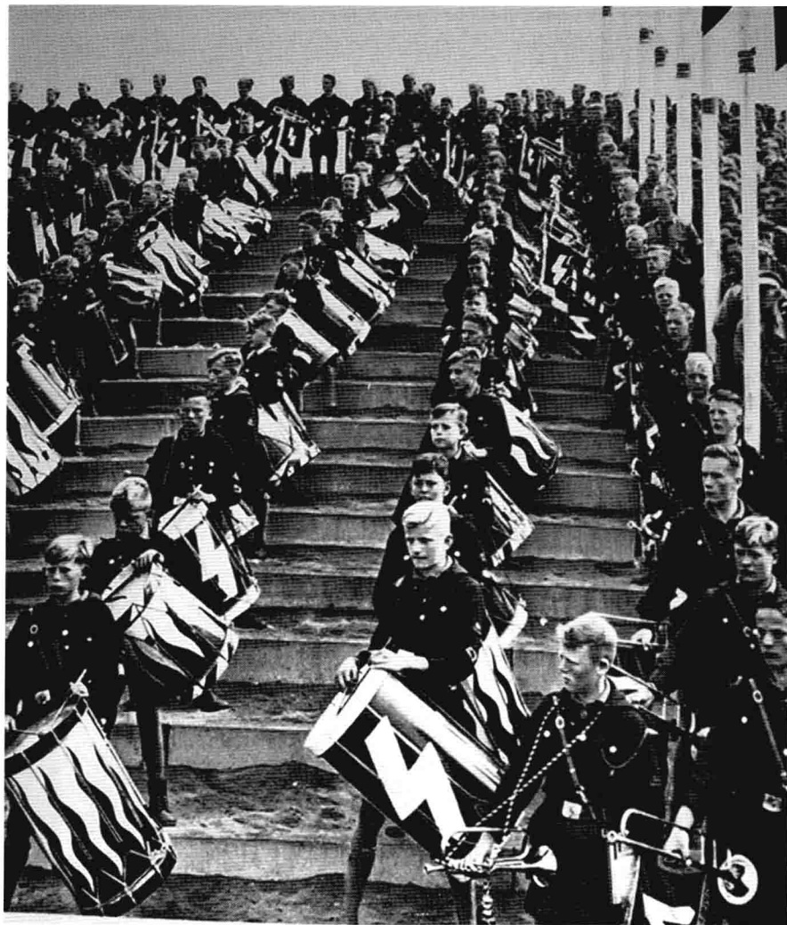
「希特勒青年團」的鼓手們。鼓側的上升火焰標誌與「S型」閃電標誌都來自北歐神話。