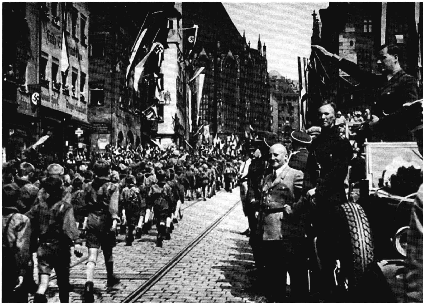
1933年紐倫堡，席拉赫於指揮車上迎接來自全國的青少年進入會場一景。