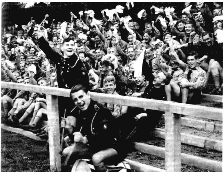
正在競賽場旁吶喊助威的「希特勒青年團」團員們。