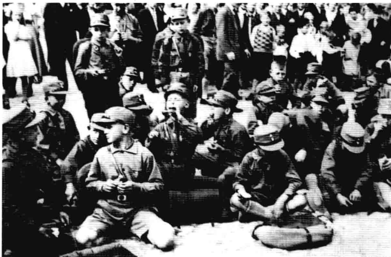
「德意志民族的未來」，一次集會途中的德國少年們正在稍事休息。