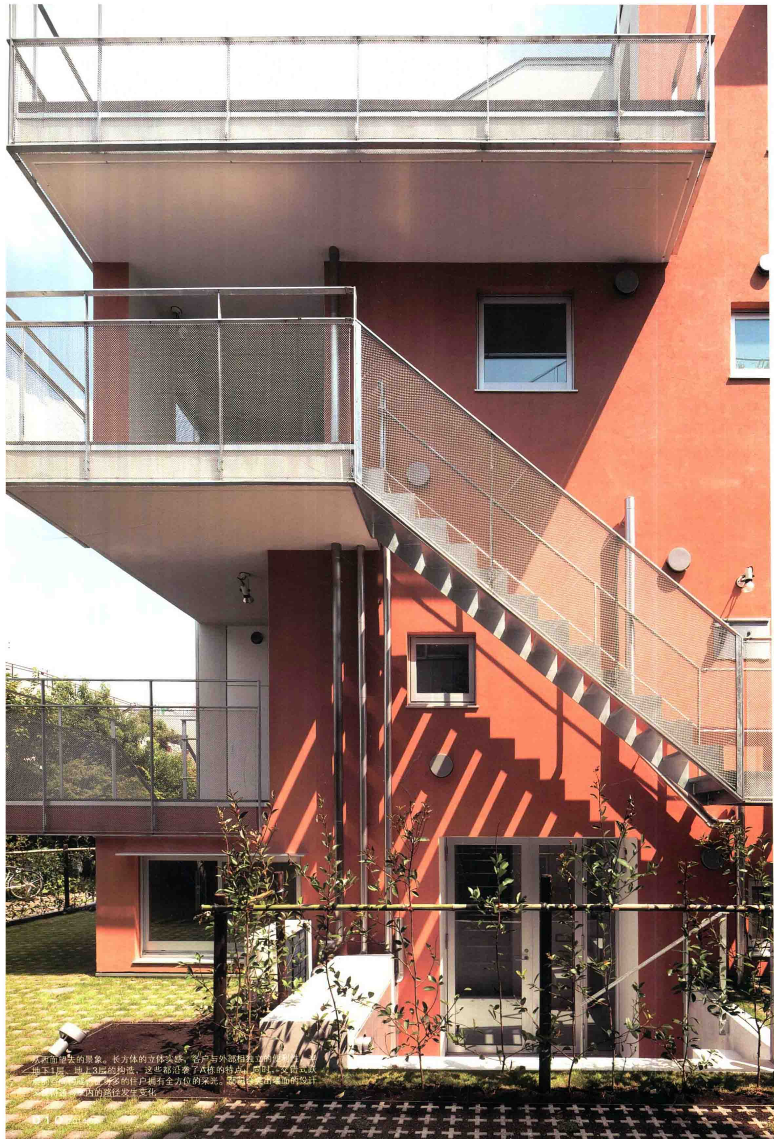
从西面望去的景象。长方体的立体实感，客户与外部相独立的便利性，地下1层、地上3层的构造，这些都沿袭了A栋的特点。同时，交错式跌宕的空间构造，让更多的住户拥有全方位的采光。而阳台突出墙面的设计，也让通车的车行路径发生变化。