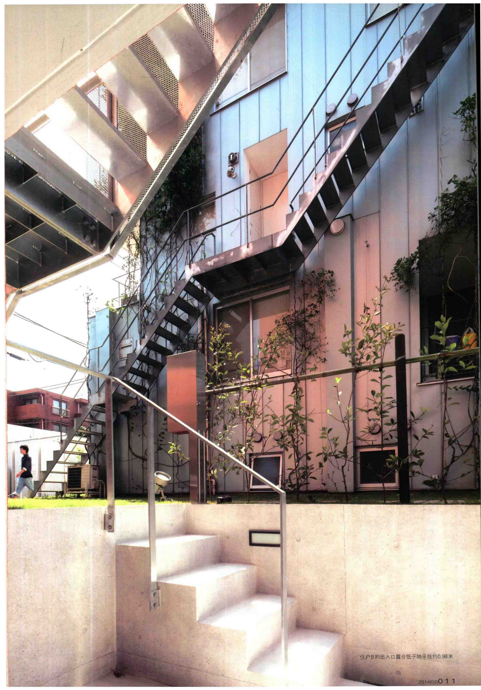
住户B的出入口露台低于地平线约0.98米