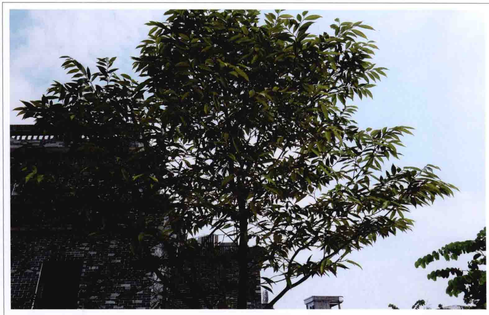
▲ 小叶沉香树 沉香树根据叶片的大小分为大叶和小叶。香农们认为小叶沉香树较易结出黑油沉香，大叶沉香树较易结出黄油沉香。

沉香树属双子叶植物药瑞香科，是一种常绿乔木，也被人们称为白木。国内的主要产地有海南、广东、广西、香港、台湾等地区，国外的产区则主要分布在东南亚等国家。值得注意的是，近年来由于大量砍伐，导致野生沉香木资源已经十分匮乏，沉香树已经成为国际保护树种，禁止砍伐和出口了。