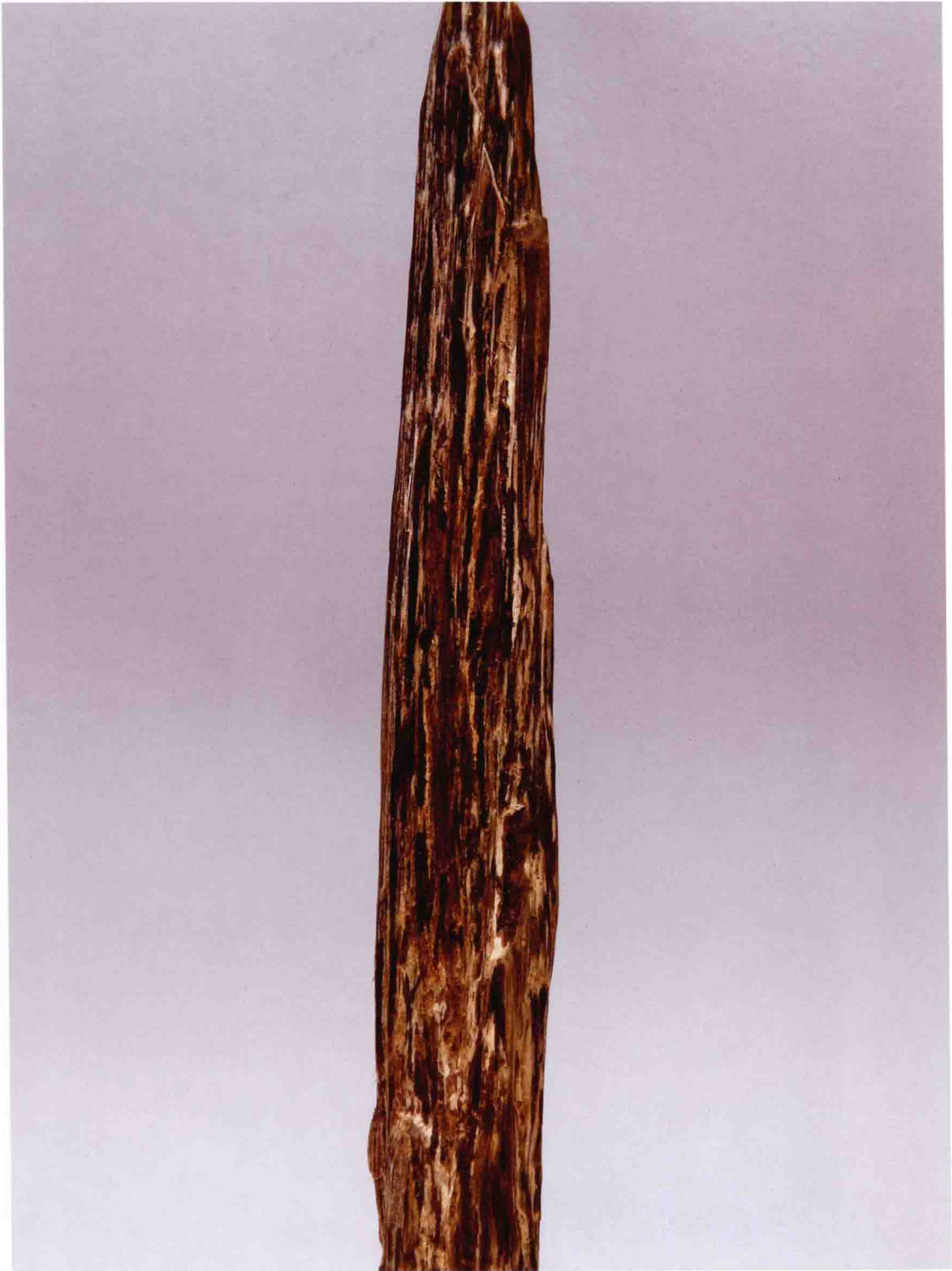
▲ 富含油脂的沉香原材