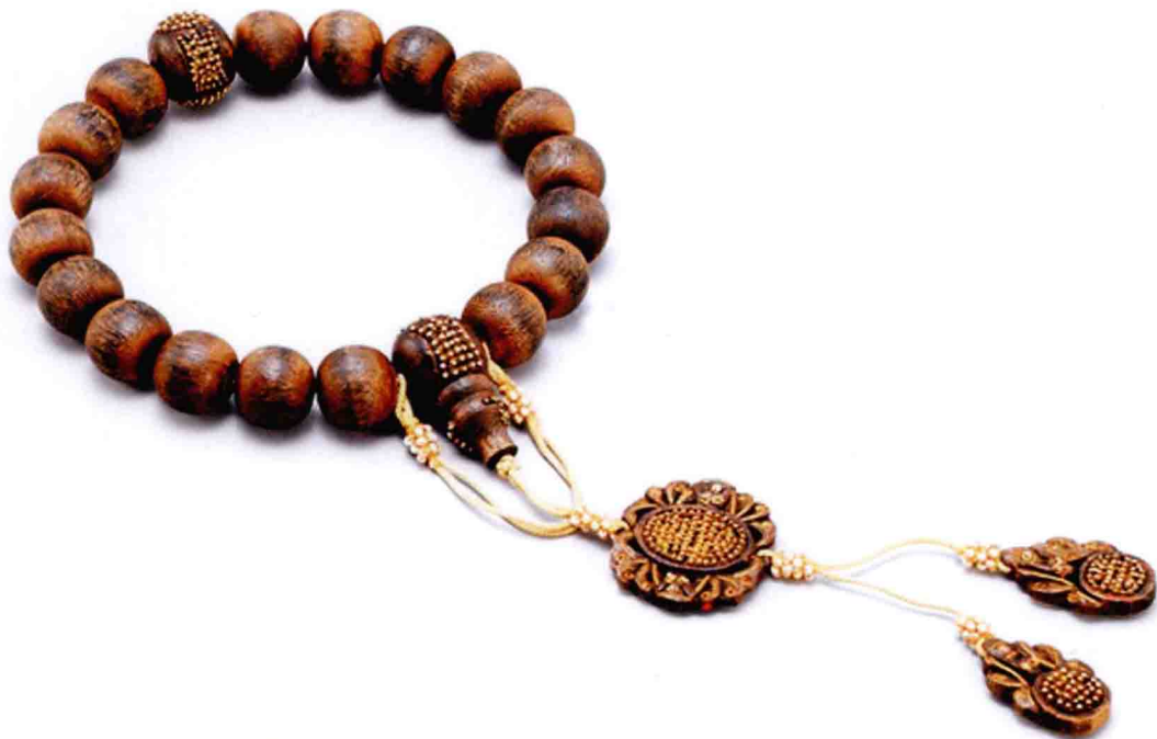
▲ 清·伽楠香十八子捻珠 在北京匡时 2013 年 6 月 5 日拍卖会中以 5,174,000 元人民币拍出。

近几年国内刮起了“沉香热”，沉香的价格可以说是疯狂飙，因此沉香被誉为“木中钻石”。那么如此昂贵的沉香是怎样形成的呢？沉香的形成可以说是各种环境条件共同作用的结果。下面就为您详细介绍沉香是怎样形成的，揭开“木中钻石”的神秘面纱。