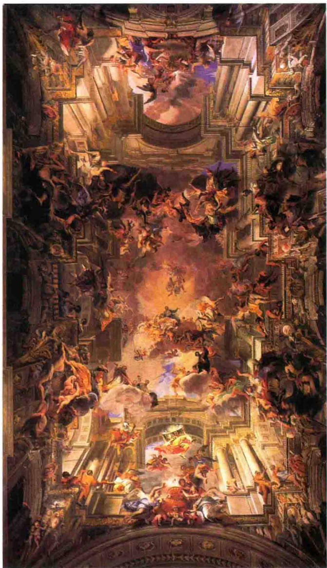
6 安德列阿·波左,《詠讚聖依格納提爾斯》。此畫被設計成要從本堂的正中央以白石頭作記號的那一點抬頭觀看,製造了一種迎向天國的幻覺。