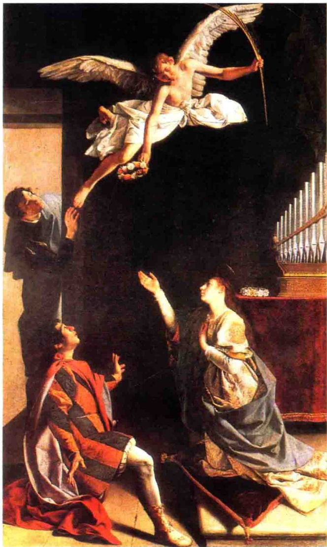
4 簡提列斯基,《殉教者聖塞西莉亞、聖瓦萊里安、聖提布魯歐與天使》(The Martyrs St Cecilia, St Valerian and St Tiburtius with an Angel)。此畫是卡拉瓦喬畫派中在情感節制方面的代表。迴旋而昇的構圖完美地表達了對天堂的嚮往,而這種巴洛克式的元素與卡拉瓦喬無關。