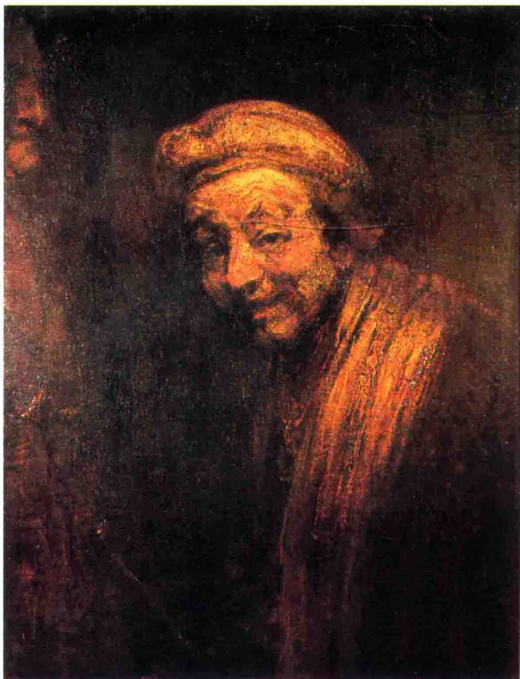
15 林布蘭，《自畫像》(Self-Portrait)，1668。林布蘭與梵谷 (Vicent Van Gogh) 兩人皆迷惑於生命的內在意義，而以深入探索自己的樣貌來追求靈魂的祕密。