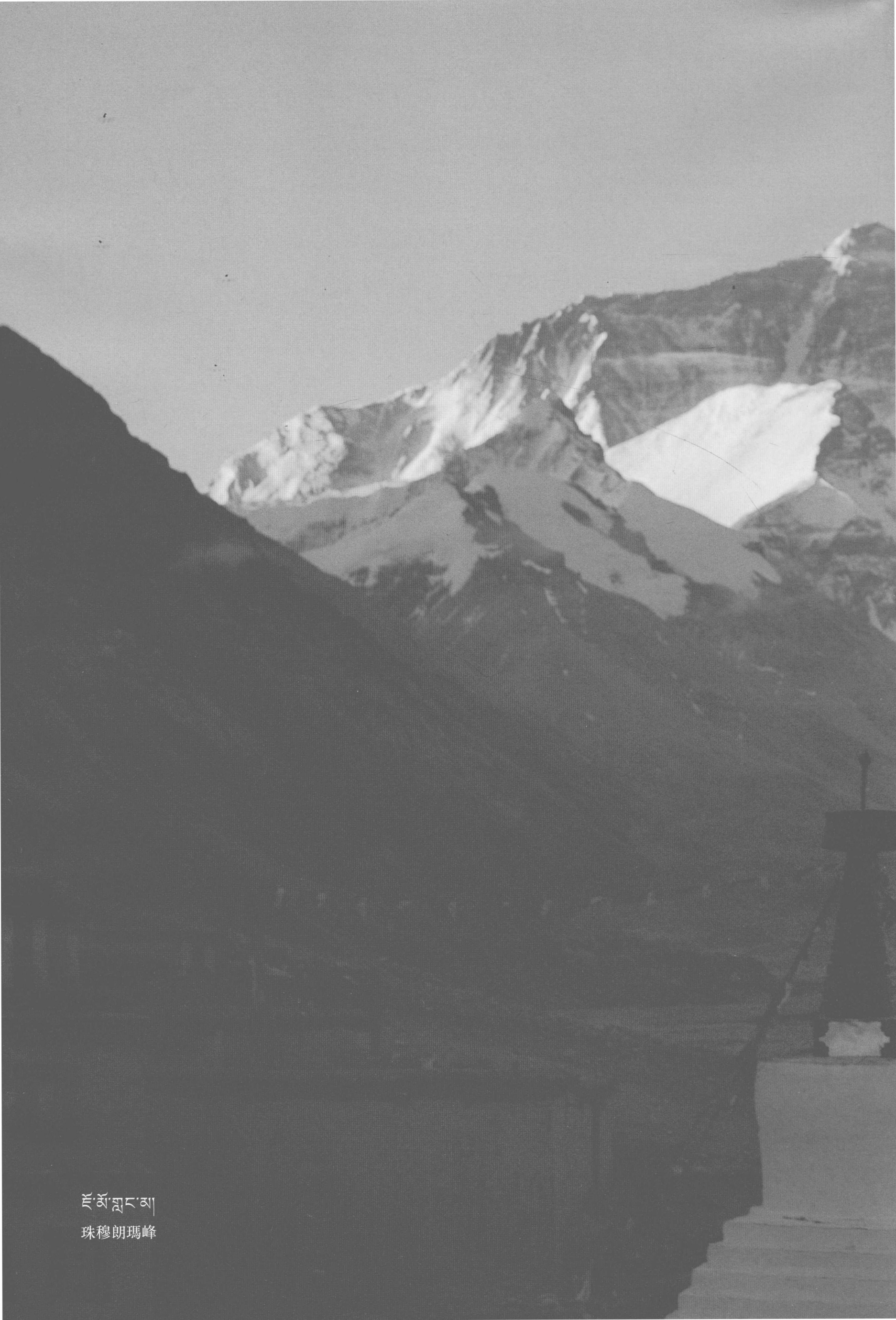
ཇོ་མོ་གླང་མ། 珠穆朗瑪峰