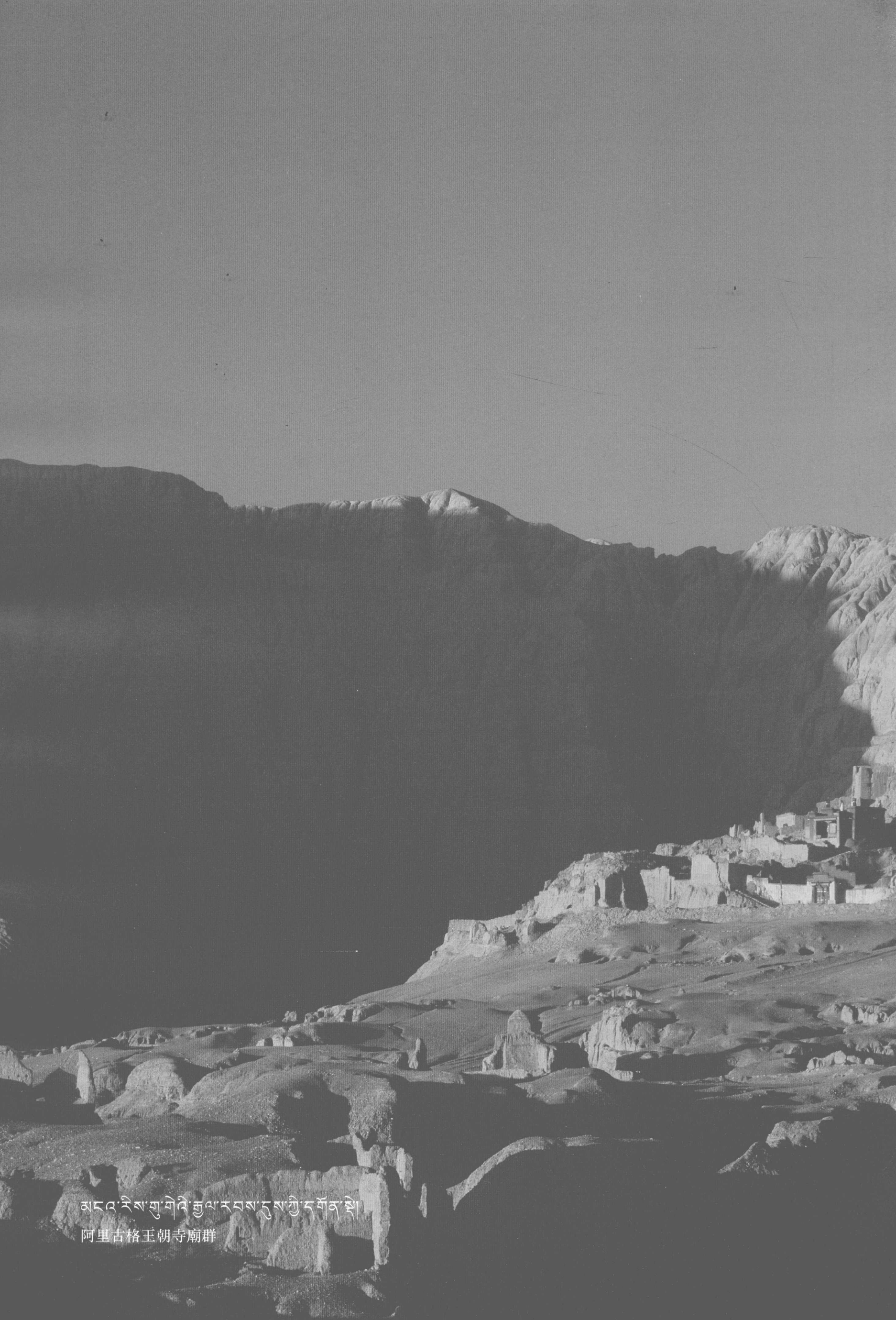
མངའ་རིས་གྲུ་གཤི་རྒྱལ་རབས་དུས་ཀྱི་དགོན་ཆེ། 阿里古格王朝寺廟群