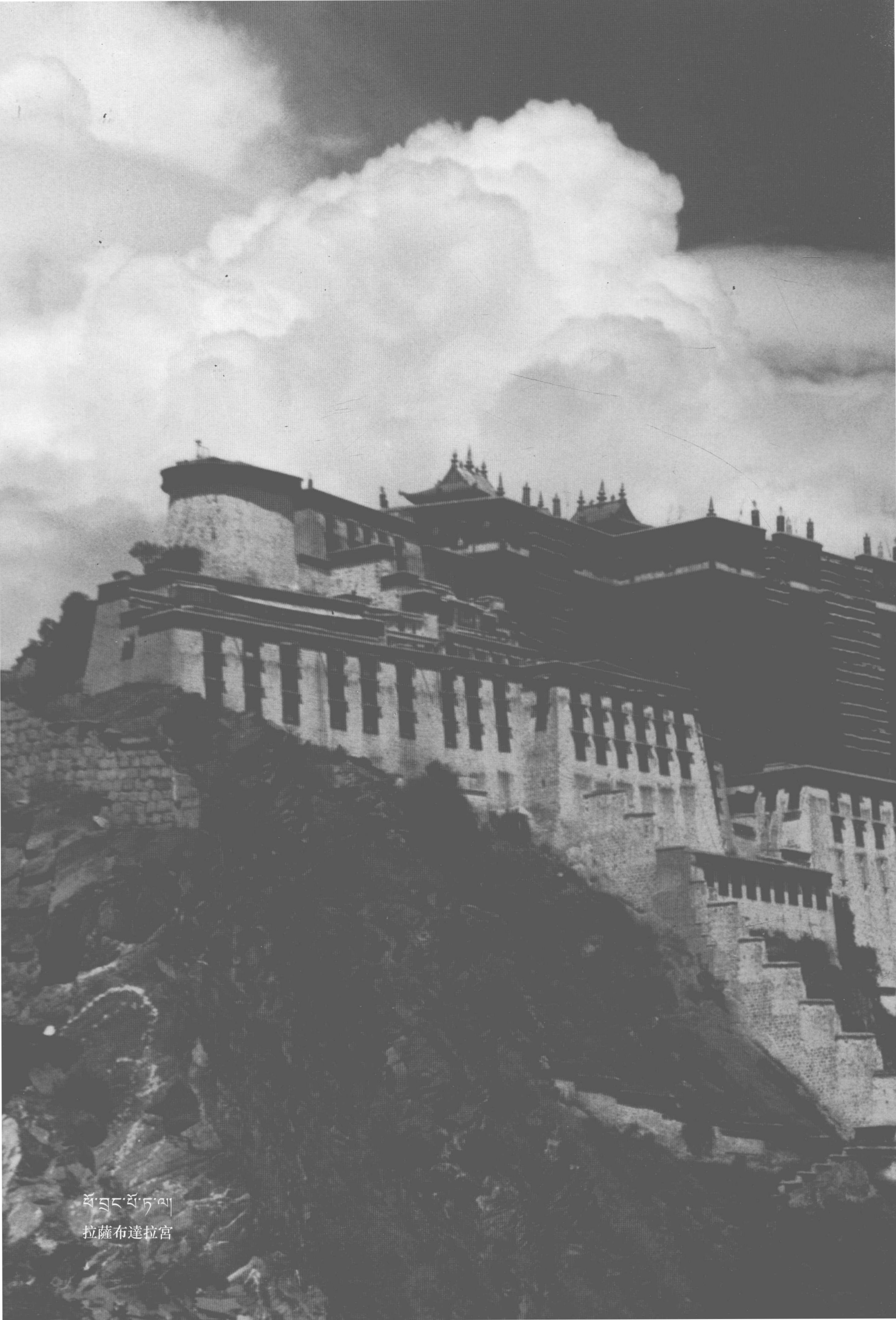
པོ་བླང་པོ་ཏ་ལ། 拉薩布達拉宮