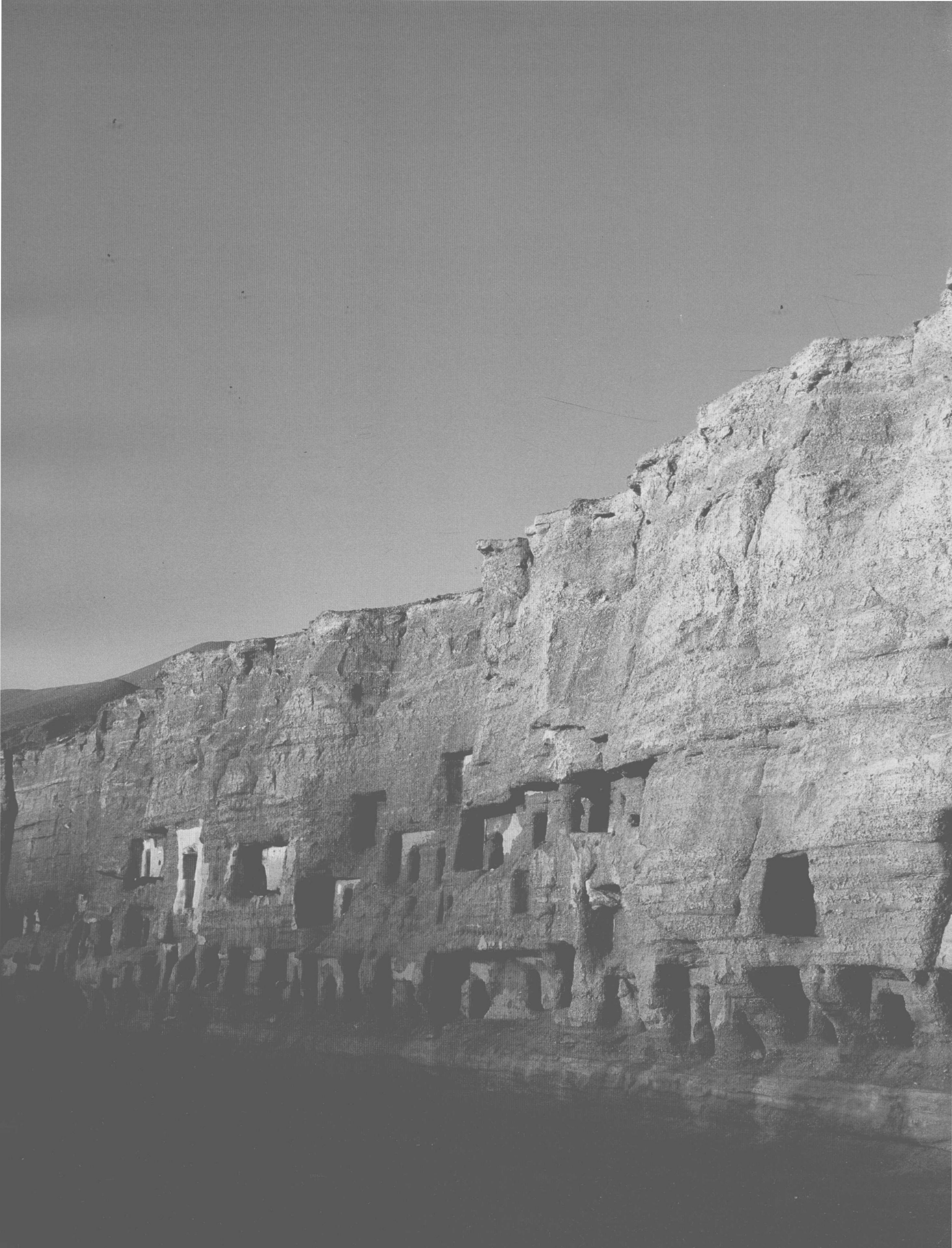
དུན་ཉིང་མོ་ཀོ་ལུ་ཡི་རུབ་ལུ་བྲག་ཕུག 敦煌莫高窟北區石窟