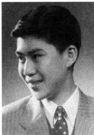
一九五一年，香港喇沙书院留影。