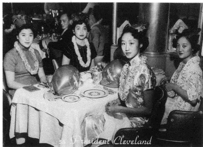
三姊先明（左）欢聚合影。