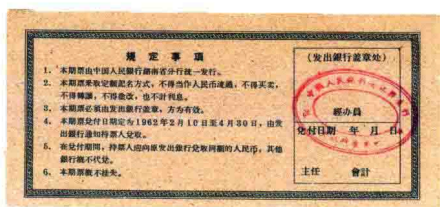
1962年·中国人民银行湖南分行期票壹圆整