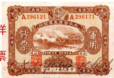
1922年·大本营度支处军用钞票的伍角币