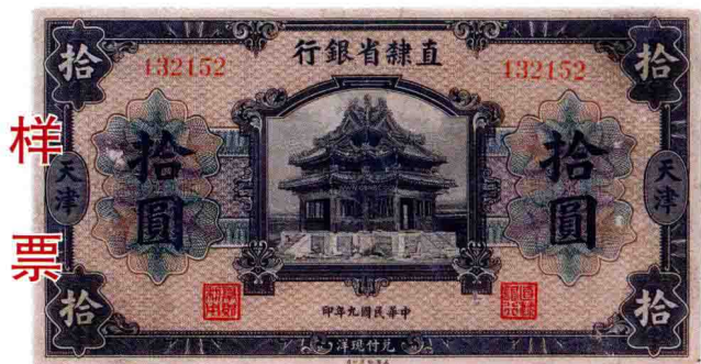
民国九年·直隶省银行拾圆