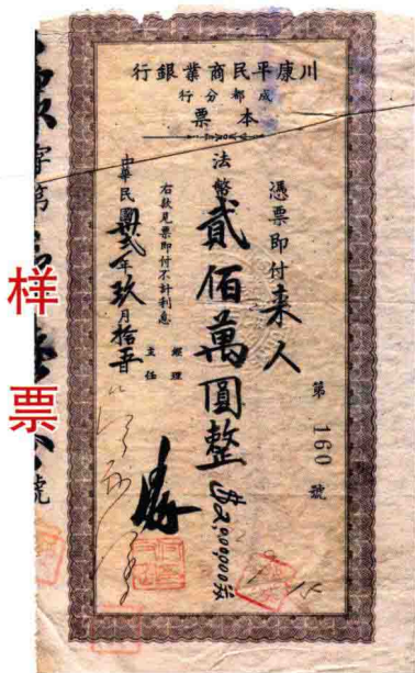
民国本票贰佰万圆整

一些省份为解决辅币缺乏问题，也曾以省银行名义发行过小额本票。然而，这种本票由于面值高、印刷质量差，很难防伪，通常只在很短的一段时间内流通。