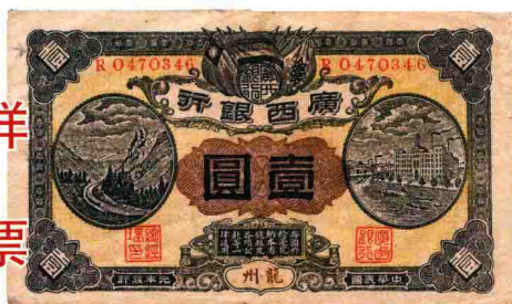
广西银行民国元年（1911年）加盖龙州壹圆