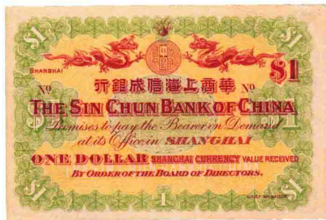
光绪三十三年·华商上海信成银行银元票壹元，载沣像