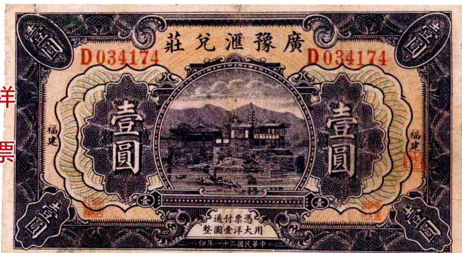
民国时期·广豫汇兑庄壹圆票

因为发行量不大，票的编号、年代等都采用手写的办法，且十分注重所盖印章。到目前为止，庄票多存于山东、湖南、山西、东北等地。