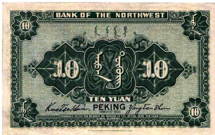
民国十四年（1925年）·西北银行财政版拾圆