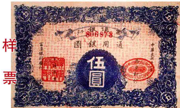
富滇銀行通用銀元伍圓券

在流通券当中，还有一种衍生出来的券——兑换券。兑换券是一种能够用来兑换金属货币的流通券。