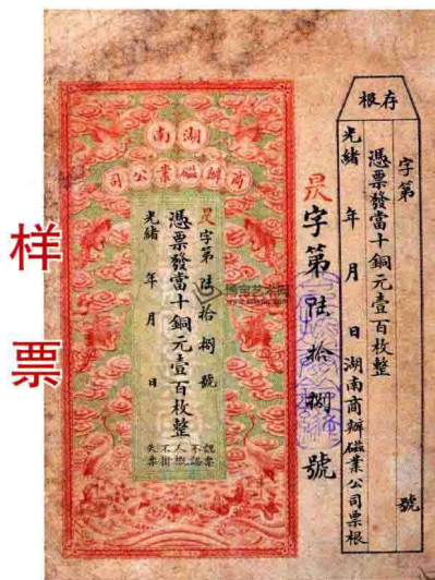
清光绪·湖南商办磁业公司当十铜元壹百枚